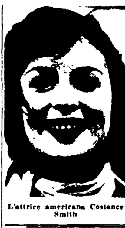
L'attrice americana Costance Smith

LONDRA, 15. — Paul Rotha, il noto produttore e regista inglese di documentari cinematografici, è stato ricoverato stamane in ospedale, in fin di vita, per un'infiammazione di stomaco.