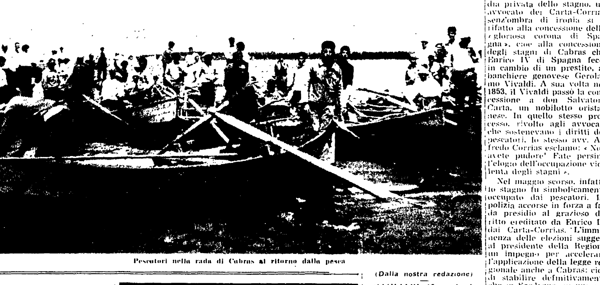
Pescatori nella rada di Cabras al ritorno dalla pesca

Non si applica la legge regionale che abolisce i diritti feudali di pesca - A Cabras la famiglia dell'ex presidente d.c. della Regione si richiama alla concessione di Enrico IV di Spagna per difendere i suoi privilegi