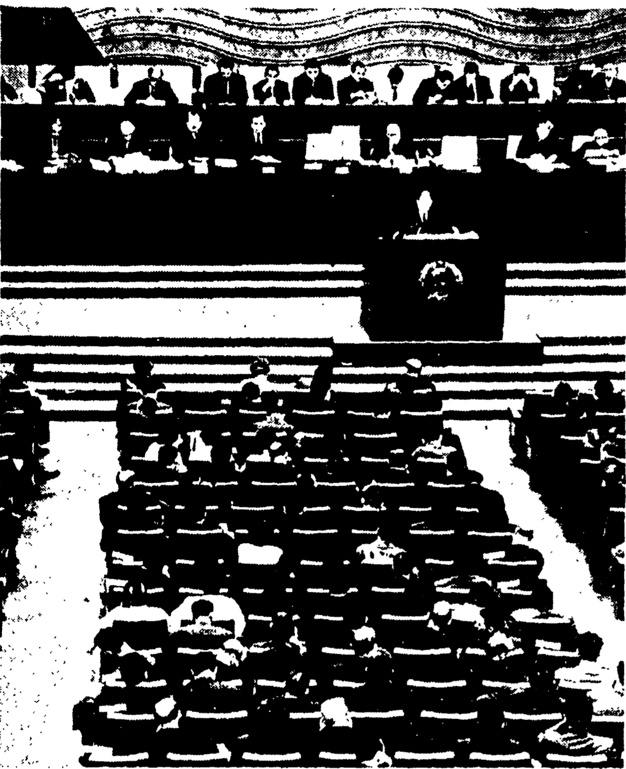
MOSCA — Uno scorcio della sala durante una delle giornate dei lavori del Congresso al quale hanno partecipato 930 delegati di tutti i paesi del mondo