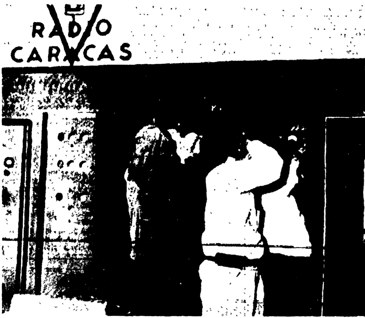
CARACAS — Poliziotti e tecnici della Radio mostrano come sono stati immobilizzati da quattro giovani democratici che hanno lanciato un appello contro la visita del presidente Kennedy in Venezuela

La salvezza del paese affidata alle masse popolari