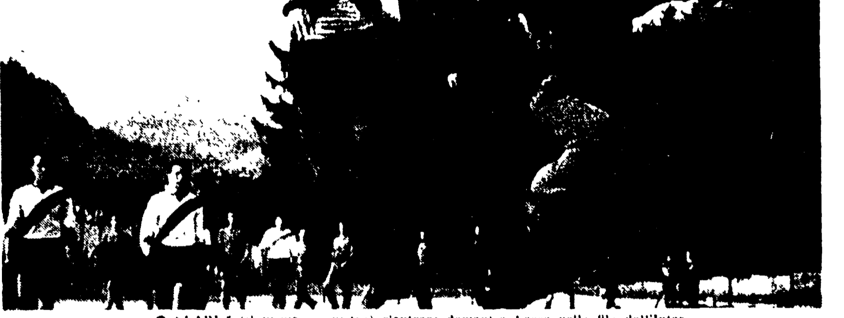
SUAREZ (al primo a sinistra) rientrerà domani a Lecco nelle file dell'Inter.

La Lazio ha vinto la partita contro il Flaminio con il punteggio di 2-1. Il gol è stato segnato da Barletta.