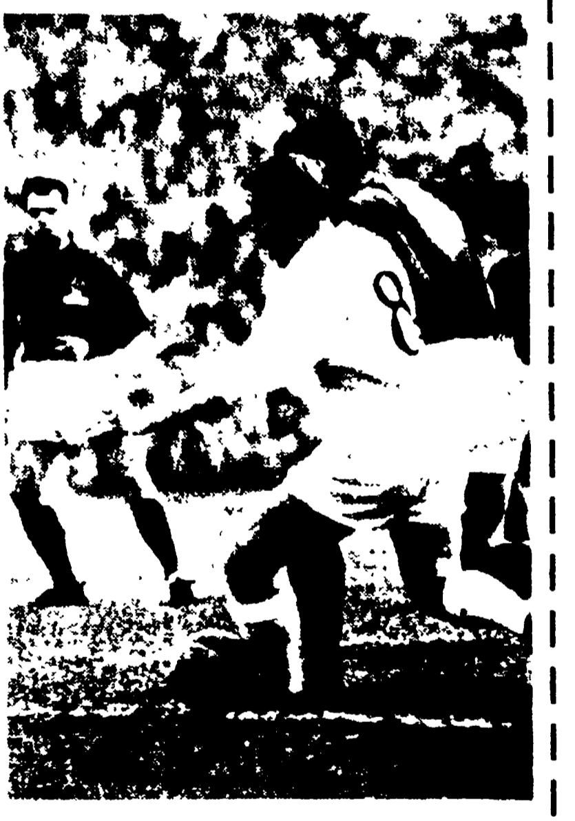
FRANCIA In TV ore 22,25