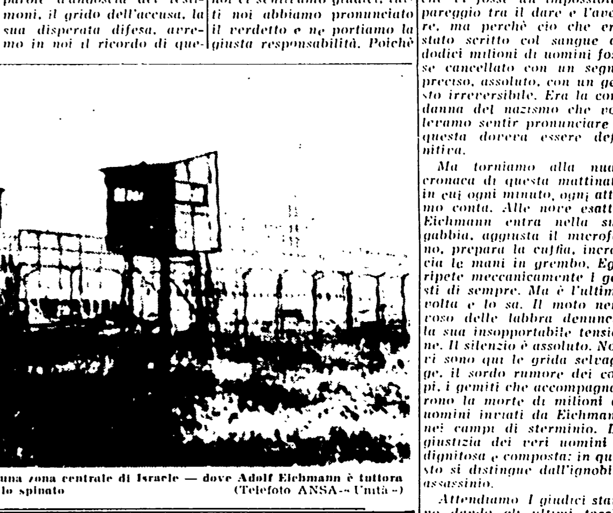
GERUSALEMME. - Questa è la prigione di Ramla - sita in una zona centrale di Israele - dove Adolf Eichmann è tuttora detenuto. L'edificio è circondato da una triplice barriera di filo spinato.