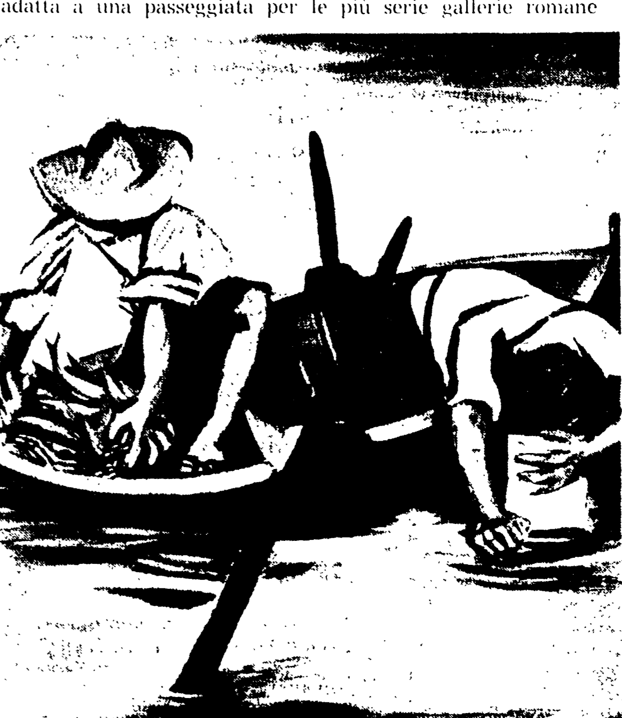
RENATO GUTTUSO - Pescatori di Scilla (1919). Questa bella pittura, che si vede già come un classico della pittura italiana contemporanea, è esposta a Roma alla galleria « Zanini », al Babuino, assieme ad altri dipinti di Guttuso e a un gruppo notevole di opere di Mario Mafai.

Esposizioni a un ritmo di fuoco d'artificio: sta accadendo qualche cosa di simile alla follia del mobile e dell'arredamento che trasformò molti «stracciaroli» romani in antiquari - Ma per chi abbia molta passione e poco denaro questa è la settimana adatta a una passeggiata per le più serie gallerie romane