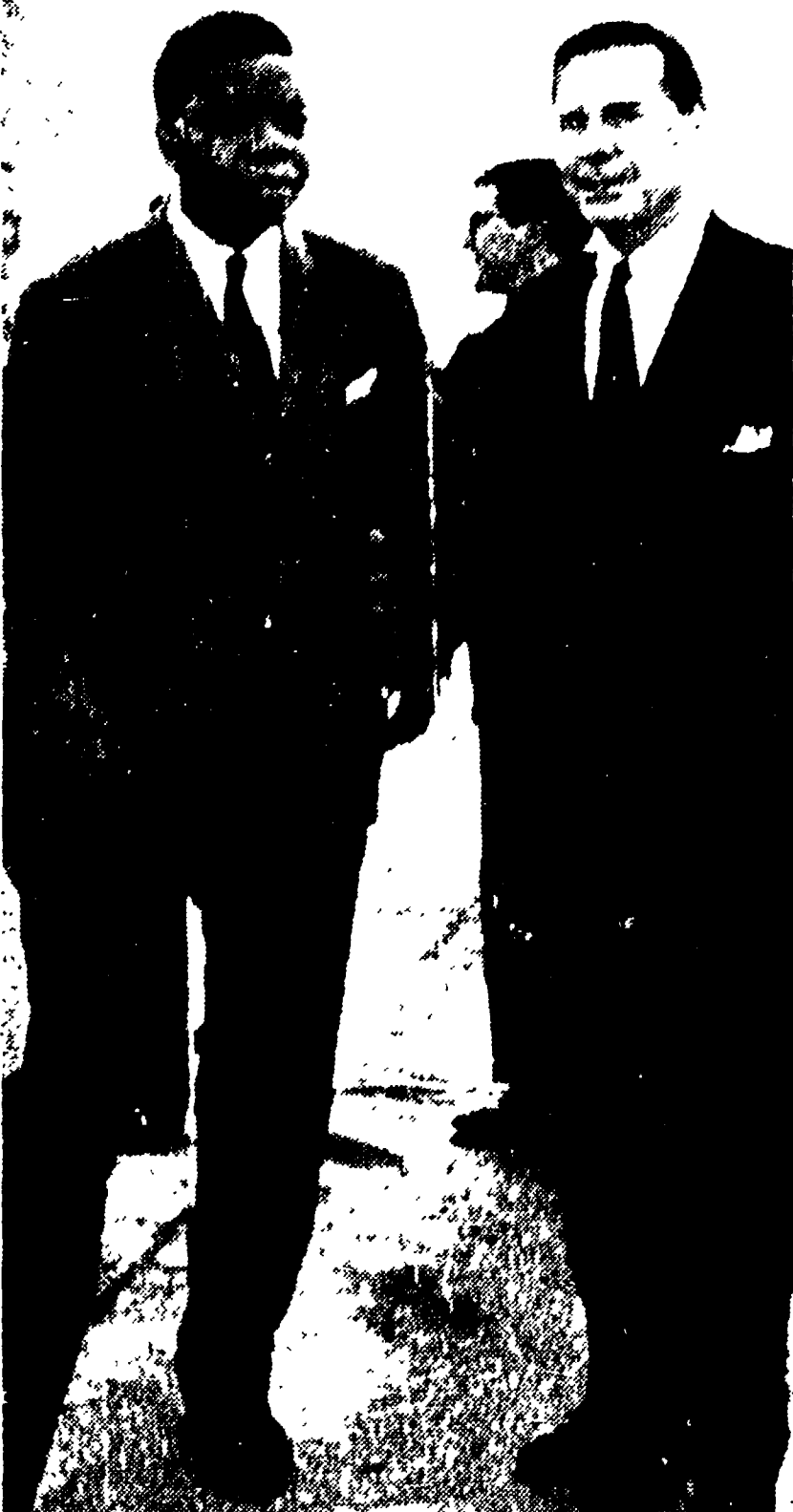
NDOLA — Ciombe all'aeroporto di Ndola con l'ambasciatore di Kennedy, Edward Gillison, alla partenza per Kitona, dove si incontrerà con Adula

L'ambasciatore americano ha accompagnato Ciombe fino alla località dell'incontro — Adula è giunto insieme al sottosegretario dell'ONU