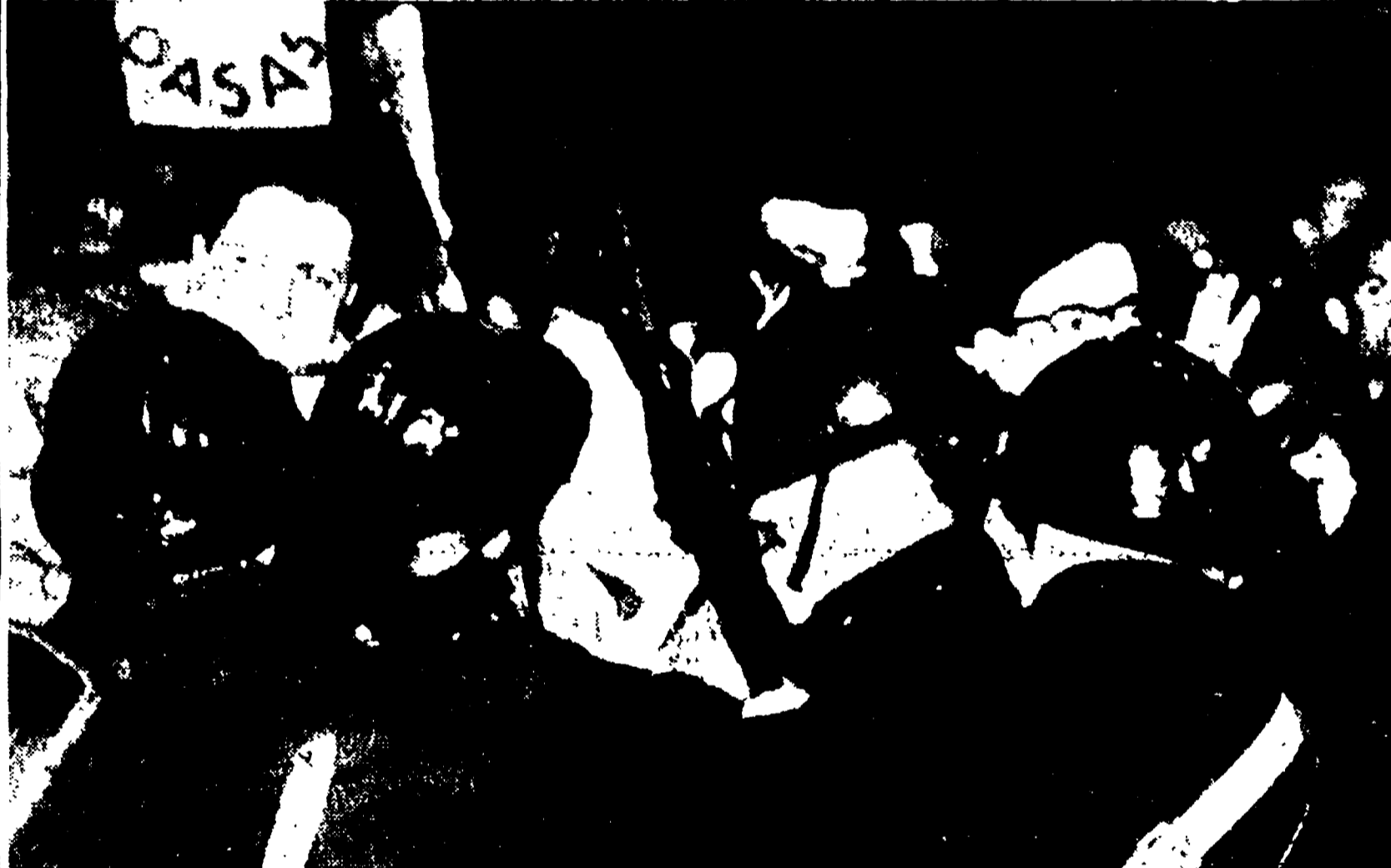
PARIGI - Una fase degli scontri tra polizia e dimostranti durante la manifestazione di ieri.