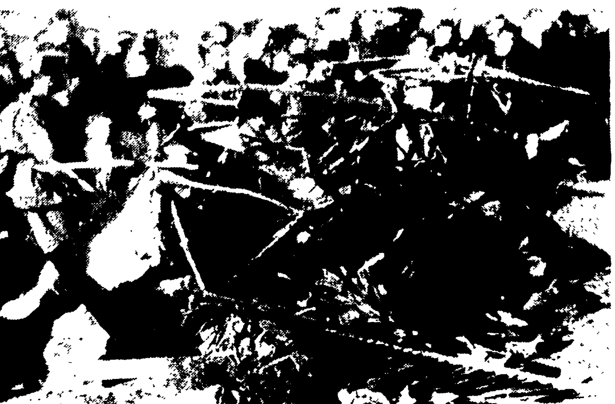
SIVIGLIA — La folla osserva sgomenta i resti dell'aereo che ha causato la morte di decine di persone

LOS ANGELES, 19. — In un discorso pronunciato sabato sera al municipio di Los Angeles il sottosegretario di Stato americano George Ball ha dichiarato che il segretario dell'ONU non fosse esistita, per il conseguimento degli obiettivi di raggiungere nel Congo avremmo dovuto crearla. Altrimenti la partita sarebbe già stata perduta». In ultima analisi — ha continuato Ball — gli interessi del Katanga e del Congo sono paralleli. Ball ha enunciato le grandi linee della politica della amministrazione Kennedy per il Congo: «Il Congo è una nazione unita, un governo stabile non comunista» per tutto il Congo. Questo governo dovrà essere deciso a salvaguardare la sua indipendenza e a cooperare con gli Stati Uniti e con gli altri «paesi liberi» il governo Adula, ma gli Stati Uniti non si impegneranno a risolvere il problema Adula a risolvere il problema della secessione del Katanga e della secessione di Giza.