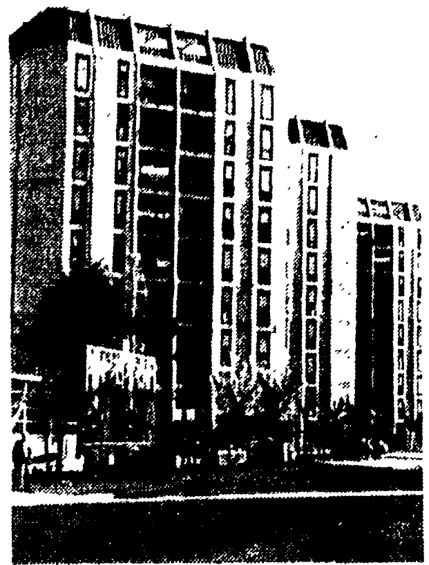
Vivaci scontri tra proprietari e inquilini: è o non è una abitazione di lusso?

chiesta e partita dalla assemblea ordinaria e straordinaria degli azionisti tenutasi l'altro ieri a Torino. «Sono già trascorsi due anni dall'ultimo ritocco delle tariffe e perciò se vogliamo affrontare il vasto programma di potenziamento degli impianti, gli utenti devono contribuire». Ma una volta che questo potenziamento venga fatto a spese di chi guadagna miliardi. Il vasto programma prevede una spesa che si aggira sugli ottanta miliardi da investire in centrali urbane ed interurbane, nell'acquisto e nella posa dei cavi, in apparecchiature di trasmissione in ponte radio ed alte frequenze in apparecchi d'abbonamento, in edifici ed in attrezzature varie. Secondo studi accurati nel prossimo quadriennio 1962-1965 il numero degli abbonati al telefono dovrebbe poter aumentare di circa 1 milione e 123 mila. Come è noto, a Roma la Teti ha allacciato nei giorni scorsi il cinquecentomillesimo abbonato.