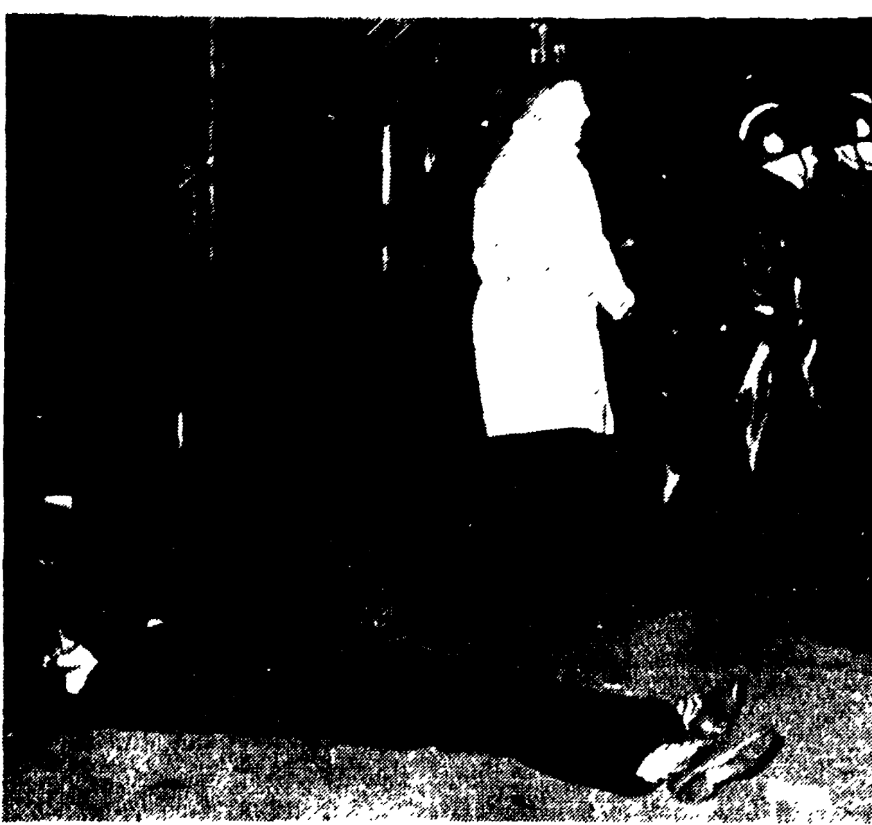
PARIGI — Un dimostrante ferito dalla polizia viene inumidato al suolo

Gli osservatori, a Leopoldville, si chiedono quale sarà ora l'atteggiamento di Ciombe nei confronti dei leaders congolese che, in passato, egli si era rifiutato di riconoscere come suoi superiori politici. Gli osservatori non escludono che Ciombe ora che le sue forze armate sono state praticamente sconfitte da quelle del governo centrale, e in passato, egli si era rifiutato di riconoscere come suoi superiori politici. Gli osservatori non escludono che Ciombe ora che le sue forze armate sono state praticamente sconfitte da quelle del governo centrale, e in passato, egli si era rifiutato di riconoscere come suoi superiori politici. Gli osservatori non escludono che Ciombe ora che le sue forze armate sono state praticamente sconfitte da quelle del governo centrale, e in passato, egli si era rifiutato di riconoscere come suoi superiori politici.