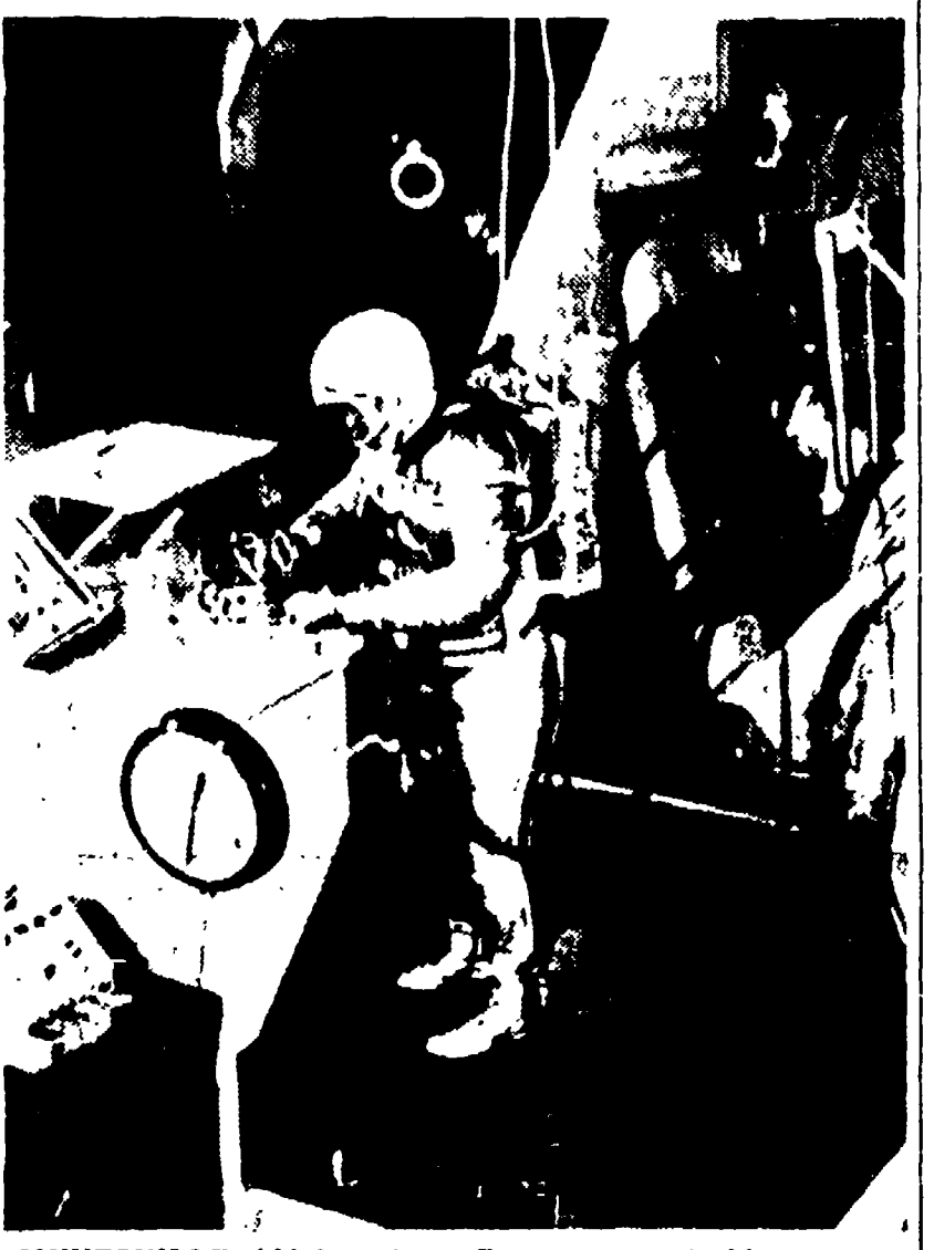
MUNTSVILLE (Alabama) — Ecco come potrebbe presentarsi l'interno di un'astronave da lanciare verso Marte nel prossimo futuro. Il fotografo ha potuto effettuare la ricostruzione riprendendo un tecnico del centro di voli spaziali Marshall, in tuta spaziale gonfiata d'aria, intento ad eseguire un lavoro meccanico.