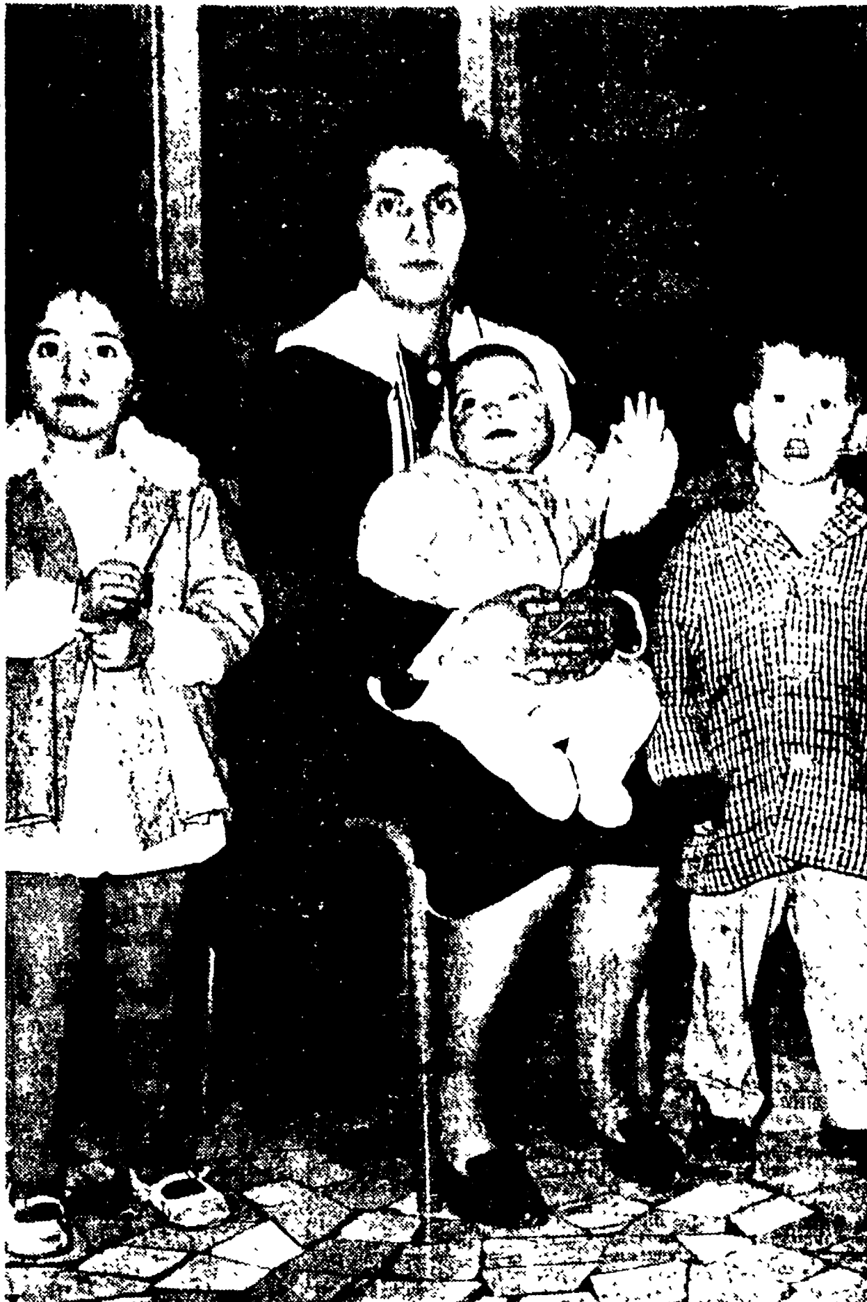
La moglie del disoccupato che ha tentato di uccidersi con tre dei suoi bambini