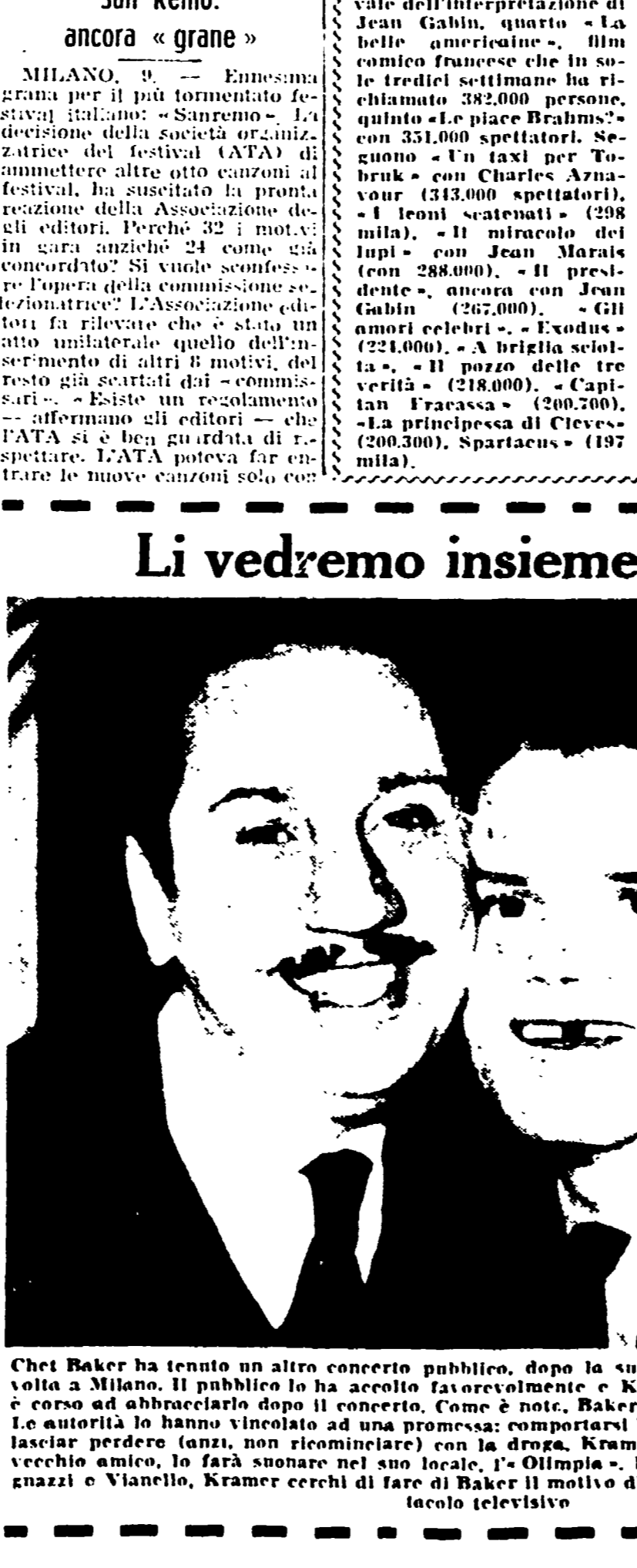
Chet Baker ha tenuto un altro concerto favorevole e il liberazione dal carcere. Questa volta a Milano. Il pubblico lo ha accolto favorevolmente e il liberazione dal carcere...

PRIME VISIONI. Adriano: Madame Sans Gêne. Adriano: Madame Sans Gêne. Adriano: Madame Sans Gêne.