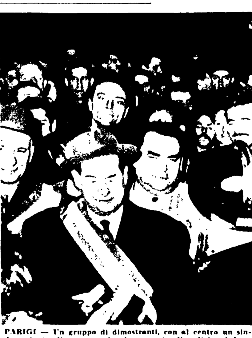
PARIGI — Un gruppo di dimostranti, con al centro un sindaco, tenta di superare lo sbarramento di polizia al boulevard Magenta

PARIGI, 12. — Trentamila poliziotti hanno completamente bloccato stasera tutto il centro di Parigi, dalla Piazza della Bastiglia a quella della Repubblica, dove i parigini avrebbero dovuto manifestare in silenzio contro le provocazioni fasciste. Bloccate le stazioni del Metro, chiuse le strade e i boulevard, messe in posizione le autobluende, la zona è stata trasformata in un vero e proprio campo trincerato. Pompieri, poliziotti sono sistemati persino sui tetti: uno è scivolato precipitando in un