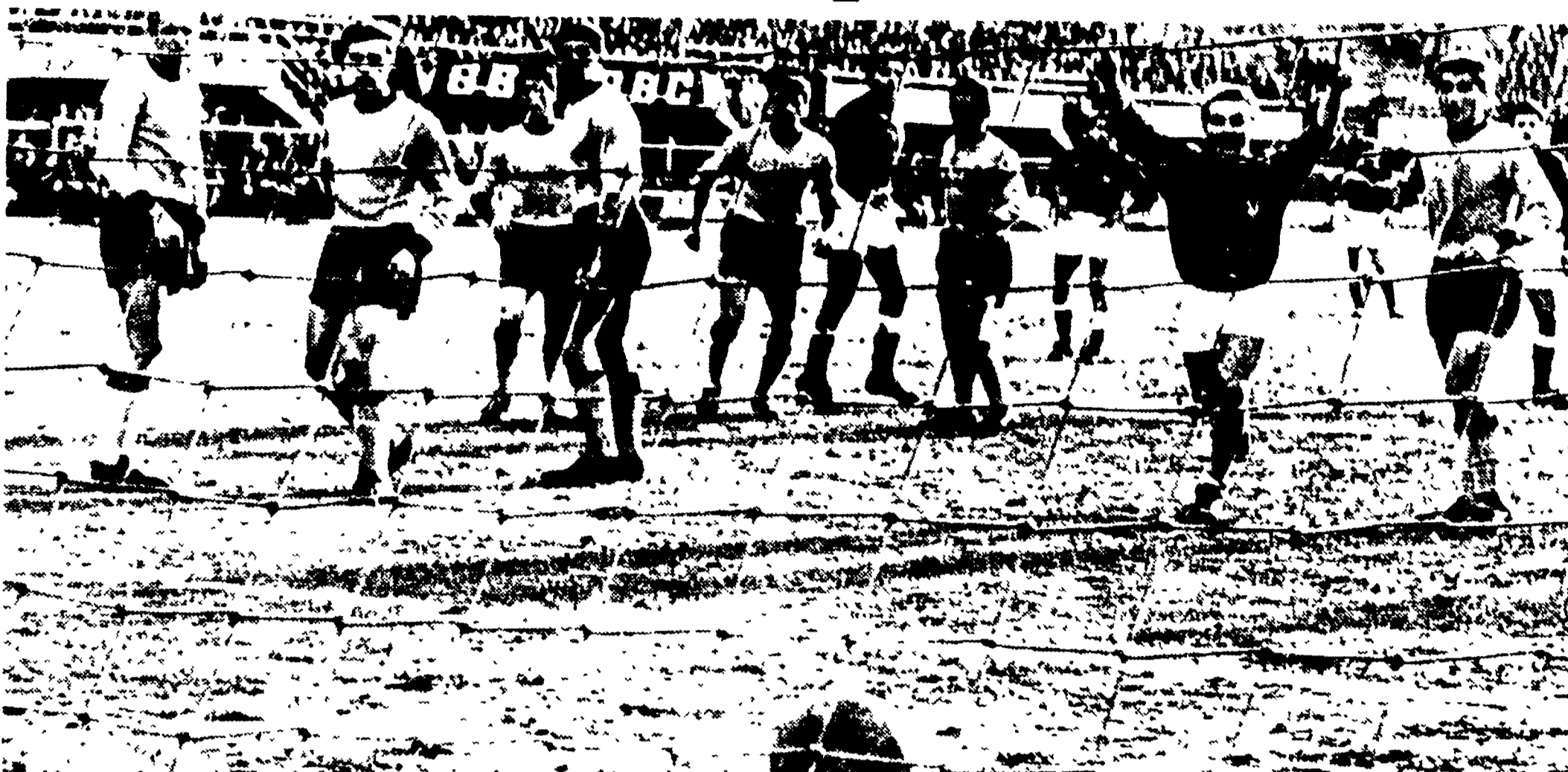
FIORENTINA-PALERMO 2-0 — Il pallone rotola verso la rete palermitana, ormai imprendibile. « HAMRIN » scatta. È il secondo goal « viola ».

Anche il Milan alle prese con notevoli difficoltà - L'Inter gode ancora di molti favori