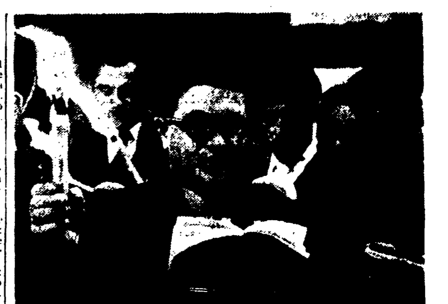
«I NUOVI ANGELI» di Ugo Gregoretti che il Titano presenta in tutta Italia, sta ottenendo un vivo successo anche a Roma