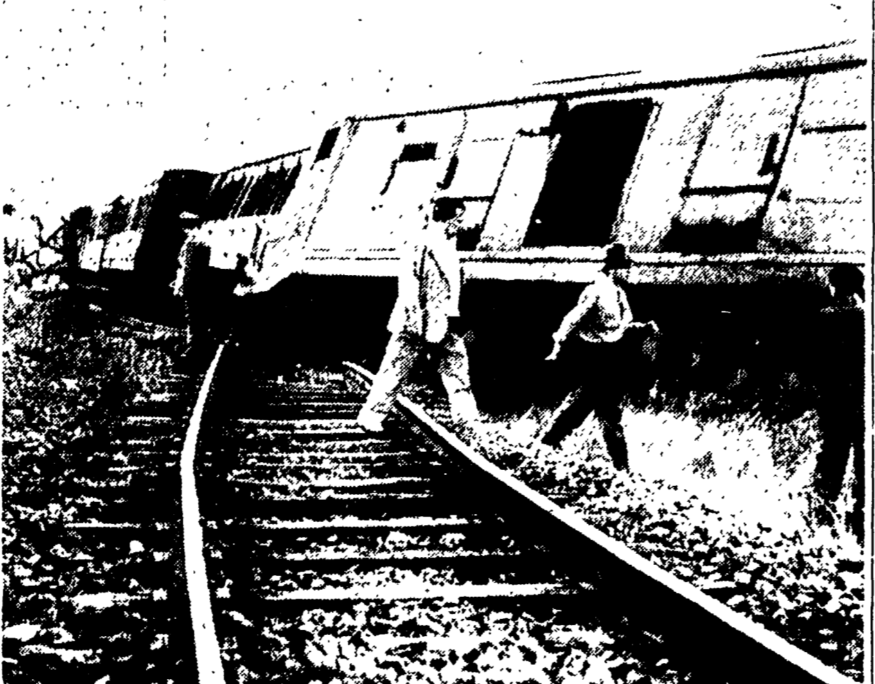
1 LUGLIO 1958: un treno distrugge un camion a Ponte Galeria. Una persona rimane uccisa e 14 ferite fra i rottami. 12 LUGLIO 1961: un altro convoglio distrugge una «seleonta». Anche questa volta c'è un morto e un ferito. In quattro anni nulla è cambiato: accanto al passaggio a livello c'è in più solo la carcassa di una nuova vettura, accanto ai rottami arrugginiti dell'autotreno sguaiolato che sembrano il simbolo dell'abbandono della linea ferroviaria mantenuta. La gente continua a morire: nessuno muove un dito per eliminare quell'incubo mortale. Ma attenti alle altre vittime e come commettere altri delitti: bisogna intervenire subito