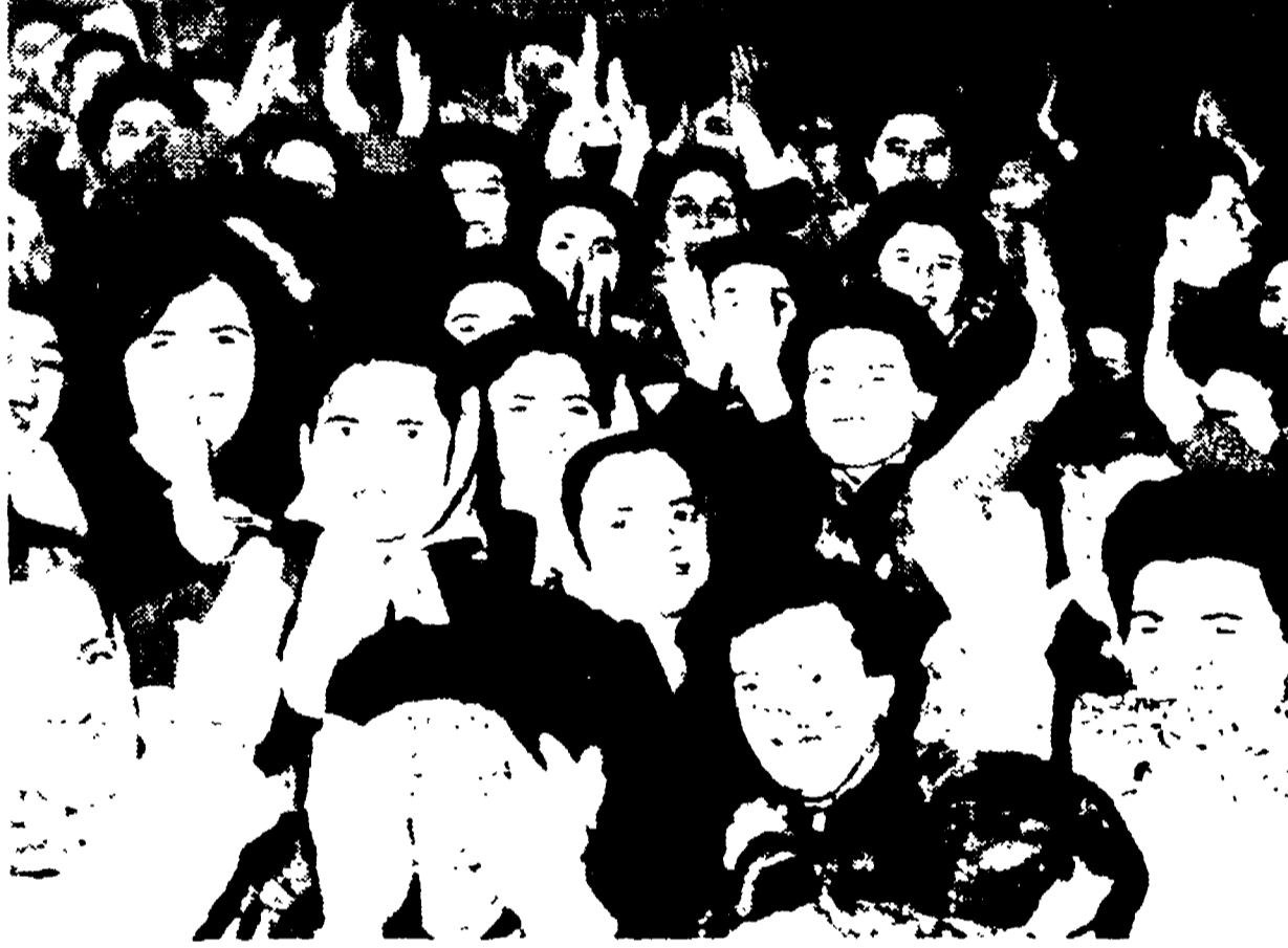
PERUGIA — Le valorose operaie del biscottificio Colussi esprimono festanti il loro entusiasmo per il provvedimento preso dal sindaco

Il Comune interviene in difesa delle lavoratrici