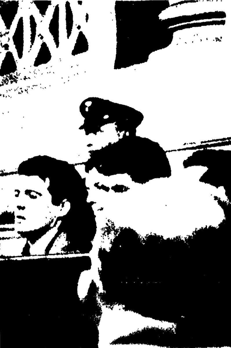
I giovani dinamitardi neozisti ascoltano in Assise il racconto di un loro complice.

Proteste fra il pubblico durante la deposizione dello Wintersberger, l'attentatore che fu ferito da una bomba sull'autobus « 99 » - Squallida preparazione e cinico sorriso - Gli interrogatori degli altri imputati