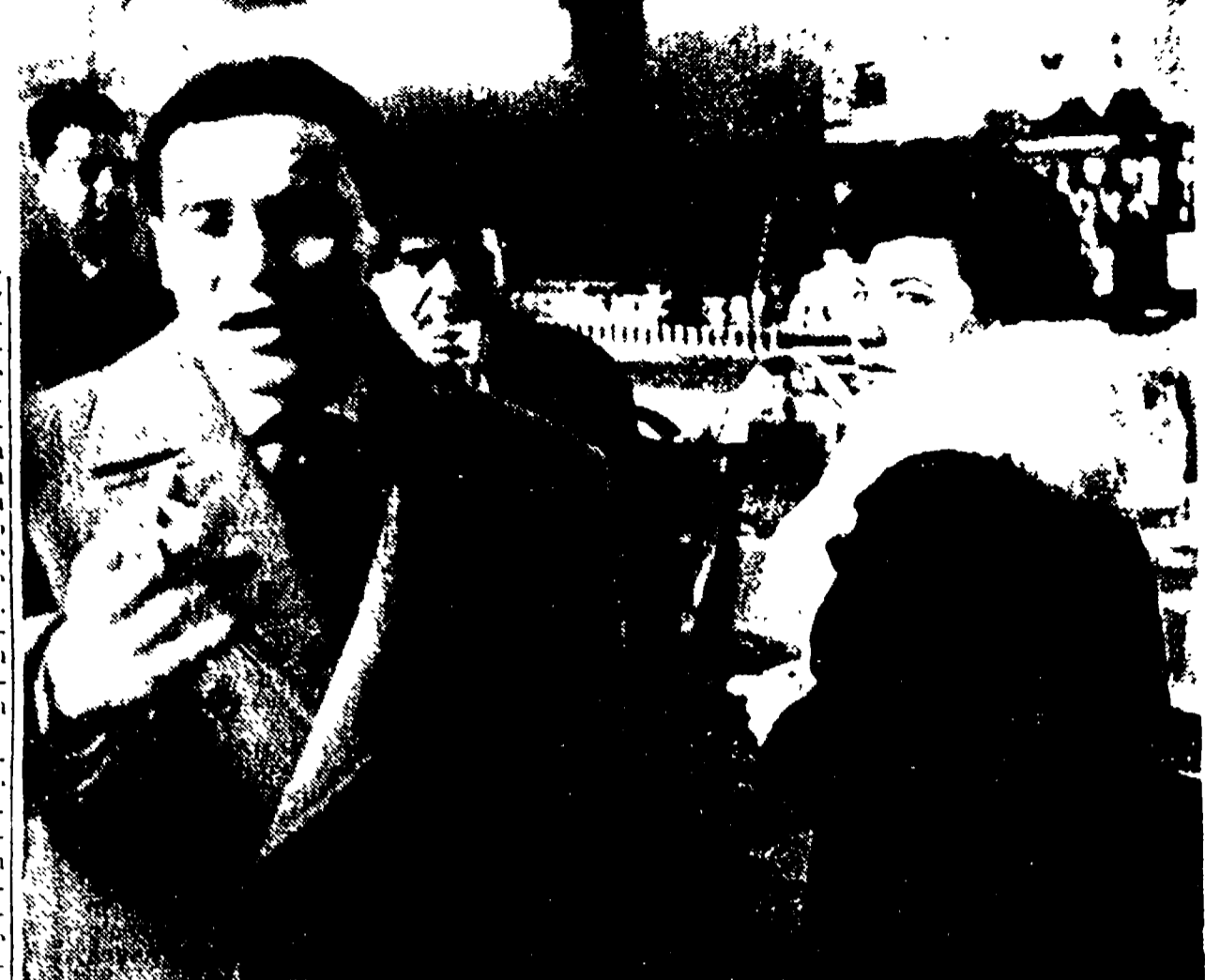
Il noto calciatore e sua moglie

«Un duro colpo alla difesa degli imputati è stato dato ieri mattina dal capitano»