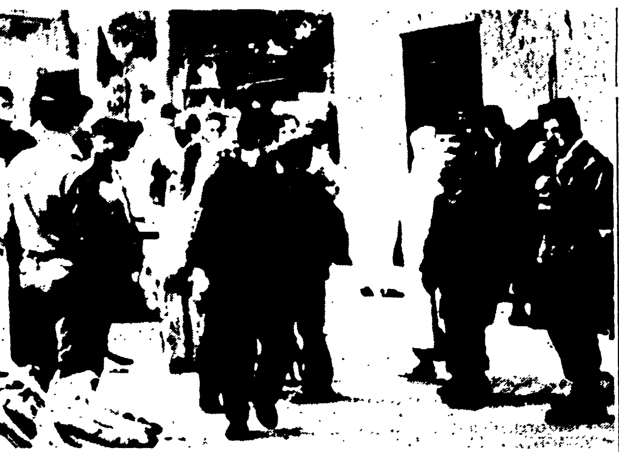
ALGERI - Il « cessate il fuoco » è nell'aria: militari francesi all'ingresso della casbah senza il consueto armamento di guerra

Prime « rivelazioni » sul contenuto dell'accordo date da « Paris-press » - Solo i civili firmerebbero il documento in una riunione franco-algerina che si terrebbe a Melun o a Versailles