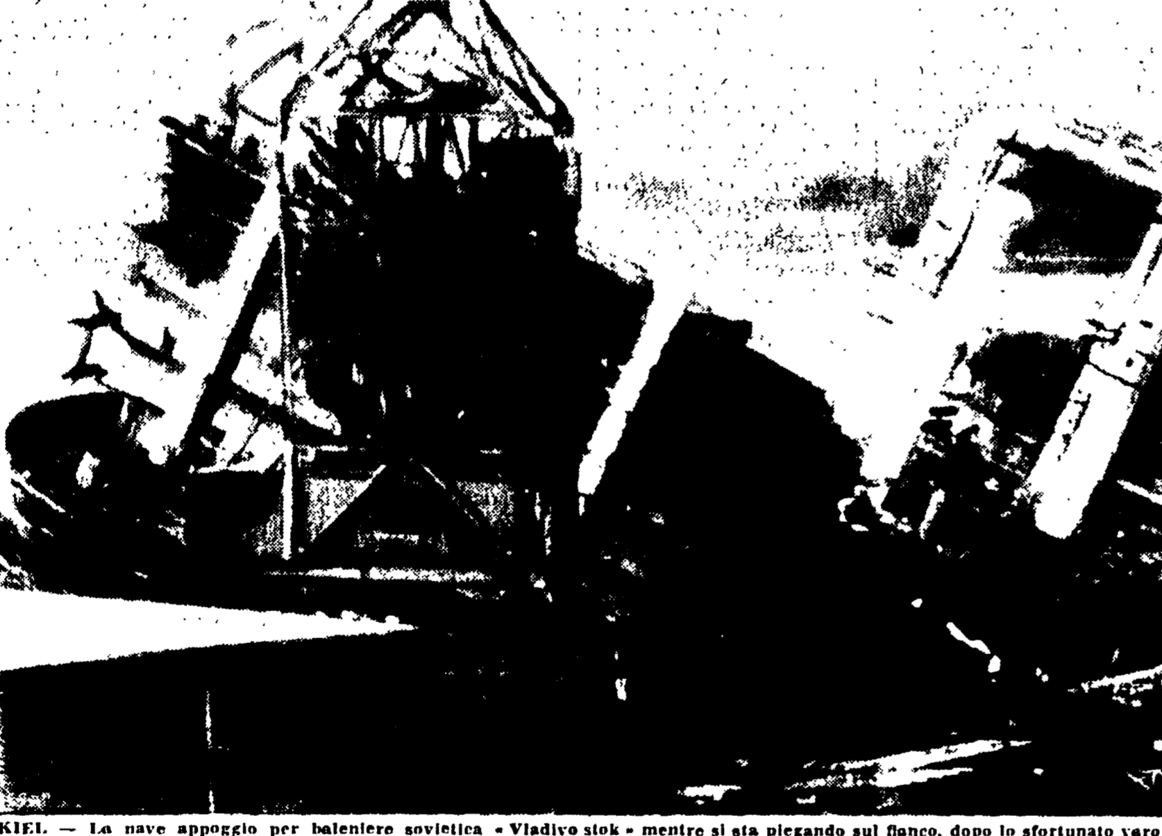
KIEL. — La nave appoggio per balenieri sovietica «Vladivo stok» mentre si sta piegando sul fianco, dopo lo sfortunato varo

Lo spettacolare incidente è avvenuto poco dopo il varo della grossa unità