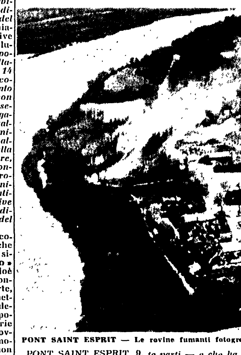
PONT SAINT ESPRIT — Le rovine fumanti fotografate da un aereo poco dopo il disastro