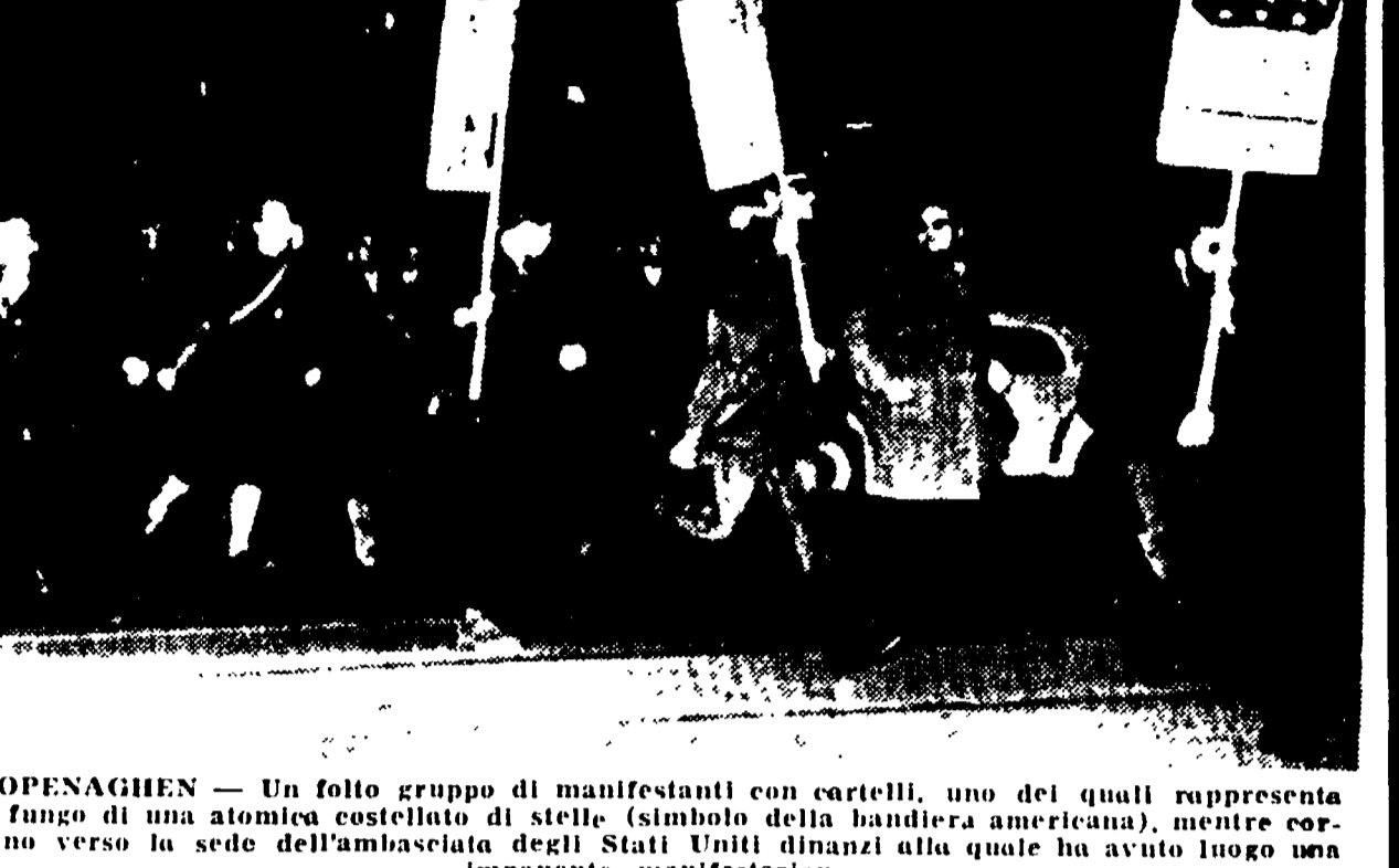
COPENHAGEN. — Un folto gruppo di manifestanti con cartelli, uno dei quali rappresenta il fucino di una atomica costellato di stelle (simbolo della bandiera americana), mentre corrono verso la sede dell'ambasciata degli Stati Uniti dinanzi alla quale ha avuto luogo una imponente manifestazione.

(Da nostro corrispondente) BERLINO, 27. — L'organo centrale della SED Neues Deutschland, riferendo nel suo editoriale odierno i concetti espressi da Gromiko nel discorso al Soviet Summit, analizza l'andamento dei colloqui sovietico-americani per Berlino ovest e conclude sottolineando la provata utilità di questi colloqui, ad onta delle manovre di disturbo di Bonn e dichiara: «I colloqui proseguono tutti i tedeschi ragionevolmente concordano con l'auspicio espresso dal Ministro degli Esteri sovietico che essi possono condurre a concreti risultati».