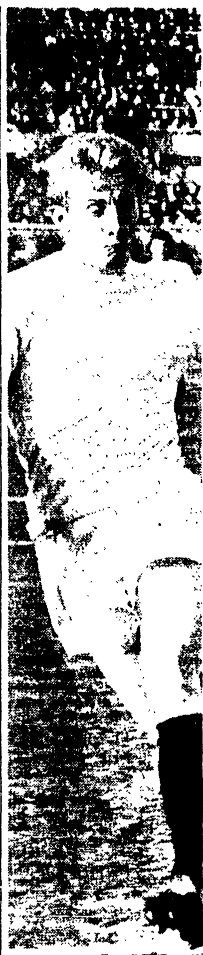
DENIS LAW che può considerarsi giallorosso a tutti gli effetti è nato il 21 febbraio 1940 ad Aberdeen (Scozia). Interno sinistro, proveniente dal Manchester United è alto 1,76 pesa 70 chili ed è celibe.