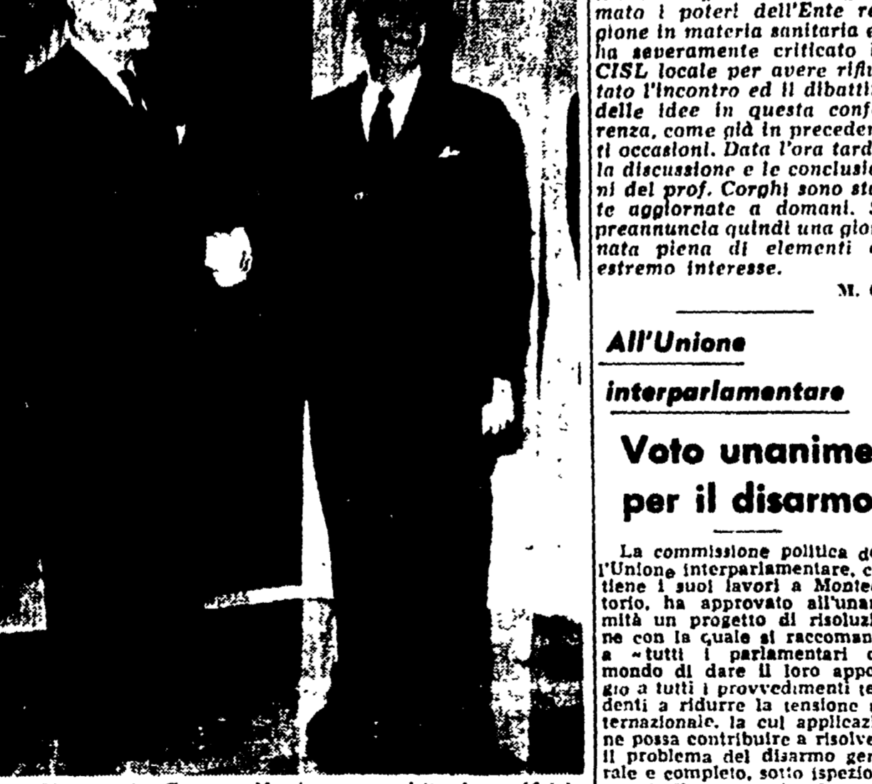
L'onorevole Gaetano Martino sta « visitando » ufficialmente l'Italia in qualità di ministro. In alto: il ministro Martino con il segretario del PCI, Palmiro Togliatti. Sotto: il ministro Martino con il segretario del PCI, Palmiro Togliatti.