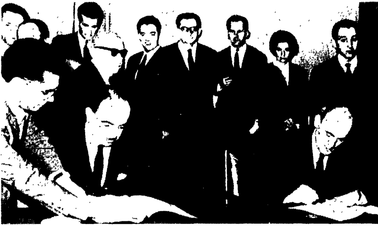
BELGRADO. Italia e Jugoslavia hanno deciso, al termine delle conversazioni svoltesi a Belgrado fra il ministro del commercio Preti e il suo collega Kratzer, di liberalizzare le importazioni italiane dalla Jugoslavia e di espandere ancora l'interscambio fra i due paesi. Nella foto: i ministri Preti e Kratzer mentre firmano il protocollo degli accordi raggiunti nel corso delle conversazioni