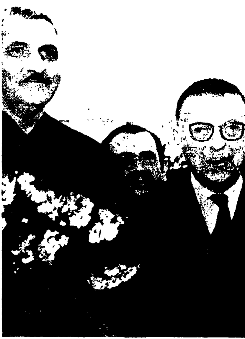
MOSCA - Jean Paul Sartre (a destra) fotografato con lo scrittore sovietico Constantin Simonov al suo arrivo nella capitale sovietica.