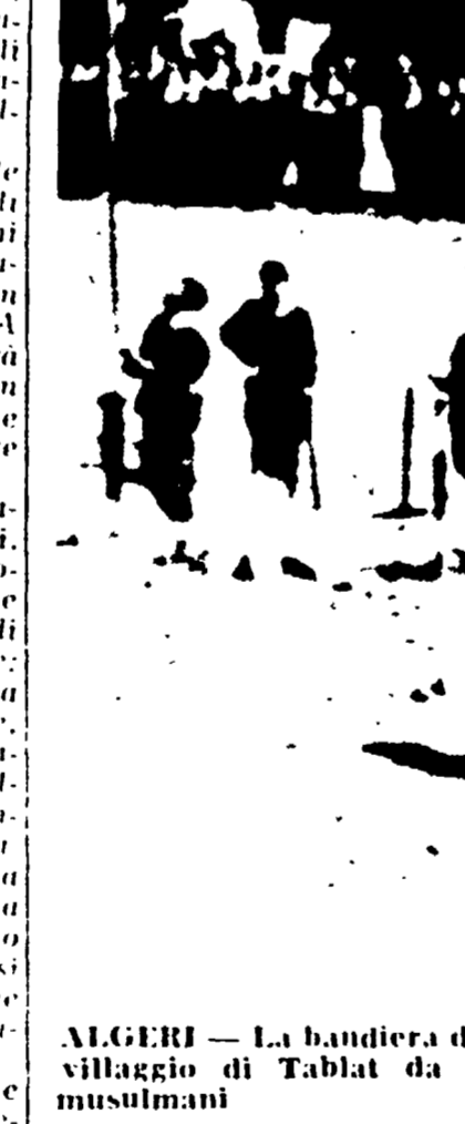
ALGERI - La bandiera del FLN viene issata nel piccolo villaggio di Tablat da un drappello di combattenti musulmani.