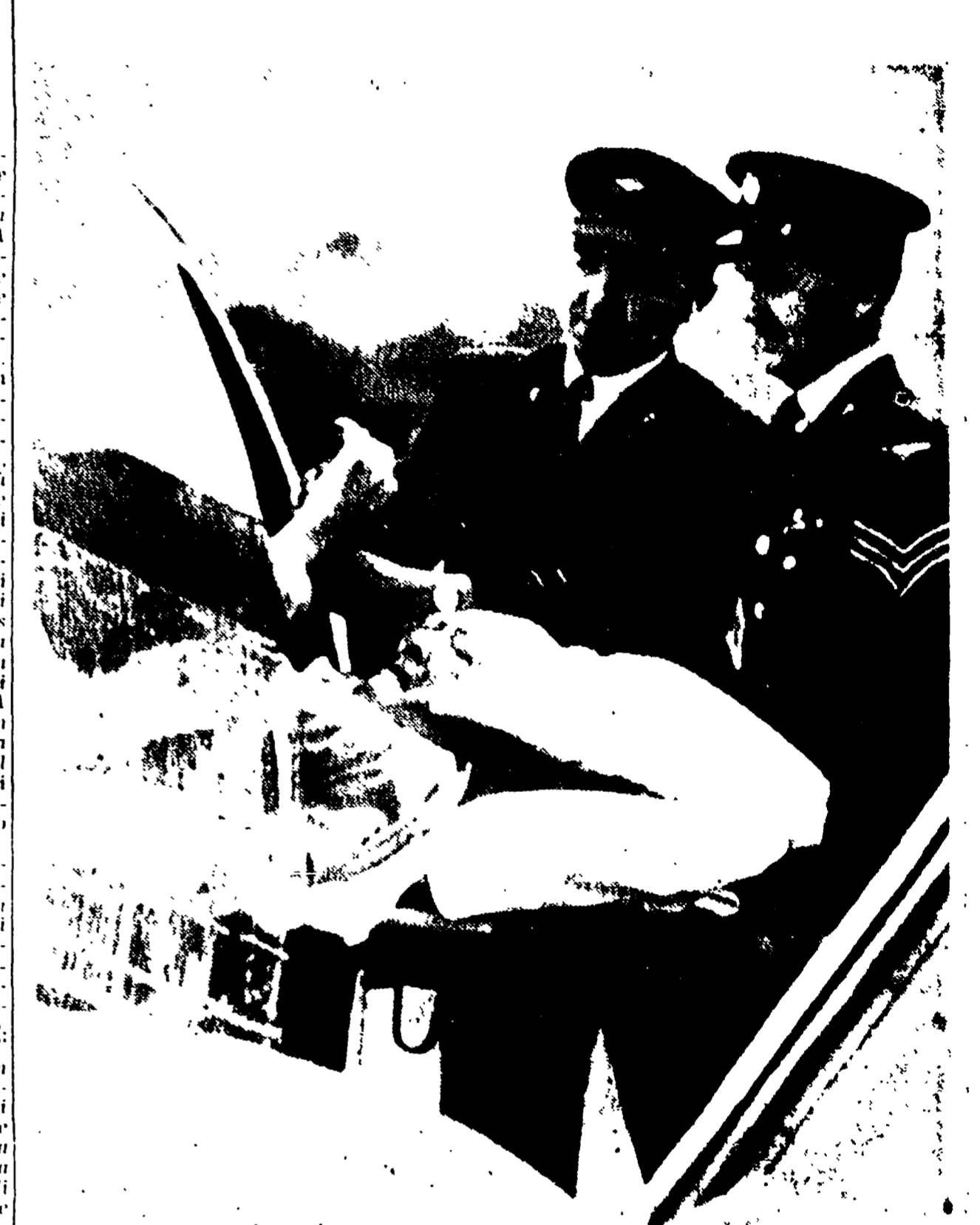
LONDRA - Winston Churchill al suo arrivo all'aeroporto londinese.