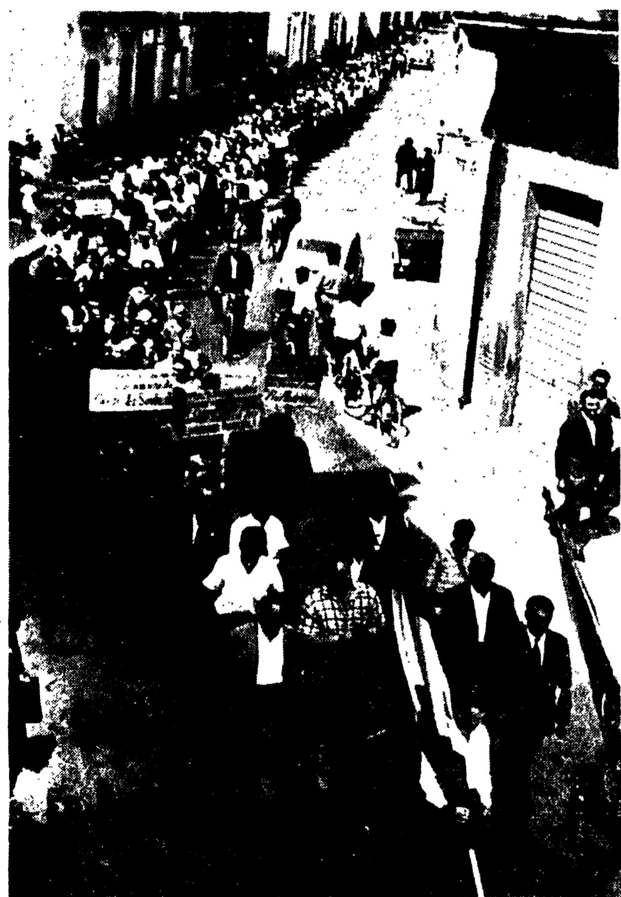
S. SEVERO — Un corteo di braccianti porta le rivendicazioni nelle vie del centro.

Vivaci manifestazioni nei centri maggiori