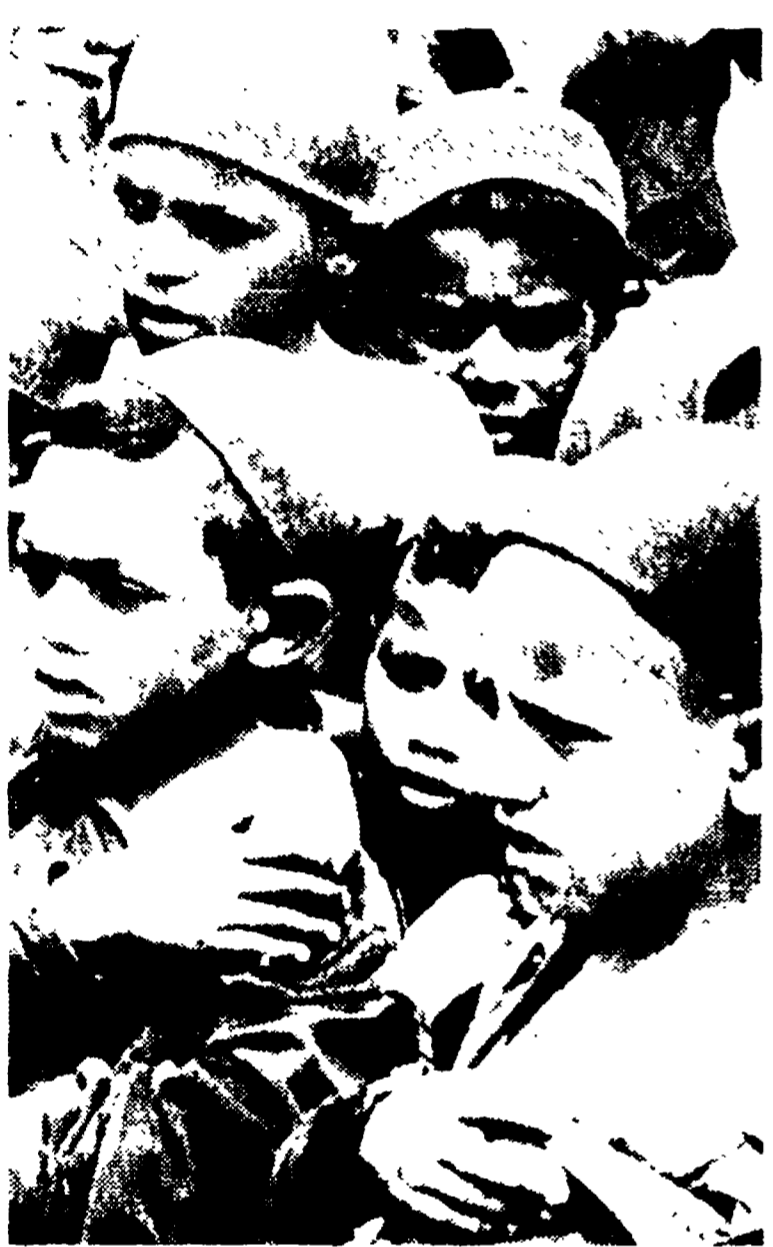
Bambini profughi al confine tra l'Algeria e la Tunisia nel pressi del villaggio Hai-endra.

Occorrono medici, medicine, plasma, vestiario - La solidarietà in Italia