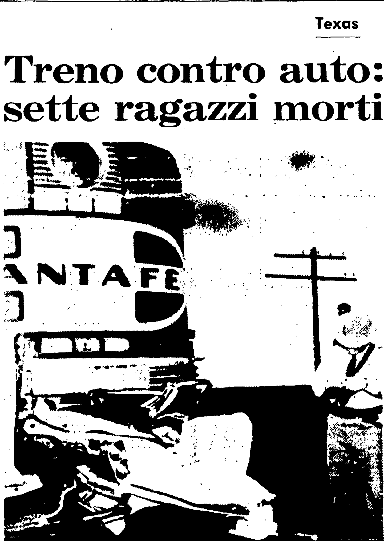
LUBBOCK (Texas) — Sette ragazzi sono rimasti uccisi nell'auto sulla quale viaggiavano che è stata travolta ad un passaggio a livello da un treno passeggeri.

SAN FRANCISCO, 10. Un terzo pallone-gigante che trasporta delle capsule contenenti due scimmie, alcuni criceti, tessuti animali e apparecchi per la registrazione delle reazioni degli animali e la misurazione delle radiazioni è stato lanciato giovedì da Goose Bay, nel Labrador.