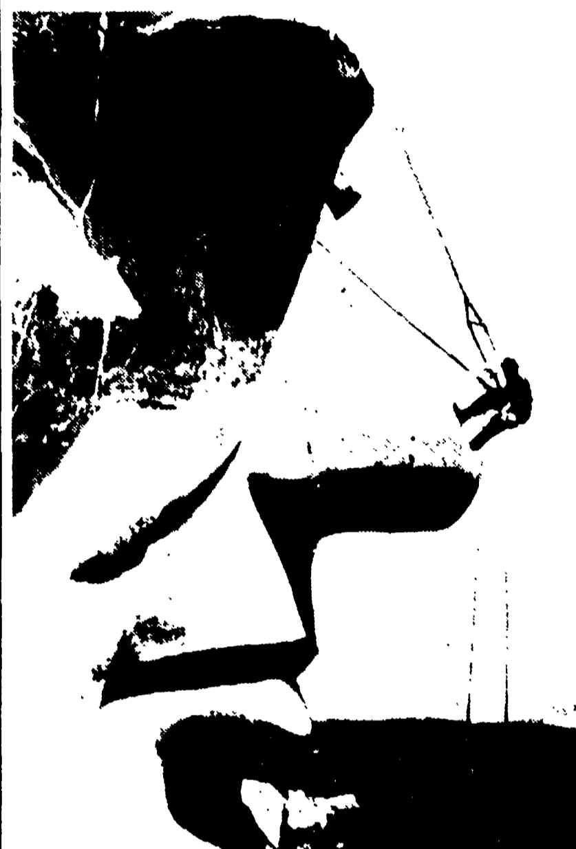
SUD DAKOTA (USA) — Capita a pochi di togliersi la soddisfazione di graffiare il naso di un grande presidente. Un operaio si è tolto questa soddisfazione: ha graffiato, inebriato e lucidato il naso di Abramo Lincoln e nessuno gli ha detto niente. Anzi lo hanno pagato. Lo operaio della foto, infatti, è uno dei tanti addetti alla manutenzione delle celebri sculture del monte Rushmore.