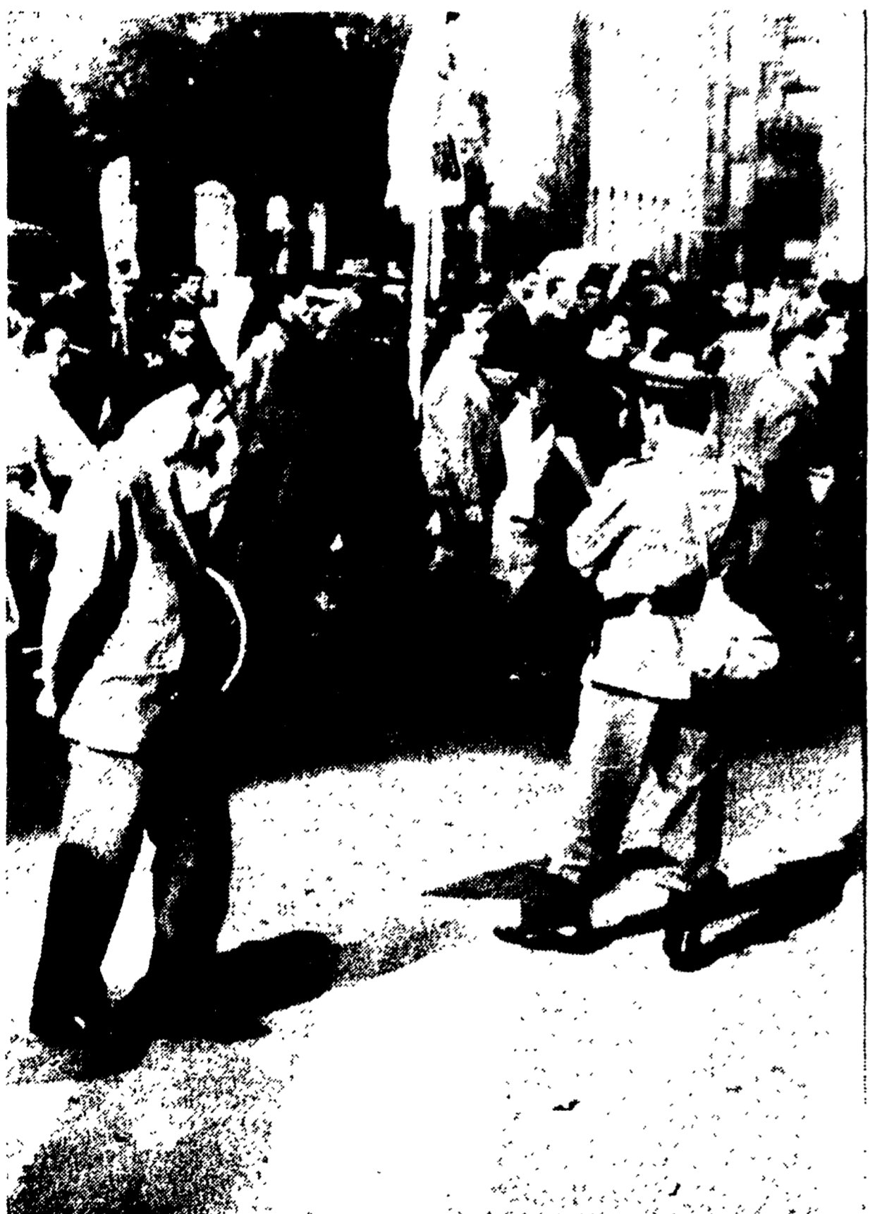
BOLOGNA — Diecimila lavoratori — operai e contadini — hanno sfilato sabato scorso per le vie della città manifestando per la riforma agraria e l'affermazione del potere sindacale nella fabbrica e nelle campagne. Nella foto: un momento della sfilata.

Domani, con uno sciopero unitario di mezza giornata, riprende l'azione dei tantissimi edili romani nella conquista di un rapporto di lavoro moderno. A fine di mezzogiorno, i militi resteranno deserti: scioperanti si raccoglieranno quindi a Porta San Paolo, dove alle 13,30 i dirigenti sindacali della categoria prenderanno parte ad un comizio.