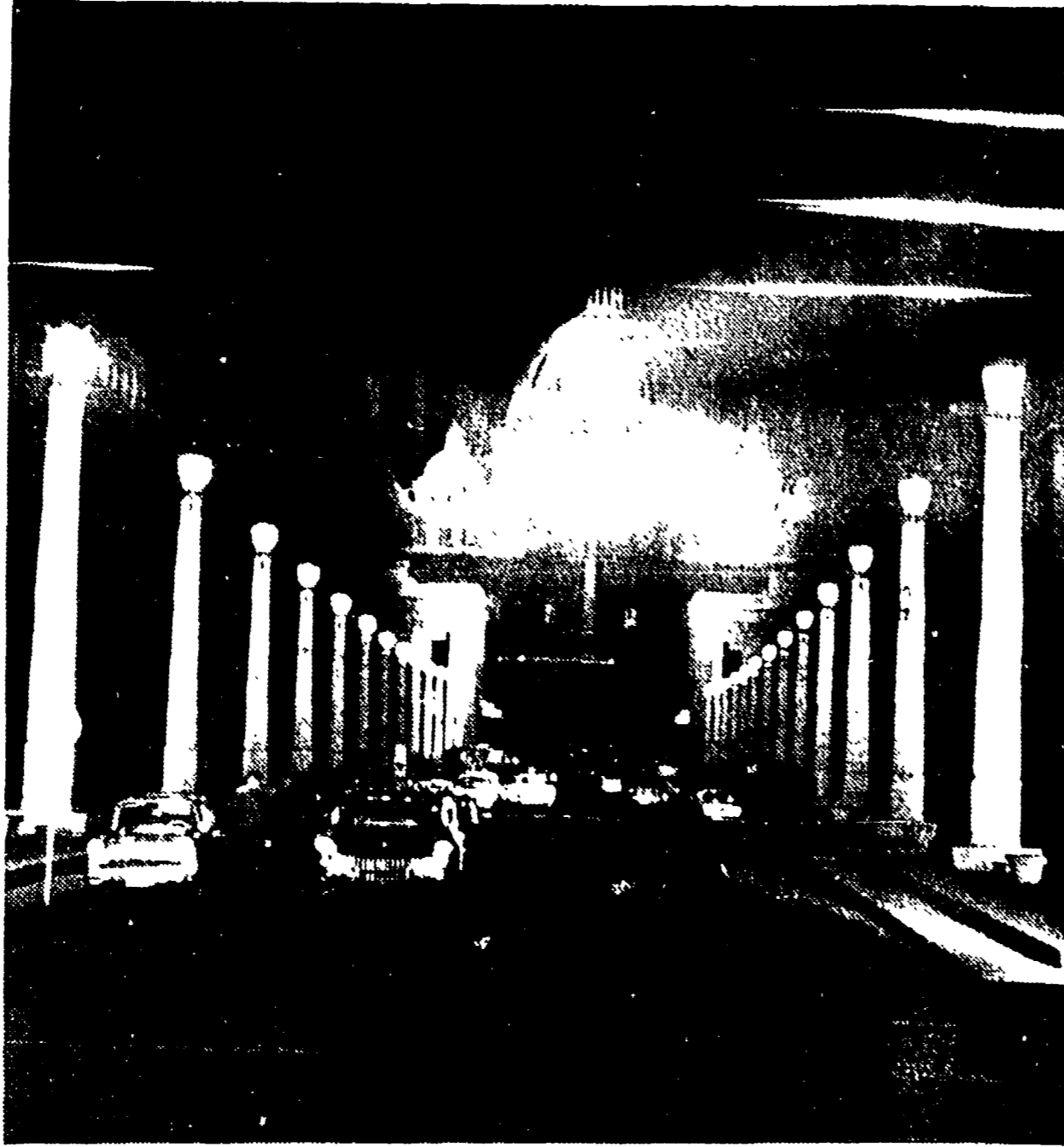
Spettacolo inconsueto ieri sera a S. Pietro: il «cappellone» era illuminato a giorno con intensi riflessi azzurri. Era la prova che un gruppo di generi stava effettuando per l'illuminazione della chiesa così come sarà attuata il giorno del Concilio

La statua sarà vestita per la seduta inaugurale - Le spese per allestire l'aula