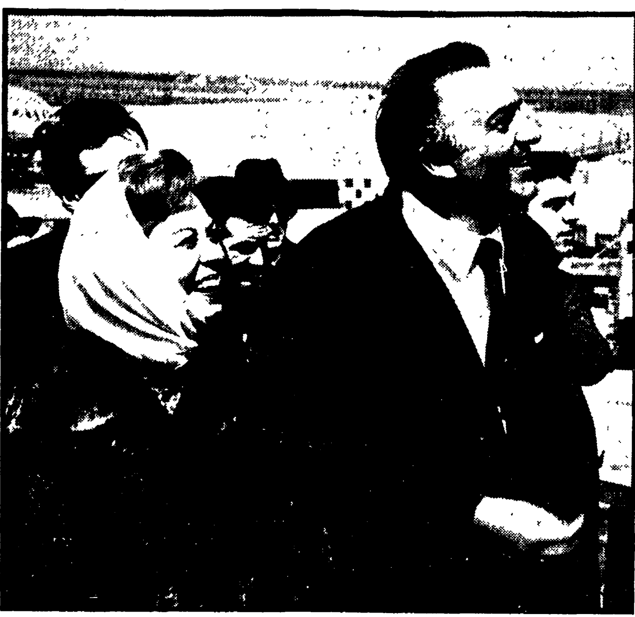
Federico Fellini e la troupe (possiamo chiamarla così) italiana per gli Oscar sono rientrati ieri a Roma poco dopo le 12. Gran festa, naturalmente, a Flaminio, dove — in casi del genere — anche il personale dell'aeroporto fa presto a trasformarsi in un pubblico di emozionali cacciatori d'autografi.

se gli Oscar sono stati assegnati con assoluto criterio. Tanto più che un gruppo del quale fanno parte Fellini e, mettiamo, Sandra Milo (il biondo dei suoi capelli è come uno specchio per le allodole), non può davvero passare inosservato.