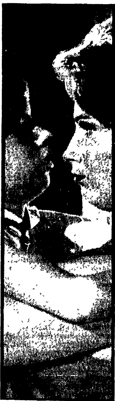
Gunnel Lindblom (a destra) in una scena del «Silenzio» di Ingmar Bergman