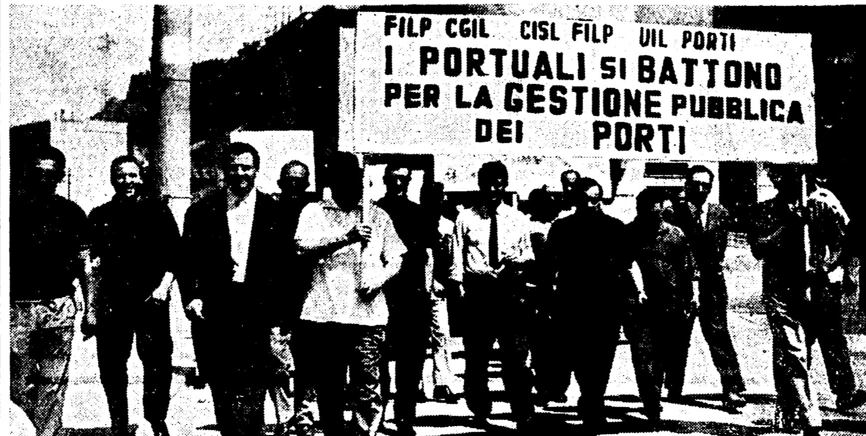
ANCONA — Termina stamane, sabato, lo sciopero dei portuali iniziato mercoledì scorso. I portuali anconetani — che si sono astenuti dal lavoro al 100% — hanno dato una nuova forte dimostrazione della loro decisa volontà di contribuire al successo della lotta intrapresa dalla categoria su piano nazionale contro la privatizzazione dei porti e contro l'attacco padronale alle prerogative delle Compagnie portuali ed al livello salariale. Nella foto: la testa del corteo dei portuali anconetani durante la manifestazione di giovedì scorso al centro della città.

Il documento — presentato sotto forma di ordine del giorno — ha richiesto, proprio per la sua natura di sintesi e accostamento di differenti posizioni politiche, varie sedute del consiglio di amministrazione. L'odg votato ieri sera è stato redatto sulla base di un abbozzo presentato dalla presidenza dell'ISSEM con l'aggiunta di due sostanziali emendamenti proposti dai comunisti e dai compagni del PSIUP. Il primo emendamento riguarda l'individuazione nell'azienda familiare diretto-coltivatrice, integrata e associata, lo sbocco del superamento della mezzadria e la struttura più idonea a garantire lo sviluppo dell'agricoltura.