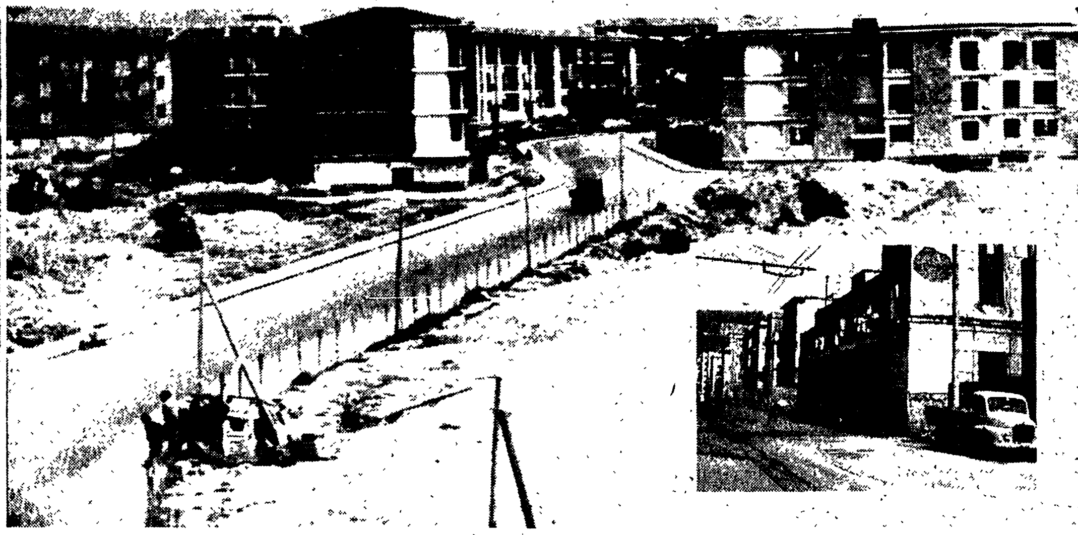
NAPOLI — Le case popolari assegnate al senzatetto, ma mai consegnate perché non ancora completate a seguito del fallimento delle imprese costruttrici. Nella foto piccola il malsano alloggio in cui sono costretti tuttora a vivere e dove è maturata la forte protesta di ieri.

Da un anno e mezzo attendono di andare in queste case