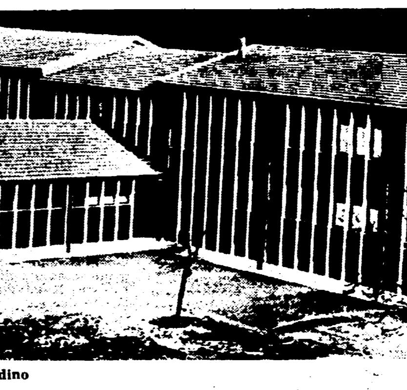
Scuola elementare città-giardino

In primo piano la visita alla scuola delle «Orsoline» — Le realizzazioni degli enti locali e le nuove esigenze della scuola pubblica