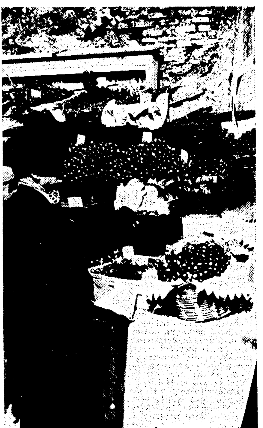
Un banco per la vendita delle ciliege

La via che porta da Bari verso la zona del Sud-Est della provincia man mano che s'inoltra nelle strade campestri per le strade vicinali lungo le quali a tutti è possibile raccogliere ciliege gratuitamente e senza che i contadini protestino. Nella sola campagna di Turi di Bari si può calcolare che sono rimasti agli alberi 10 mila quintali di ciliege che ai contadini non conviene raccogliere. Questa cifra può essere facilmente triplicata se si calcola il prodotto rimasto sugli alberi nelle campagne di tutta la zona interessata al ciliegio.