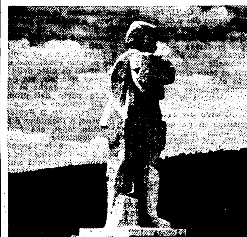
Monumento al Partigiano, opera dello scultore Romeo Mancini, fatto erigere dall'Amministrazione popolare di Magione nel '55 a memoria dei caduti nella battaglia di Montebono l'8 giugno del '44

La verità è ben diversa. A Gonnesa nessun assessore comunista si è mai sognato di boicottare l'attività del sindaco del PSI. La giunta di sinistra ha sempre lavorato nell'interesse degli amministrati. A questo impegno i rappresentanti comunisti non sono venuti meno neanche dopo la scissione socialista, nonostante le difficoltà obiettive che si frappongono e si frappongono allo svolgimento di una sana e democratica gestione della cosa pubblica. Era, quindi, necessario giungere ad un chiarimento e rinviare in moto il meccanismo amministrativo. I comunisti hanno perciò deciso di non porre alcuna remora ad una trattativa tra i tre gruppi che compongono la maggioranza: Risobelli, normalità, nell'ambito di precisi accordi, è assolutamente indispensabile, anche per non pregiudicare l'unità dei partiti operativi.