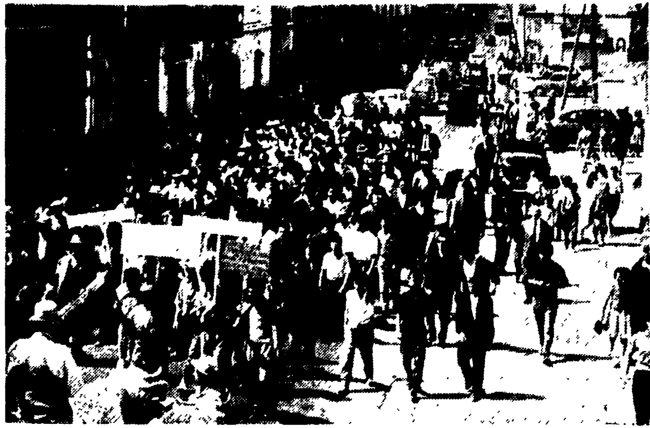
Nelle zone terremotate si vive ancora, a due anni dal sisma, nelle baracche di legno. Le popolazioni reclamano una casa, la GESCAL accetta di ricostruire tutte le chiese, anche quelle non colpite dal sisma.