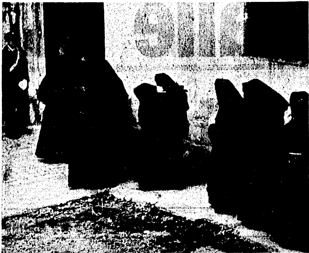
Di primo mattino le suore si recano a gruppi a votare