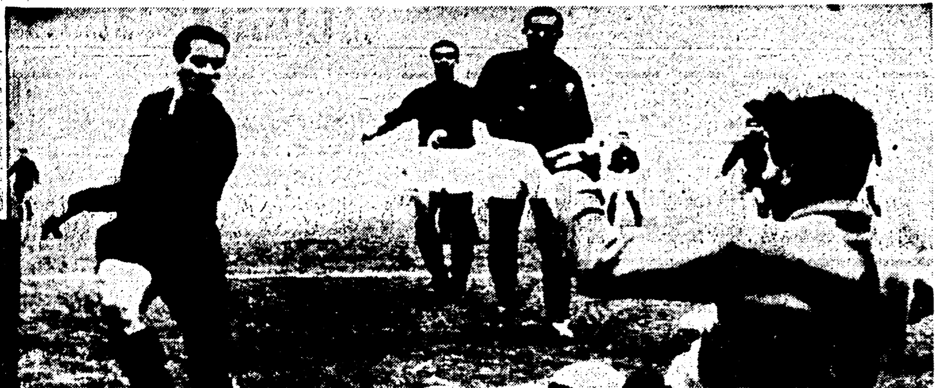
MILAN-FIorentina 2-0 - Fortunato raddoppia per il Milan e la fine per le speranze del viola. (Telef. all'Unità)

Anche la Fiorentina battuta a San Siro (2-0)