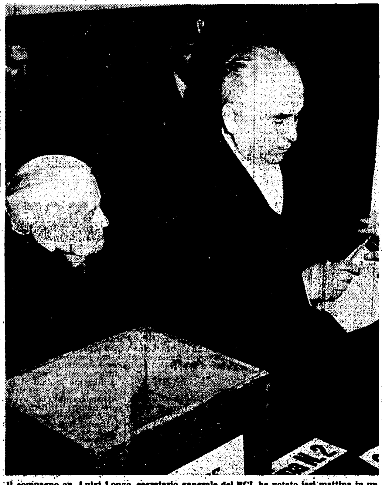
Il compagno on. Luigi Longo, segretario generale del PCI, ha votato ieri mattina in un seggio nei pressi della sua abitazione romana. Il compagno Longo era assieme a sua madre che ha votato nello stesso seggio

Le operazioni di voto in corso in 74 province e 6767 comuni - Centinaia di migliaia di emigrati non sono tornati a votare per il limitato sconto ferroviario e gli ostacoli frapposti dai padroni - Elevata percentuale di votanti - Gli scrutini cominceranno dopo le ore 14 In nottata i risultati