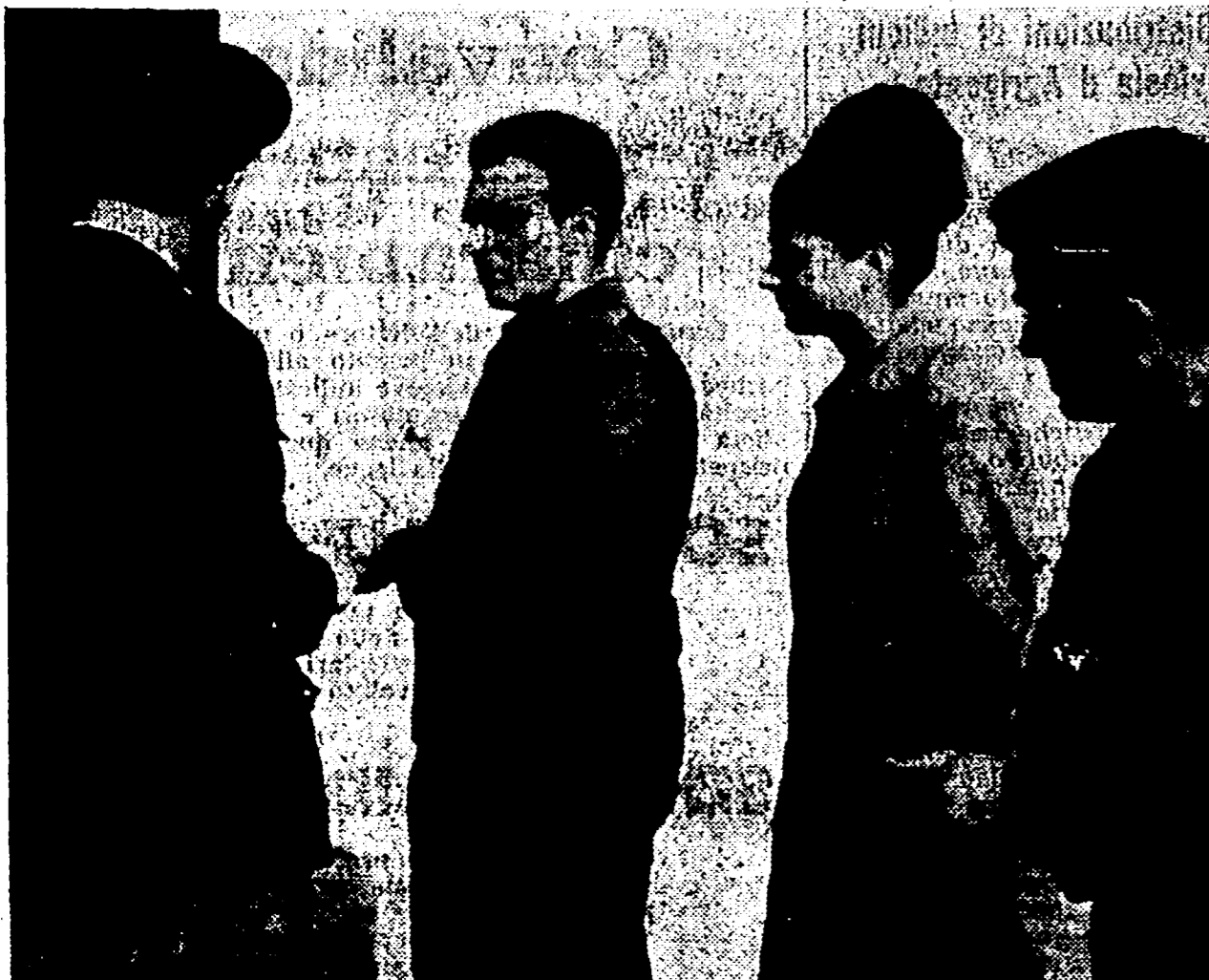
I lavoratori della Milatex hanno votato tutti nella giornata di ieri dandosi il cambio nell'occupazione della fabbrica. Alcuni che abitano nella zona hanno dovuto fare soltanto poche decine di metri ed altri sono recati nella vicina sezione elettorale indossando ancora la tuta di lavoro. Gli operai sono stati salutati con simpatia da numerosi cittadini. L'occupazione del lanificio intanto prosegue: la notizia che il prefere ha firmato l'ordine di sgombero non ha minimamente scalfito la combattività dei lavoratori. Nella foto: un gruppo di operai della Milatex sta per entrare in una sezione elettorale sulla via Casilina