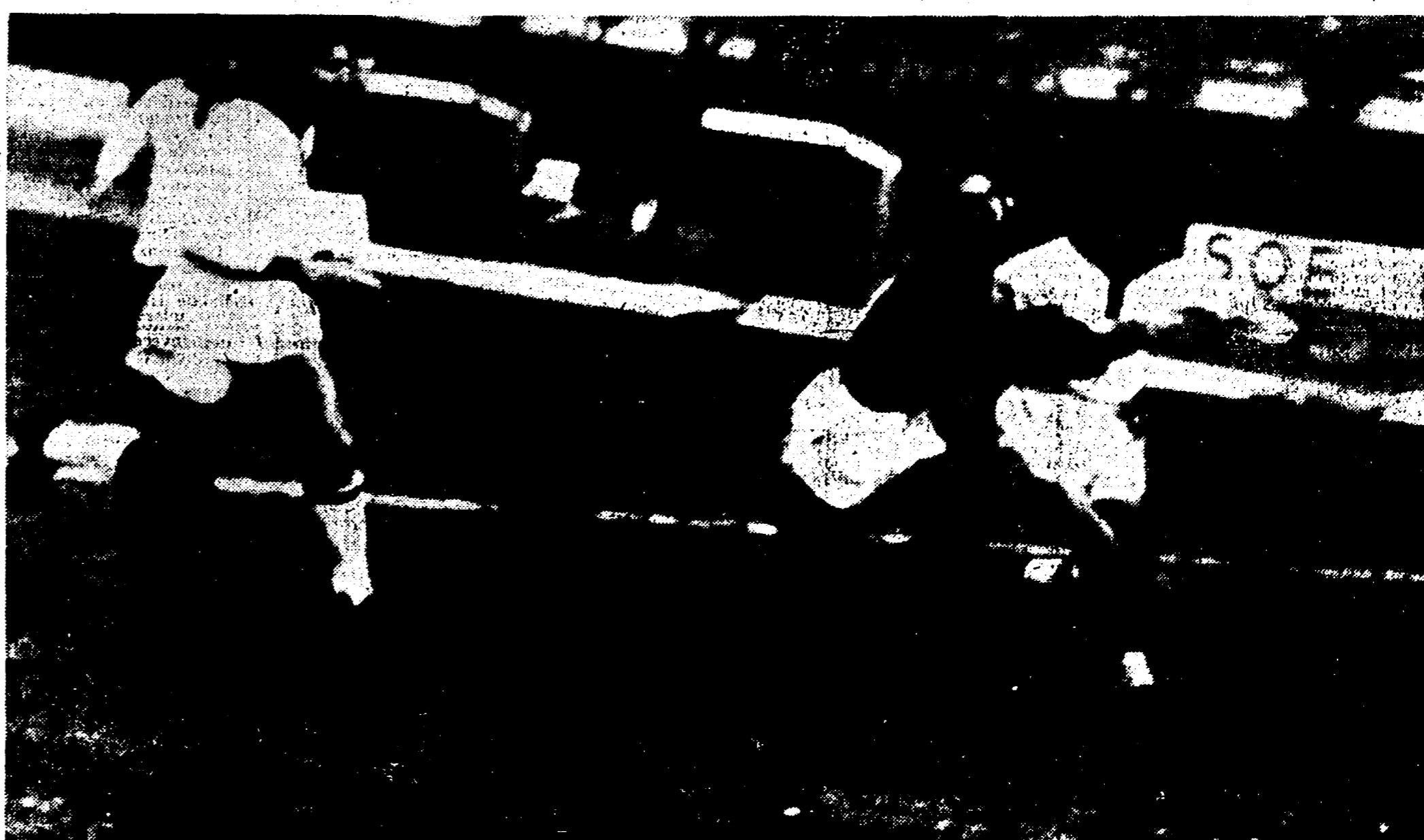
MANTOVA-ROMA 0-0 - LEONARDI atterrato in area biancorossa