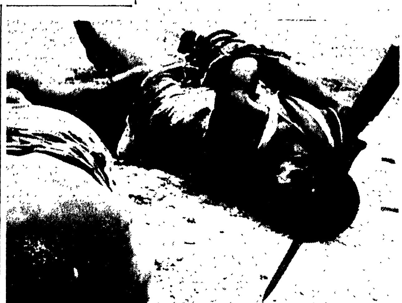
LEOPOLDVILLE — Un'altro immagine delle torture inflitte a due partigiani congolese catturati dai ciombisti. La telefoto A.P.-Unità è stata scattata a Kindu