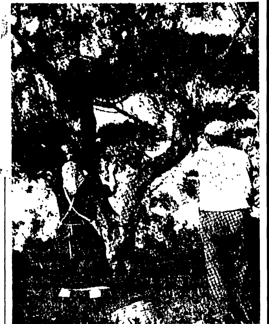
Raccolta delle olive nelle campagne di Bitonto

Nella foto: veduta di Apricena dal promontorio del Gargano.