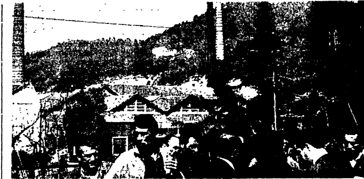
LA SPEZIA — Operai davanti alla Ceramica di Ponzano Magra

LA SPEZIA, 1. In questi giorni la direzione della società Filippi di Castelnuovo Magra ha licenziato lavoratori e quindi in fase di licenziamento sono stati sospesi nel gennaio scorso. Unilateralmente la società ha disdetto i patti aziendali pubblici e super minimi e gli incentivi provocando un forte taglio dei salari.