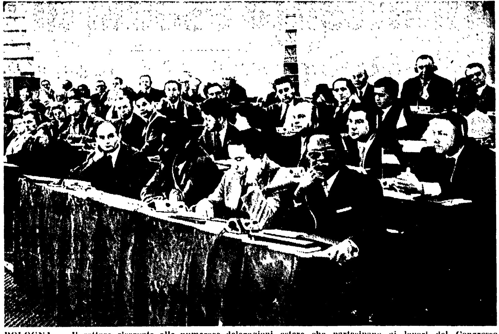
BOLOGNA — Il settore riservato alle numerose delegazioni estere che partecipano ai lavori del Congresso