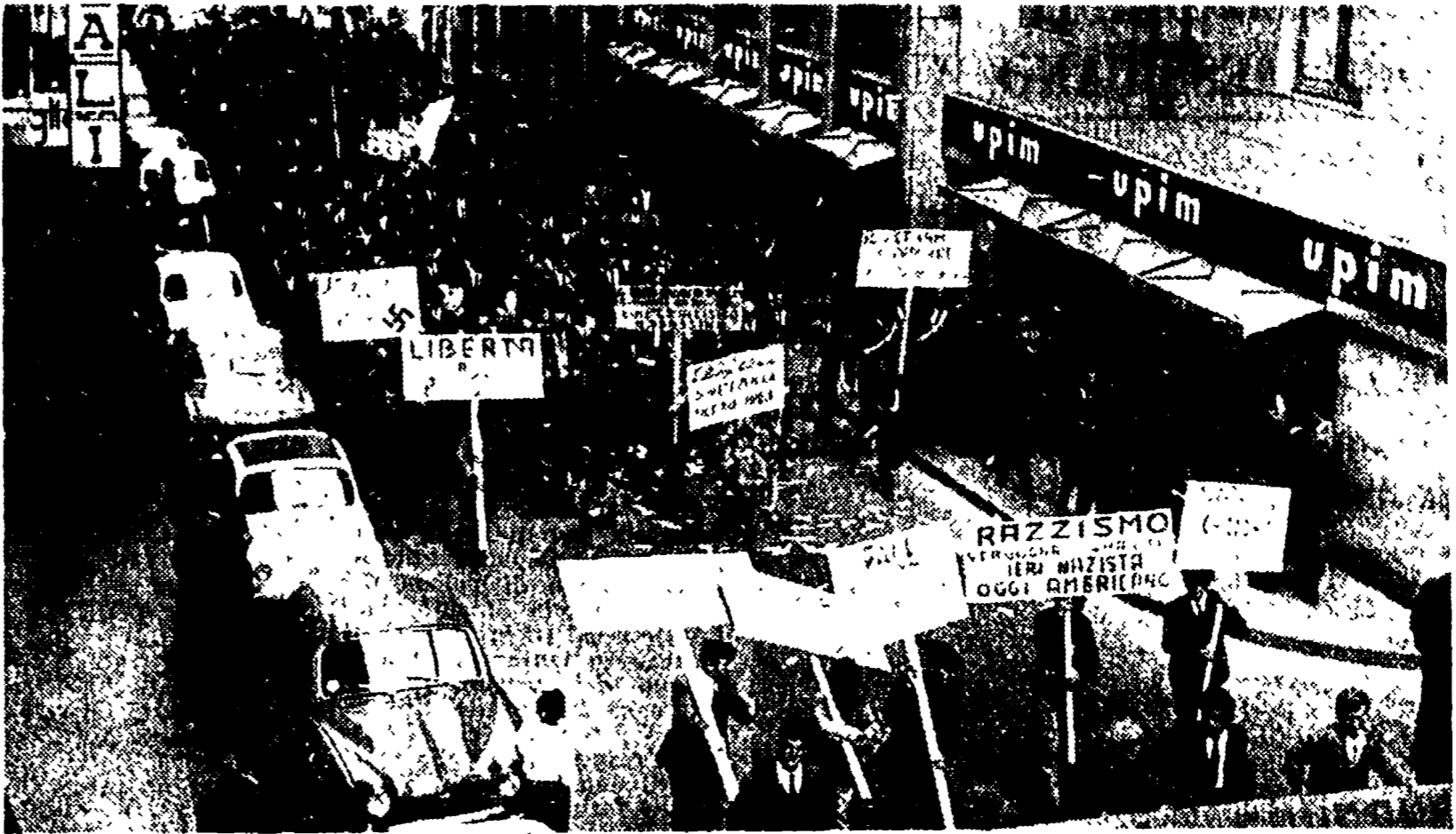
SIRACUSA — Un aspetto della manifestazione per la pace nel Vietnam

Respiro dalla sinistra cattolica il tentativo del capo gruppo dc di porre sullo stesso piano i crimini USA e la eroica lotta dei partigiani del Viet - Voto unitario anche a Siracusa - Manifestazioni a Salerno, Cecina, Foggia