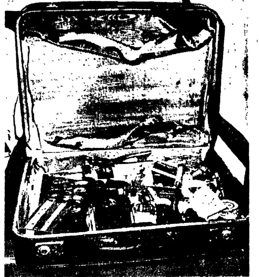
Dur - Cazandenhore, uno dei «pesci piccoli» in mano alla polizia e (in basso) parte del materiale usato dai falsari

Una delle più agguerrite bande di falsari che abbiano mai operato nel nostro paese è riuscita a sfuggire alla polizia romana, che — per la fretta di concludere quella che sembrava una «brillante operazione» si è trovata con in mano solo documenti, attrezzature e una lista di nomi, molti dei quali chiaramente falsi.