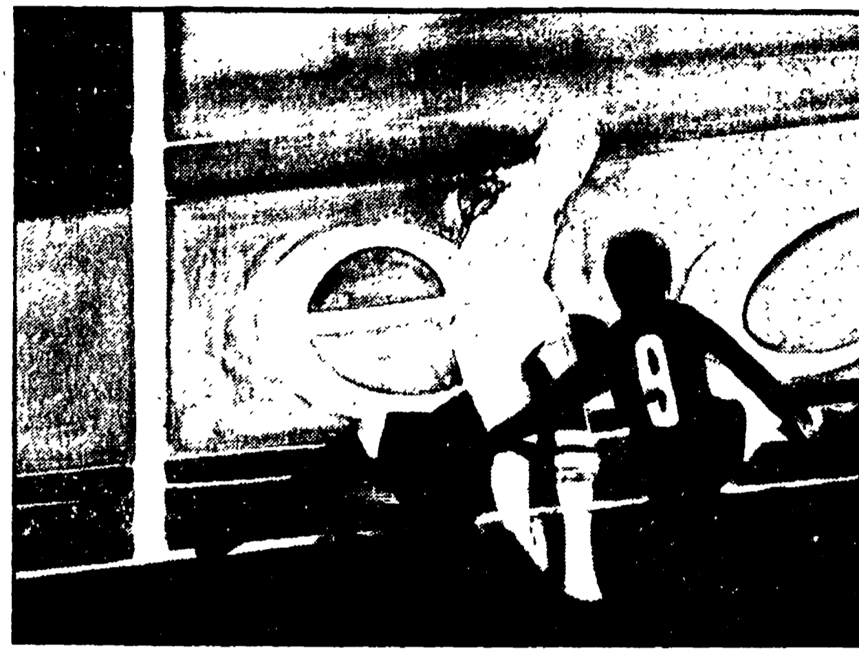
Dino Boschi: «Numeri e lettere» (1965)