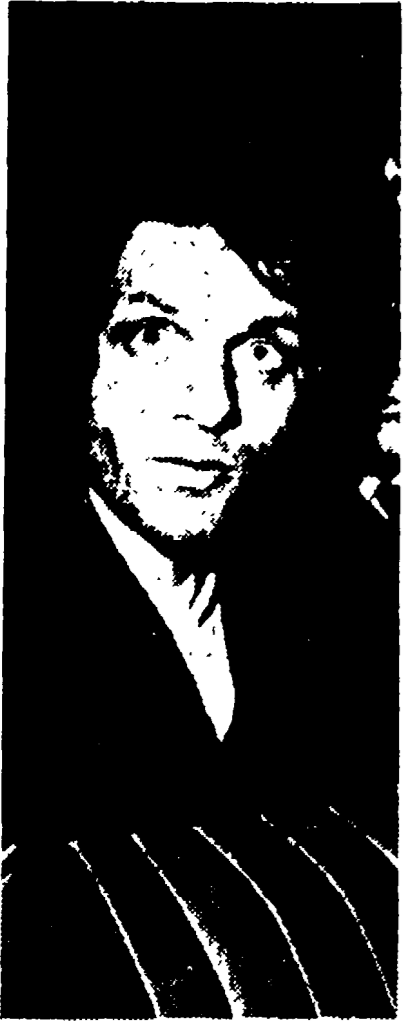
Un'allucinante espressione del giovane assassino che tre giorni ha vagato senza meta fino al momento dell'arresto.