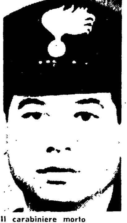
Il carabiniere morto

Una pattuglia, informata delle mosse dei due fuorilegge, aveva organizzato un appostamento