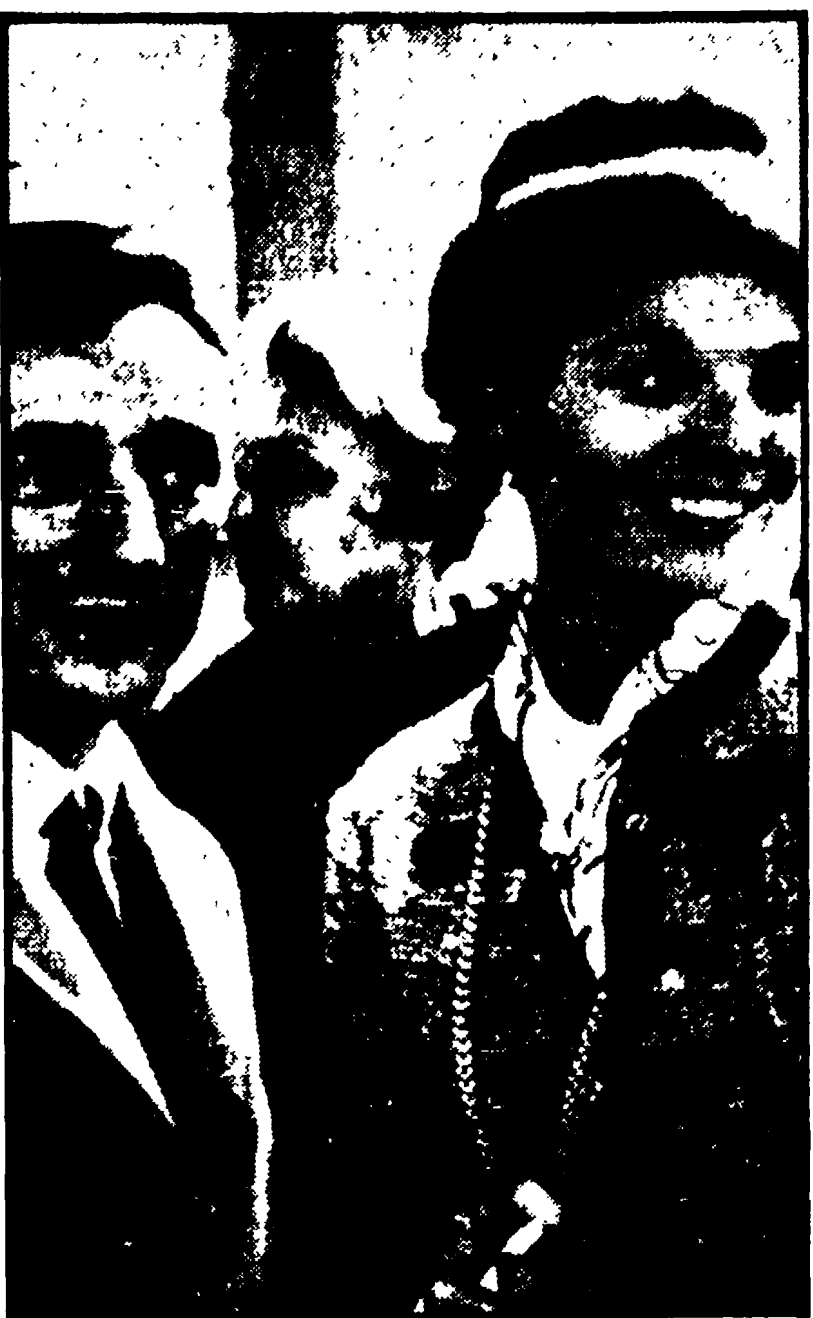
MOSCA, 27. Gli astronauti sovietici Valentina Tereshkova e Adrian Nikolav sono stati ospiti di una eccezionale serata di gala in onore di Gilbert Bécaud...