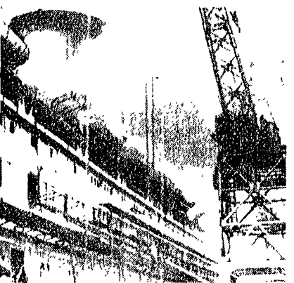
GENOVA — Sette operai sono morti arsi vivi, nel rogo di una nave in allineamento nel porto di Genova. L'incendio è stato provocato dallo scoppio di una bomba di propano liquido col quale gli operai procedevano, senza alcuna misura di sicurezza, alle saldature nelle celle frigorifere. La nave è di proprietà della flotta Laura. NELLA TELEFOTO: la nave con l'incendio a bordo.