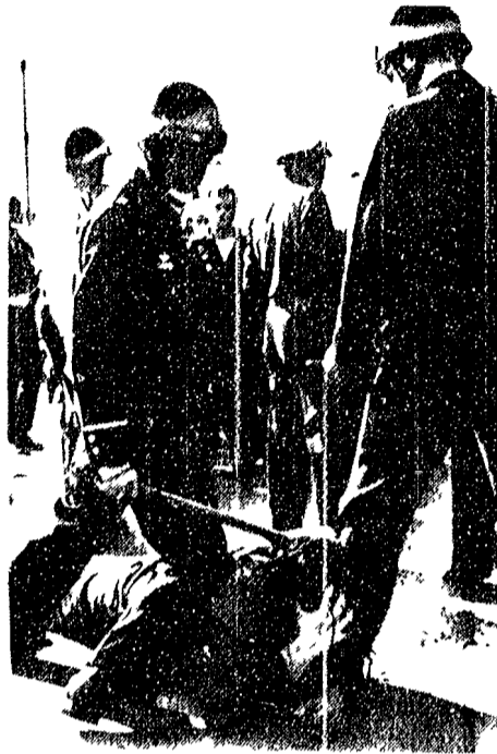
Le manifestazioni contro l'intervento americano nel Vietnam...

Tre aerei perduti in una giornata - Sarebbe stata distrutta una postazione missilistica a 80 km da Hanoi - Nuova vasta operazione statunitense conclusa con un fallimento nel Sud Vietnam