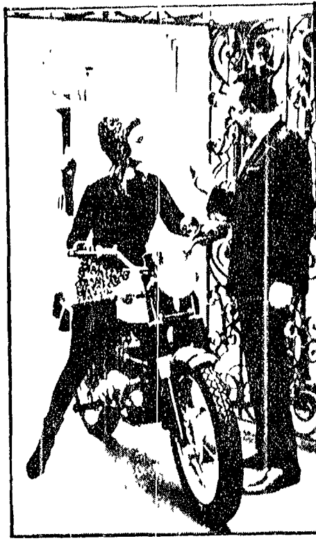
HOLLYWOOD. La giovane attrice americana Ann Margret si recò al lavoro in motocicletta, e indossando una tenuta sportiva. Il caos del traffico stradale consiglia, evidentemente, di preferire le due ruote alle quattro.