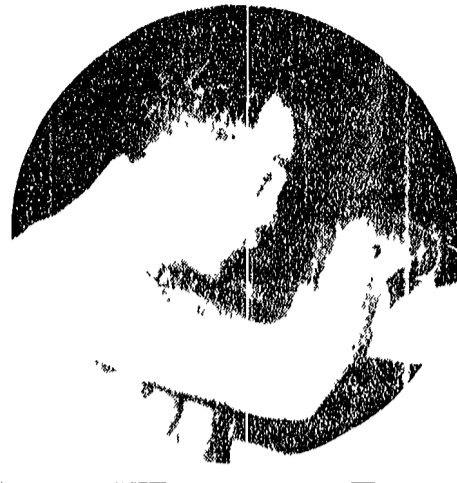
Portieri alla ribalta