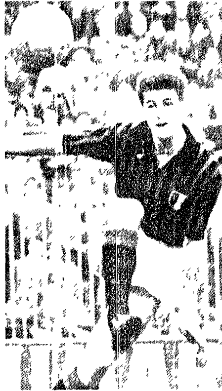
RIVERA è stato il regista della squadra, e le azioni più pericolose sono partite dal suo piede