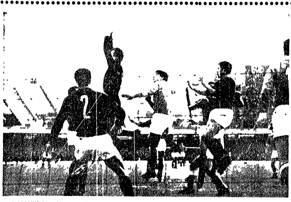
NAPOLI TORINO 0-0 - Vieri para allo si un tiro insidioso di Juliano

Molti mi domandano perché... (text explains the author's motivation to write about Benvenuti)