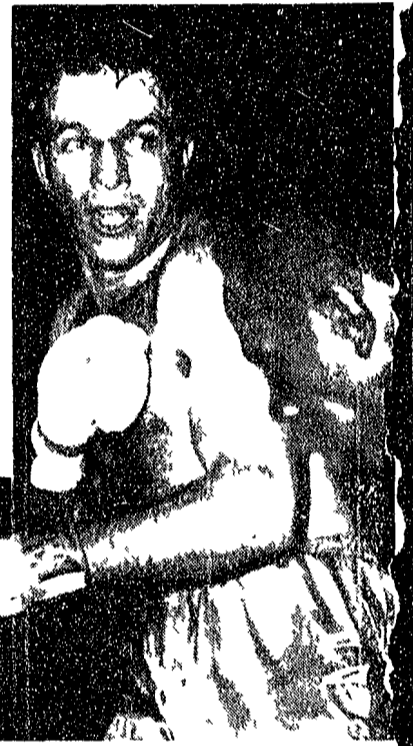
L'ex campione del mondo di pugili SANDRO MAZZINGHI