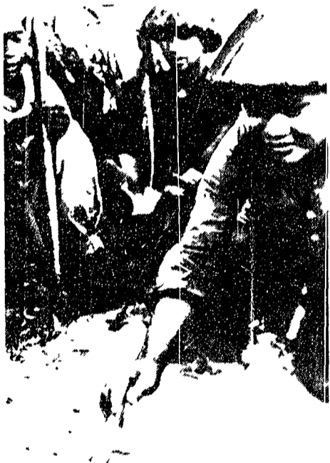
Da una zona libera del Vietnam meridionale l'agenzia Nuova Cina ha diffuso la presente telefoto. Essa mostra partigiani sud vietnamiti mentre discutono un'azione da condurre contro le forze imperialiste.