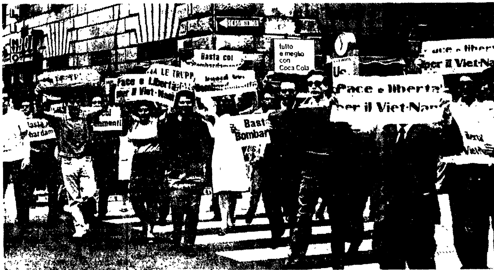
Gruppi di cittadini hanno manifestato anche ieri davanti all'ambasciata USA.

Questo il percorso: piazza Esedra, via Cavour, via dei Fori Imperiali, piazza Venezia, piazza SS. Apostoli — Concentramento alle ore 18,30 — Dopo la manifestazione due delegazioni si reheranno a Palazzo Chigi e all'ambasciata USA