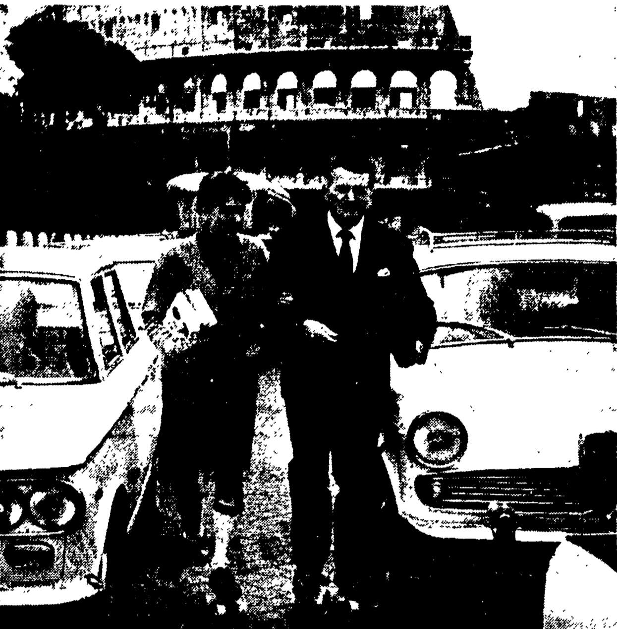
L'ultimo palliativo per il traffico. Non è di lusso come l'onda verde ed è certamente più efficace. Padre e figlio (lui deve andare in ufficio, lei a scuola) hanno rinunciato all'auto e si sono affidati a due...