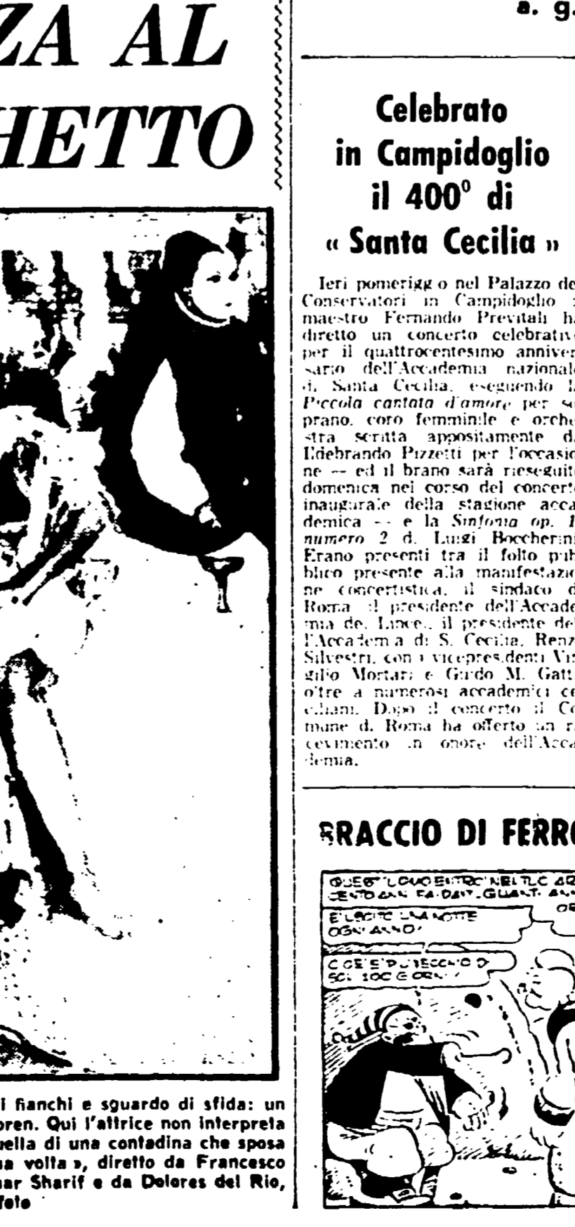
Gamba scoperta alzata, mani sui fianchi e sguardo di sfida: un tipico atteggiamento di Sophia Loren...