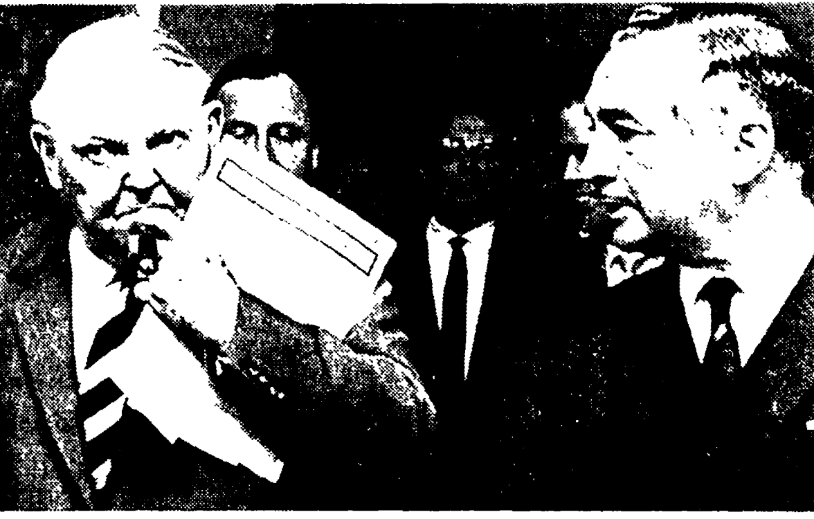
Bonn - Erhard (a sinistra) e il vice cancelliere Mende al termine della riunione di governo

Il pareggio del bilancio — ma sostanzialmente i rapporti con gli USA — al fondo del contrasto che ha determinato la crisi - Dichiarazioni di Wehner e Brandt