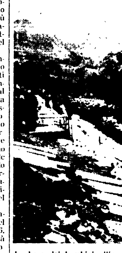
Le bare dei bambini allineate nel cimitero di Aberfan

Era stata fermata nel corso delle indagini per l'uccisione del sindacalista Battaglia