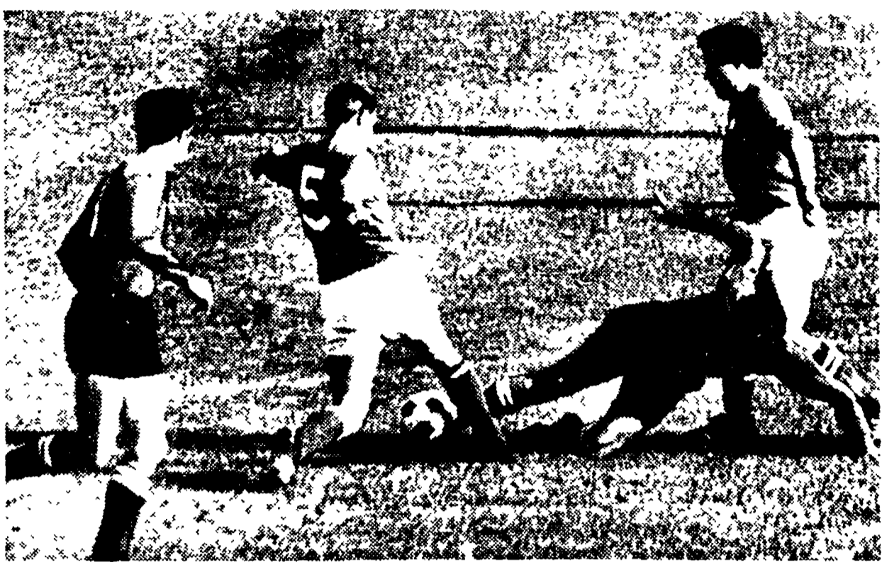
(Telefoto) ITALIA-URSS 1-0 — Un attacco dell'Italia: si distingue DOMENGHINI (a terra)