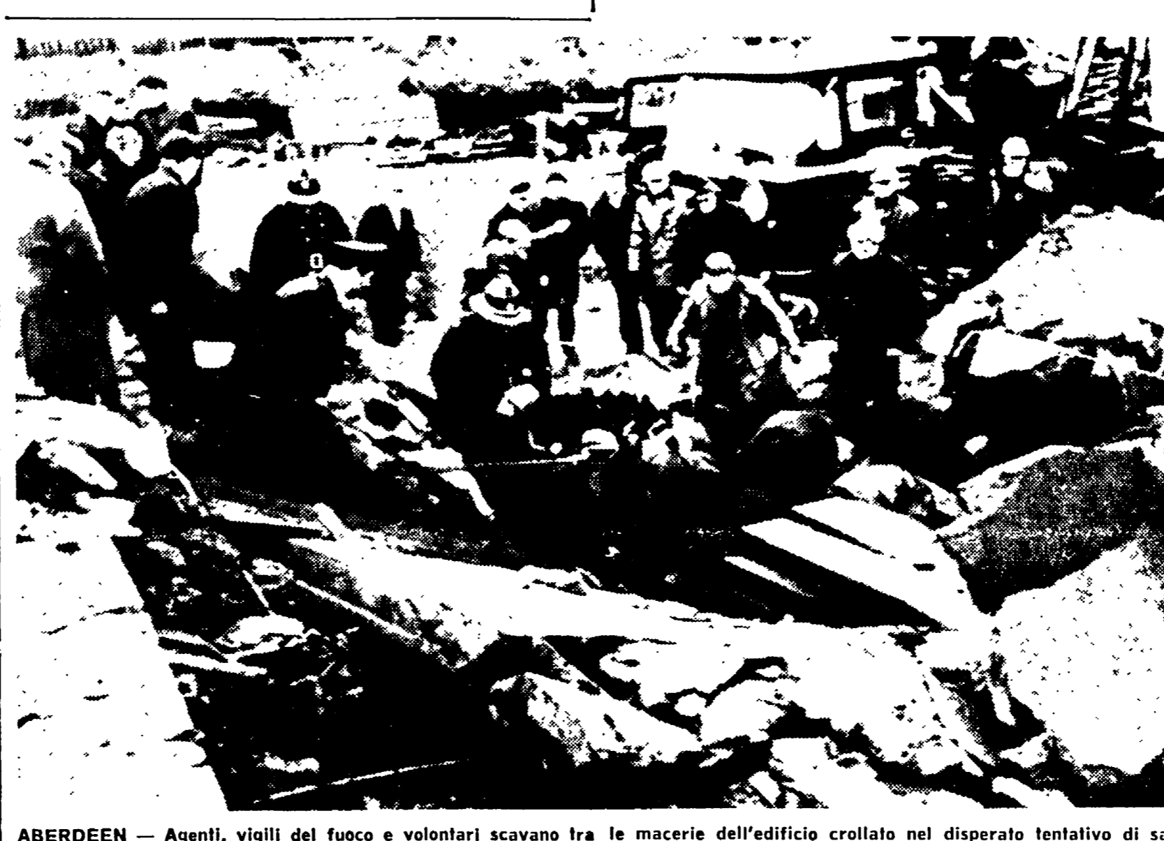
ABERDEEN — Agenti, vigili del fuoco e volontari scavano tra le macerie dell'edificio crollato nel disperato tentativo di salvare i dodici lavoratori sorpresi dal crollo.