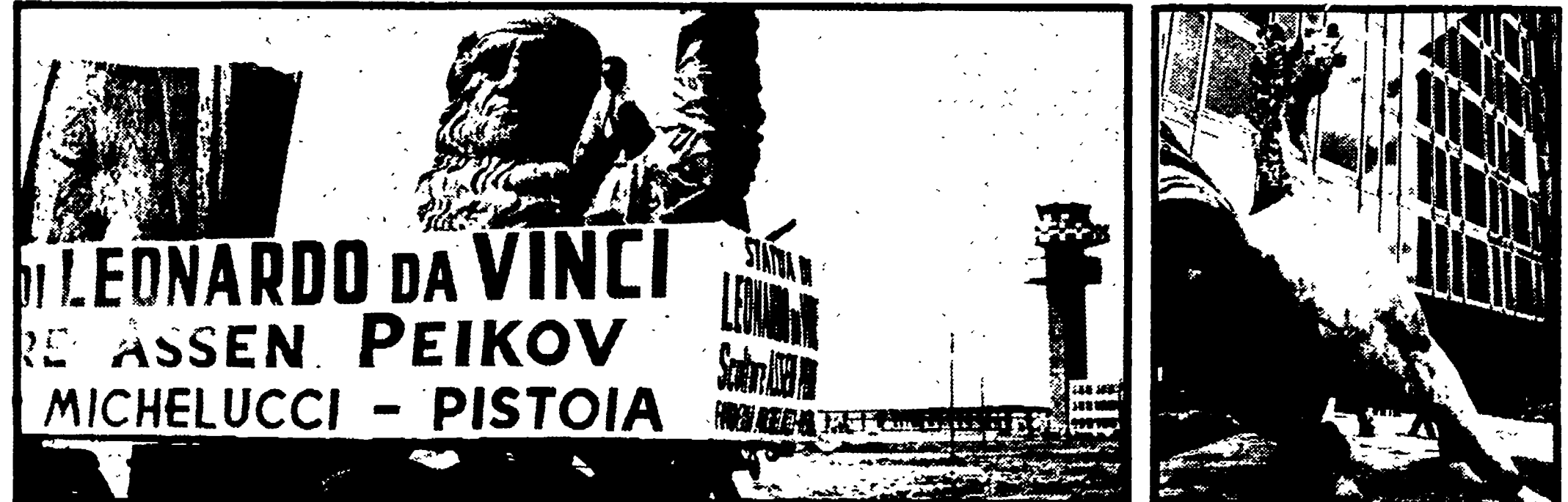
Due esempi gravissimi di sperpero del pubblico danaro per «adornare» pubblici edifici con colossali monumenti bronzi privi di qualsiasi funzionalità e pregio artistico. A sinistra: il pubblicitario arrivo a Fiumicino dei pezzi della statua di Leonardo da Vinci che ingombrano oggi il piazzale dell'omonimo aeroporto. A destra: un particolare del «Cavallo» di viale fattura che si erge (o precipita?) davanti alla nuova sede della Rai-Tv a Roma. Nel primo caso furono evase le stesse fragili cautele della vecchia legge del '22, con una decisione personale del ministro Togni; ignoriamo a chi spetta la responsabilità della seconda decisione

In Italia vecchie leggi e vecchie istituzioni fanno spendere miliardi di pubblico danaro senza risolvere alcuno dei grandi problemi della conservazione del patrimonio artistico antico, dello sviluppo di quello moderno e della fondazione di una cultura artistica di massa