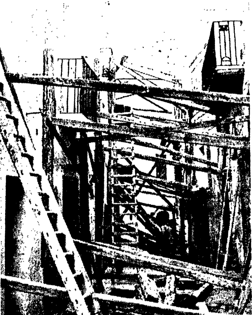
BARI. 1. Ecco come è stata ridotta la sequenza di alcuni lavori fatti dall'Ente Autonomo Acquedotto pugliese...