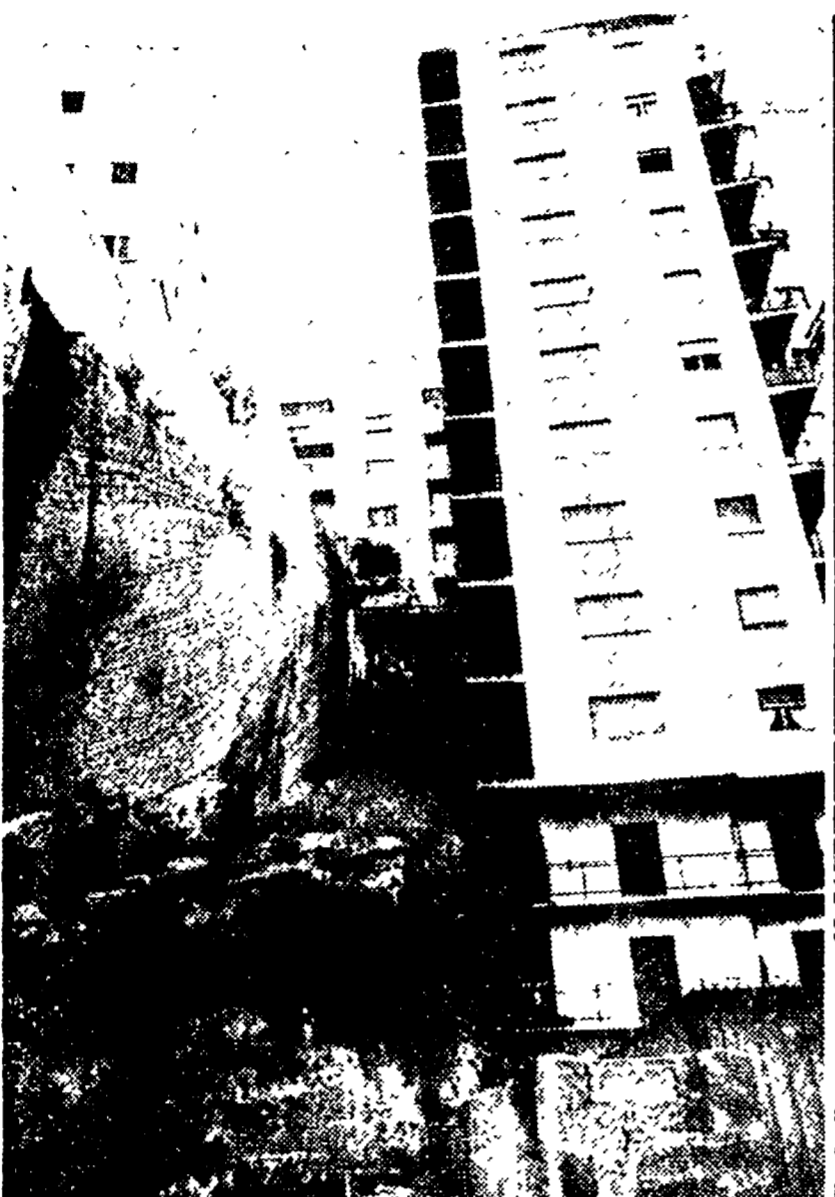
Il disordine edilizio di Agrigento: la didascalia è tratta dal testo a stampa della relazione Martuscelli e la foto non ha bisogno di ulteriori commenti.