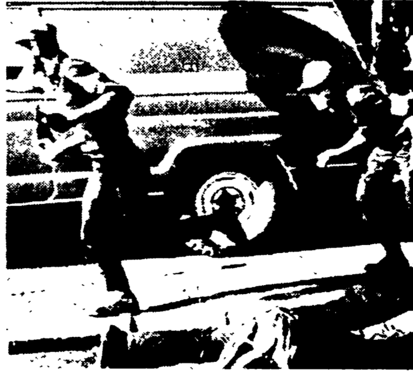
SAIGON — Soldati collaborazionisti fuggono sotto le bombe tirate dai partigiani, mentre altri si sono gettati a terra per evitare le schegge.

L'attacco si è svolto in due tempi - 24 proiettili da 75 mm. esplosi presso la tribuna delle autorità Sette morti, 40 feriti - Un dragamine USA affondato con una mina elettrica