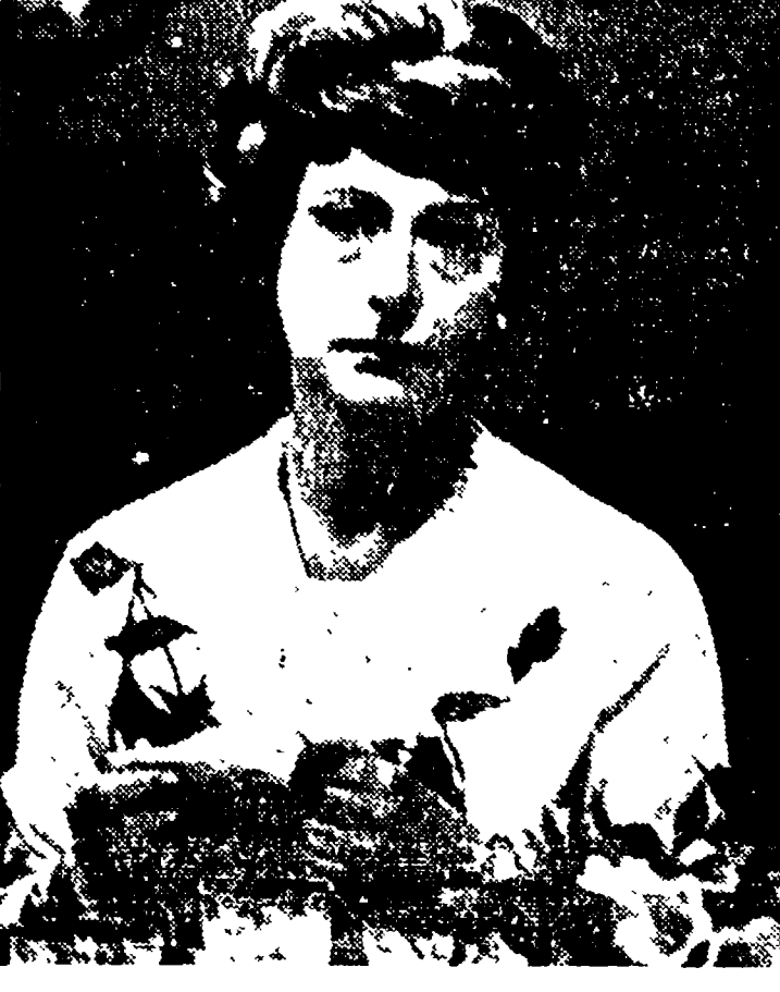
Scritto da Max Aub (combattente nella guerra civile spagnola, poi esule in Francia ed ora nel Messico) nel 1948, « Il ritorno » è un atto unico centrato sul dramma di una donna condannata per motivi politici dal governo franchista a trent'anni di carcere...

La delusione del ritorno (Radio 3° ore 22,30)