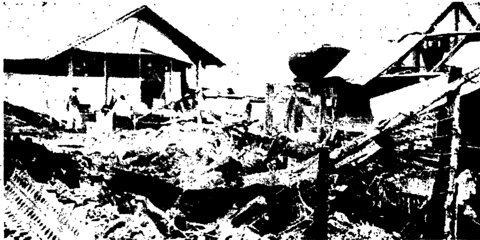
Mentre in tutto il sud Vietnam infuriavano violenti e sanguinosi combattimenti ieri gli aggressori USA hanno nuovamente colpito il centro abitato di Hanoi. Nella telefoto: ecco come è stato ridotto il campo delle «forze speciali» americane e collaborazioniste conquistato l'altro ieri dai reparti del FNL dopo furiosi combattimenti, durante i quali non meno di due soldati USA e 20 soldati del governo fantoccio sono rimasti uccisi. I combattenti del FNL hanno occupato il campo per due ore, si sono impadroniti di ingenti quantità di munizioni, vetovoglie ed equipaggiamenti e quindi hanno distrutto le installazioni con cariche esplosive.

Monito ai generali # Atene: Cipro può contare sull'aiuto sovietico