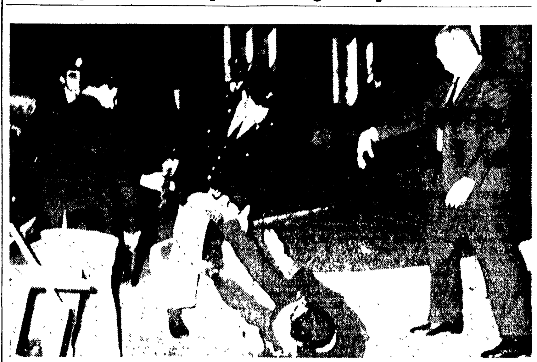
Via Veneto, 12 aprile 1967: una delle scene della brutale violenza poliziesca durante la pacifica manifestazione per il Vietnam