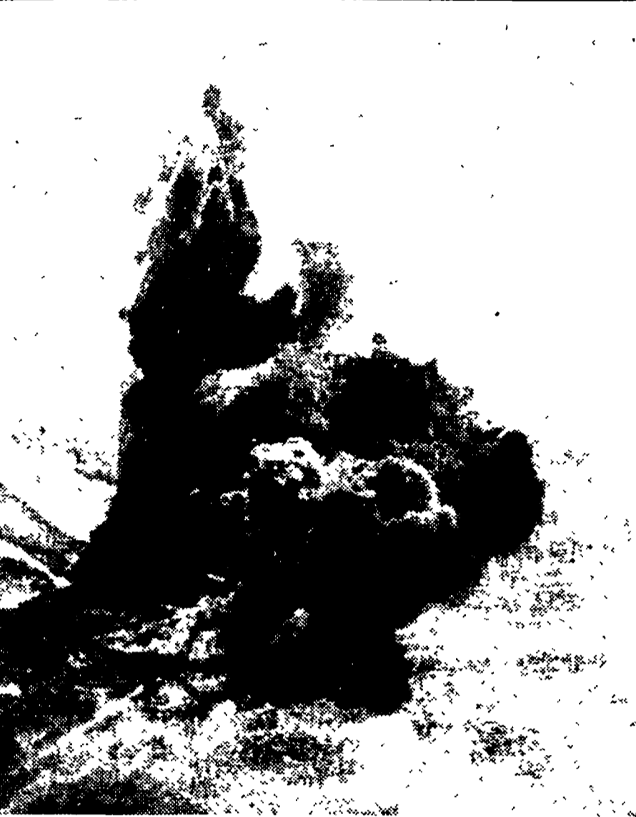
Questa foto è un drammatico documento dei bombardamenti americani sul Vietnam del Nord. Fumo e fiamme si levano dalla centrale elettrica di Hon Gai, attaccata da aerei decollati dalla portaerei « Kitty Hawk ».

Il nuovo attacco contro la capitale — che i portavoce americani hanno indirettamente confermato parlando di bombardamenti da un aereo aereo — è avvenuto meno di 24 ore dopo che il governo vietnamita aveva avvertito le ambasciate ad Hanoi di predisporre nuove misure di sicurezza.