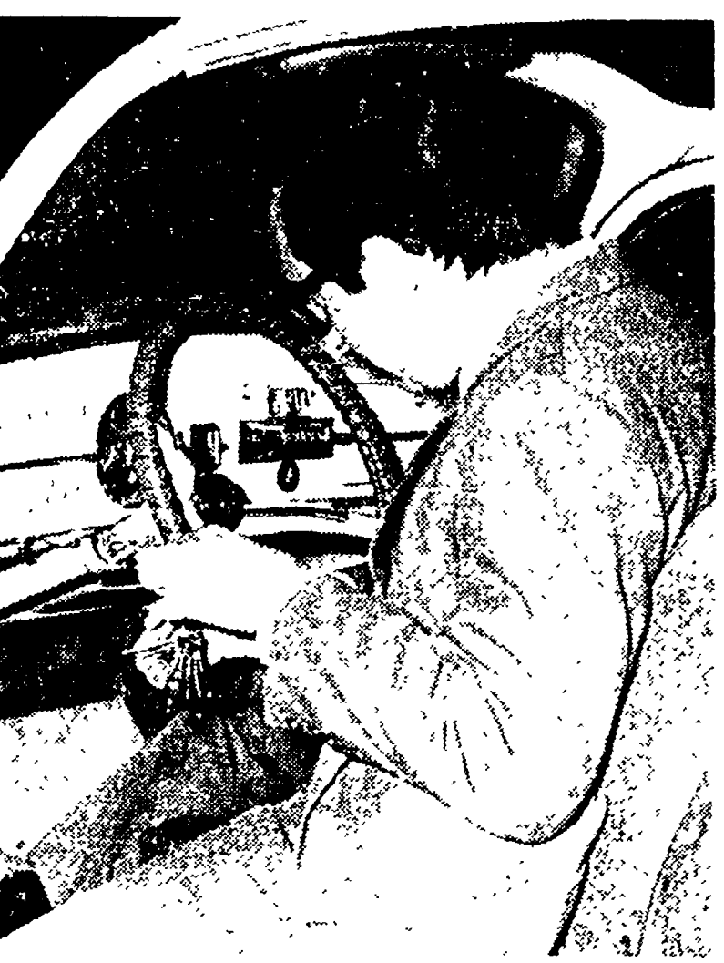
Torreggiani lascia la questura