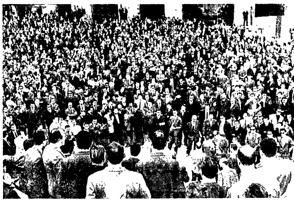
E' iniziata ieri la lotta contrattuale dei 110 mila bancari, che a Roma hanno dato vita a una grossa manifestazione al Colosseo. Nella foto: un aspetto parziale del comizio tenuto dai sindacati

Un motivo di fondo della lotta aperta ieri