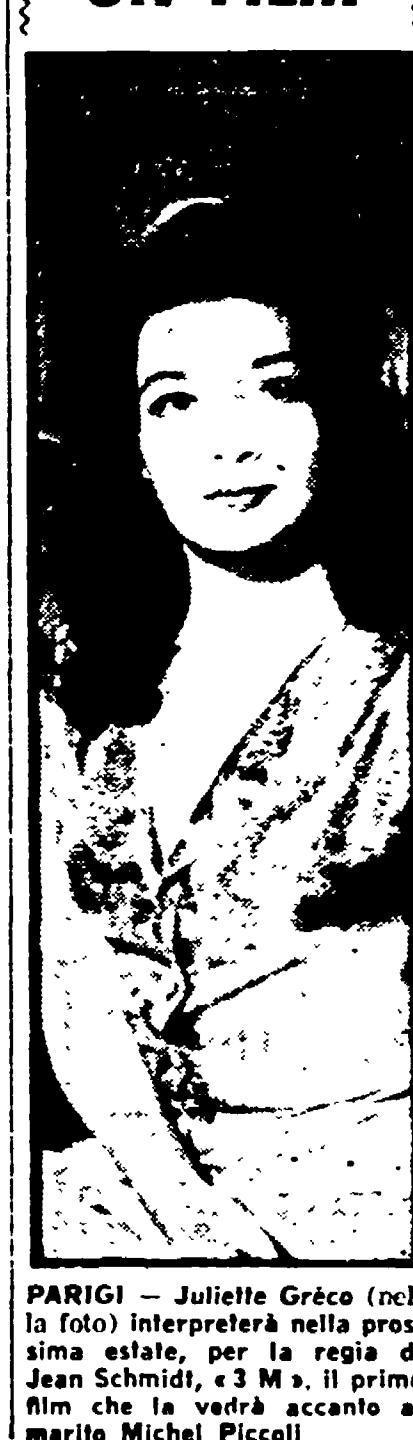
PARIGI — Juliette Gréco (nella foto) interpreterà nella prossima estate, per la regia di Jean Schmidt, « 3 M », il primo film che la vedrà accanto al marito Michel Piccoli