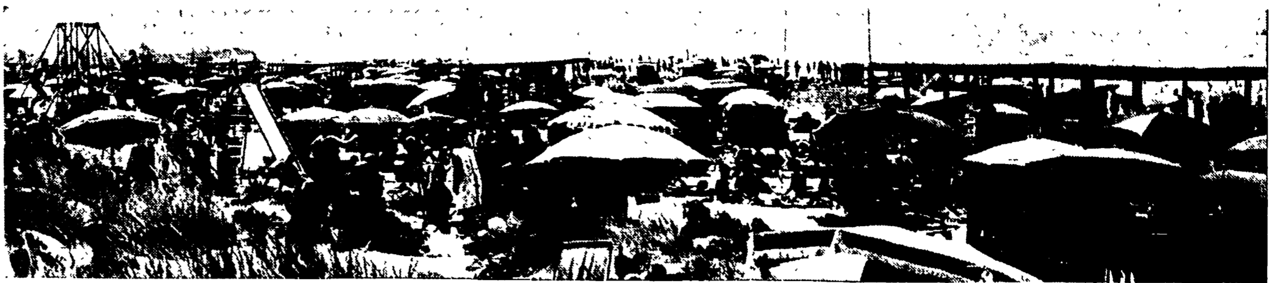
Così alle 12 di ieri la spiaggia libera di Castelporziano: dappertutto sono disseminati gli ombrelloni e le tende delle migliaia di bagnanti che hanno invaso l'arenile