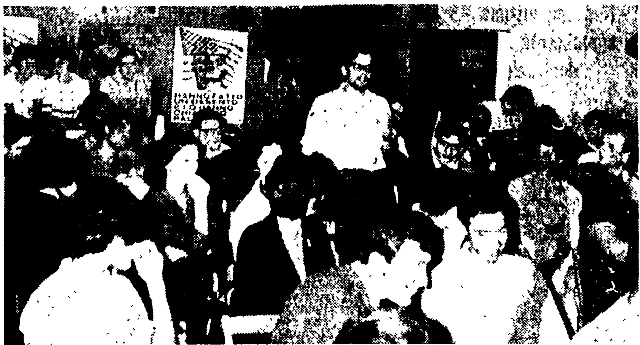
CAGLIARI — Una folla di giovani ha partecipato al dibattito sul Vietnam che si è svolto nella sede del LUAC