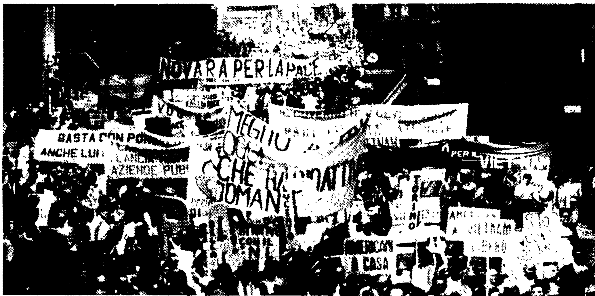
MILANO - Un momento del grandioso corteo mentre percorre corso Venezia