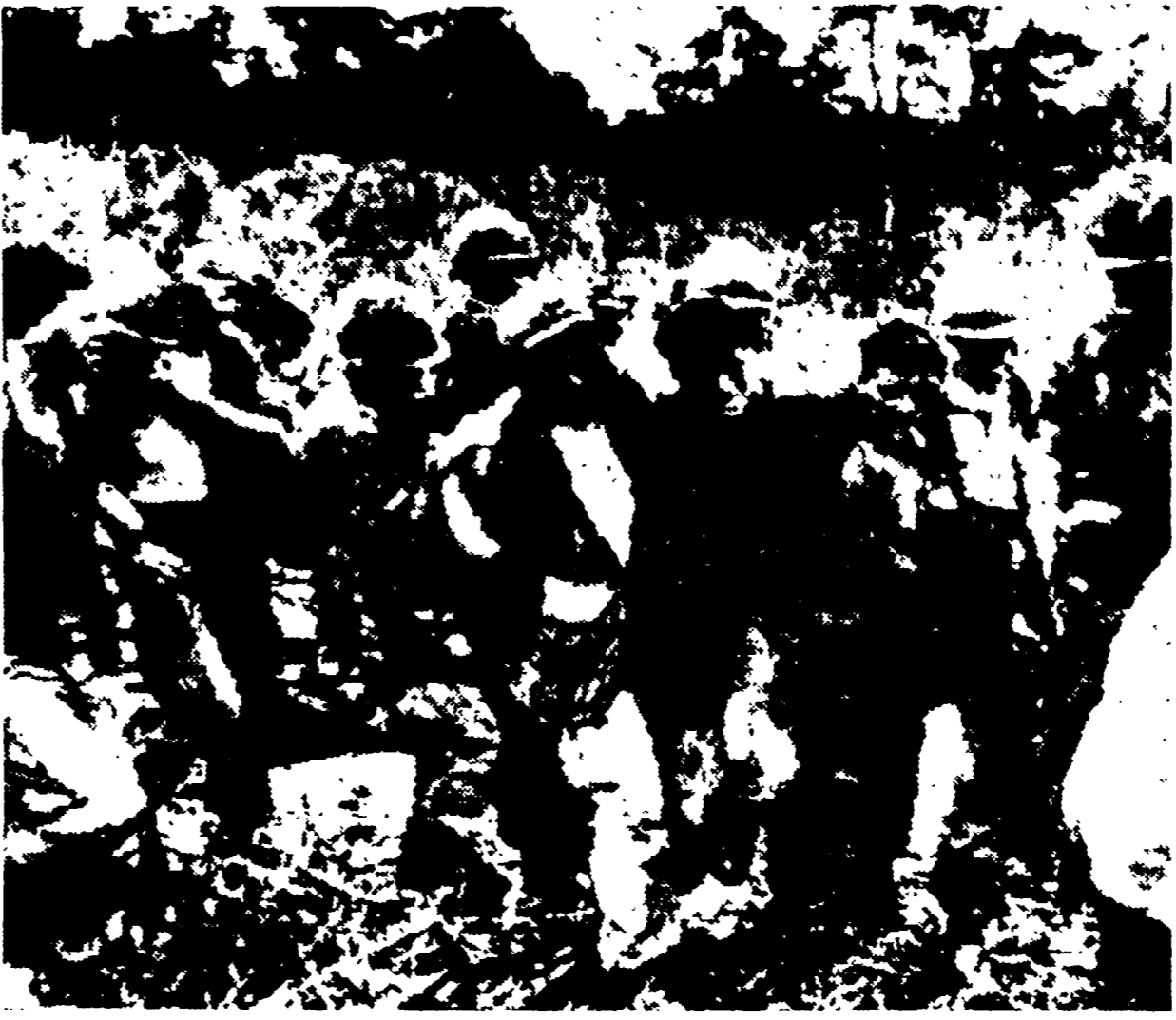
Marines della 4. divisione feriti vengono aiutati a salire sopra un elicottero

Un significativo dispaccio dell'AP ammette la collaborazione delle popolazioni con i partigiani - Colpi di mortaio contro una base collaborazionista nel delta - Il Pentagono smentisce le notizie diffuse da Saigon - Cao Ki parteciperà alla prima incursione dei nuovi aerei F 5 contro il Nord - Pe-ste in America tra i civili rientrati dal Vietnam