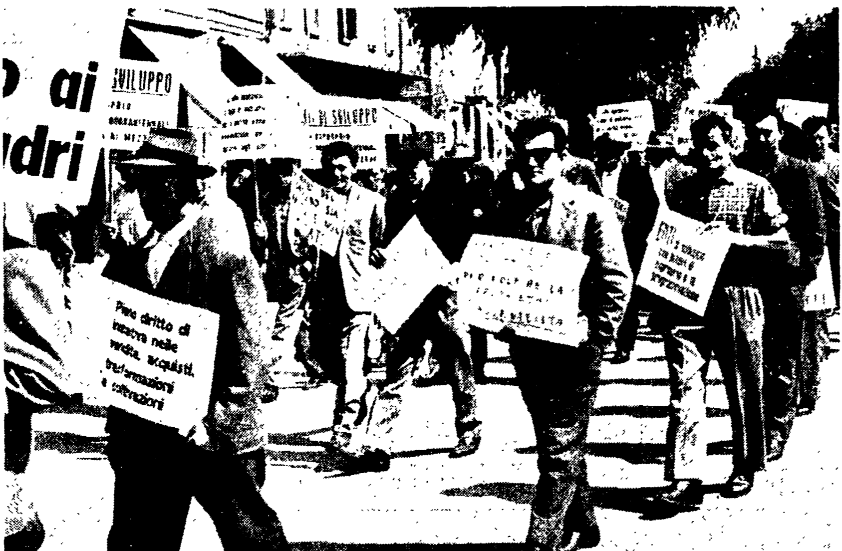
BOLOGNA — Braccianti e mezzadri manifestano a Vignola per la parità previdenziale con le categorie industriali, chiedendo la pronta discussione in Parlamento delle proposte di legge per la riforma della previdenza e la mezzadria

Intanto la lotta dei lavoratori della categoria per ottenere la riforma delle previdenze entro l'attuale legislatura si sta estendendo in tutto il paese. Nel corso dello sciopero un tario attuato da 15 mila braccianti in provincia di Agrigento, delegazioni di lavoratori di dirigenti sindacali delle tre organizzazioni si sono recate in prefettura e nel capoluogo della regione, presso l'ESA e l'Assessorato dell'Agricoltura, per richiedere una rapida soluzione sia dei problemi previdenziali che di quelli riguardanti i piani di sviluppo e, quindi, dell'occupazione. Sempre per la riforma della previdenza agricola hanno scioperato i braccianti a Bologna, Modena e Parma; nel corso della settimana scioperarono le altre provincie emiliane. Il 2 ottobre avrà luogo una giornata di lotta in Lombardia con manifestazioni e scioperi locali; il 23 ottobre scenderanno in sciopero per 48 ore i lavoratori della provincia di Potenza con al centro i problemi del rinnovo del contratto e della previdenza. Lo sciopero è unitario e sono previste 10 manifestazioni comunali. Il 4 ottobre sarà la volta della Campania, dove la categoria effettuerà uno sciopero di 24 ore, e della Puglia che attuerà una giornata di lotta e manifestazioni per la previdenza ed i contratti collettivi. Il 5 ottobre entrerà in lotta la Toscana iniziando una serie di iniziative a livello comunale e provinciale.