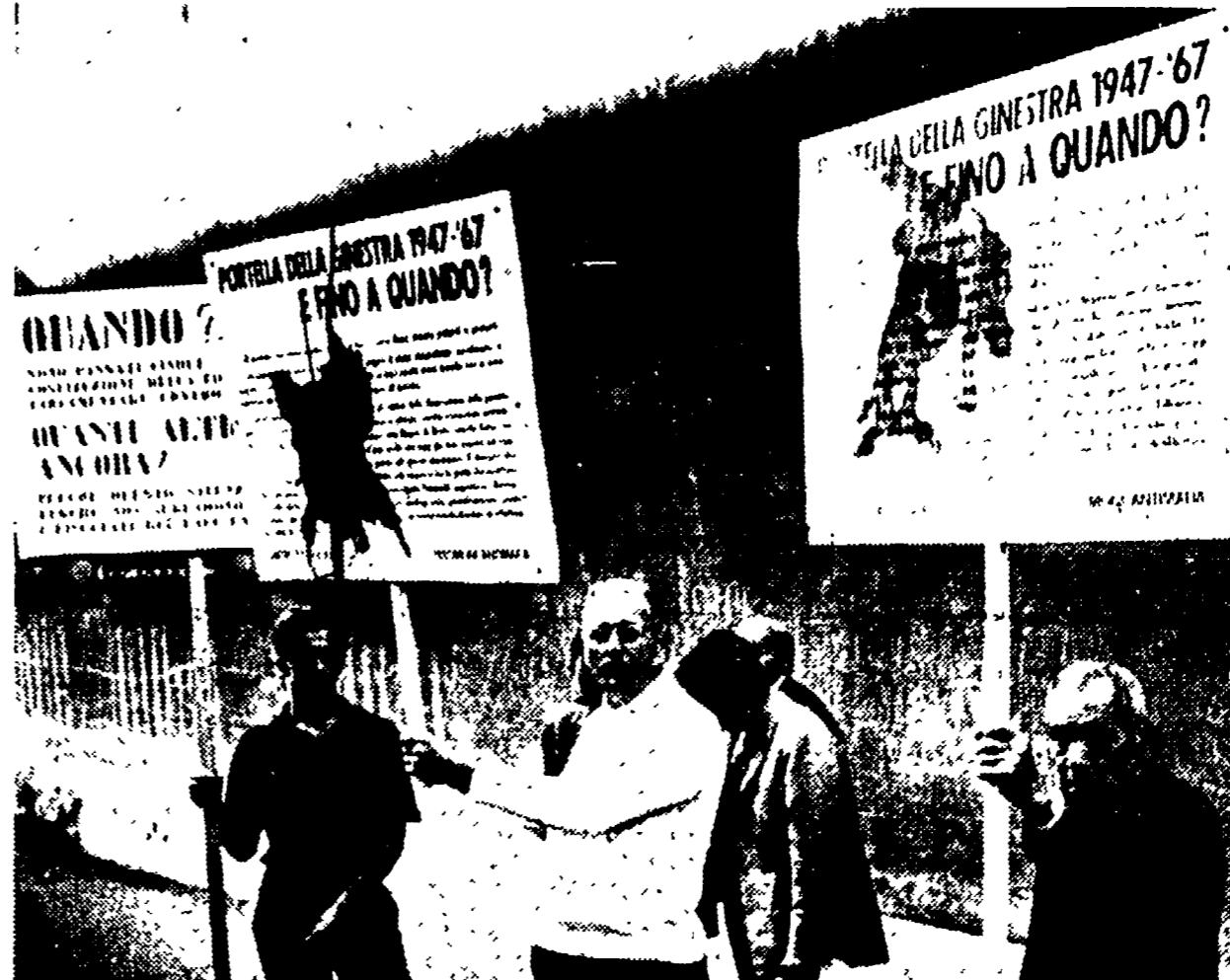
Per nove ore, dalle 9 alle 18 di ieri, Danilo Dolci e un gruppo di testimoni (fra cui un sacerdote di 86 anni) hanno manifestato in silenzio e con cartelli davanti al Senato e al palazzo della Sapienza dove ha sede la commissione antimafia...