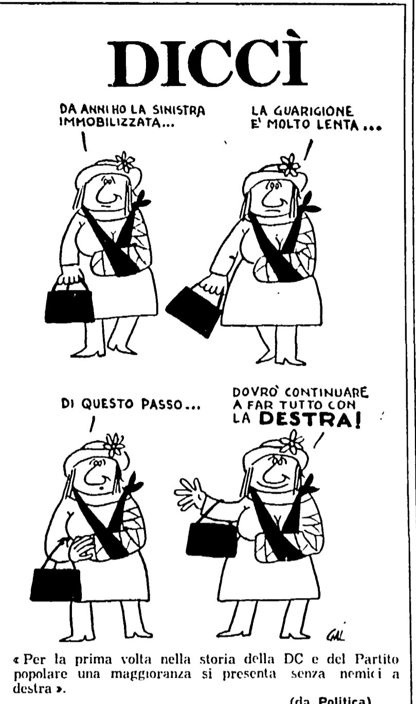
«Per la prima volta nella storia della DC e del Partito popolare una maggioranza si presenta senza nemici a destra».