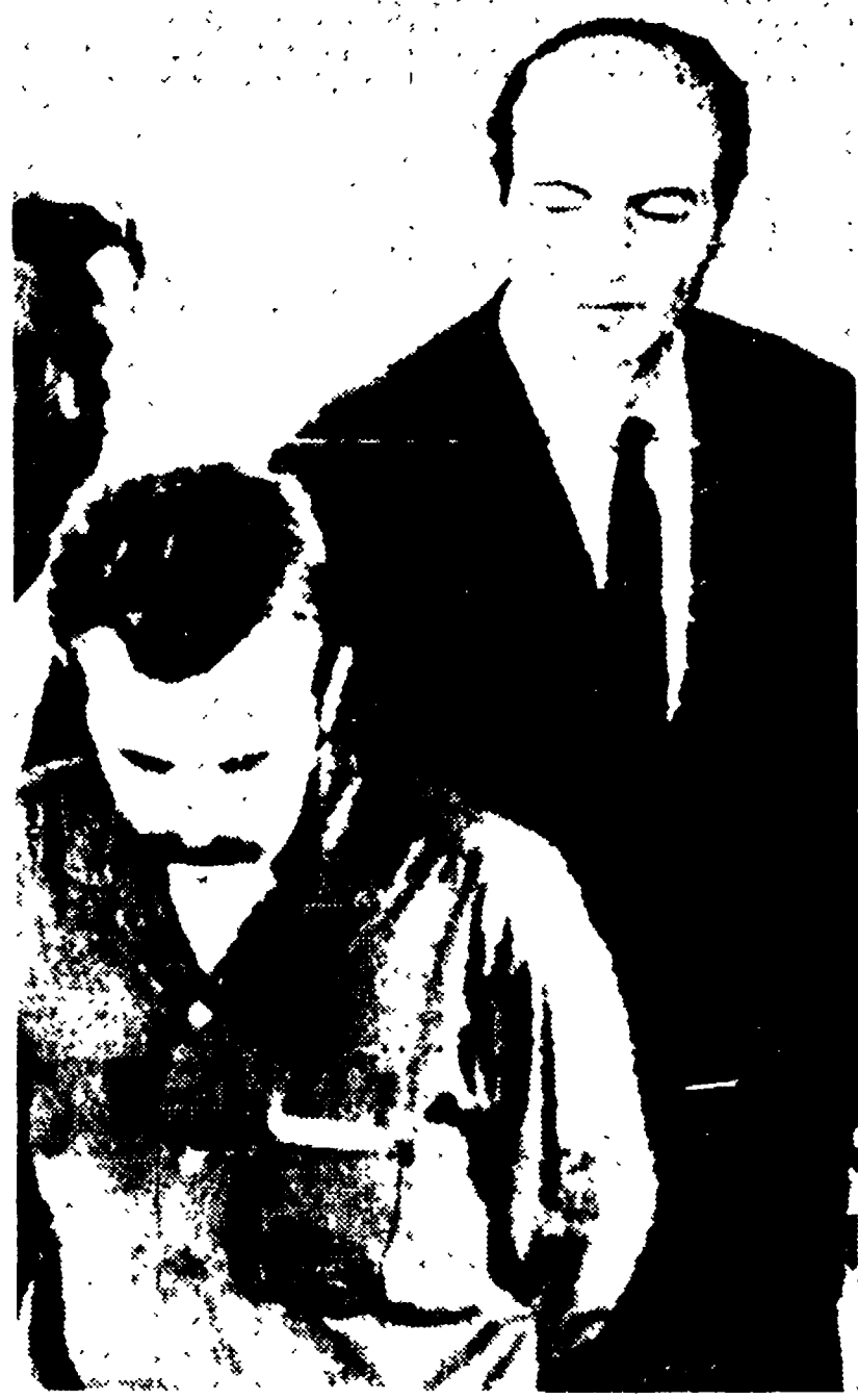
CAMIRI (Bolivia) — Lo scrittore Regis Debray, con le mani legate dietro la schiena, mentre viene condotto nell'aula del tribunale