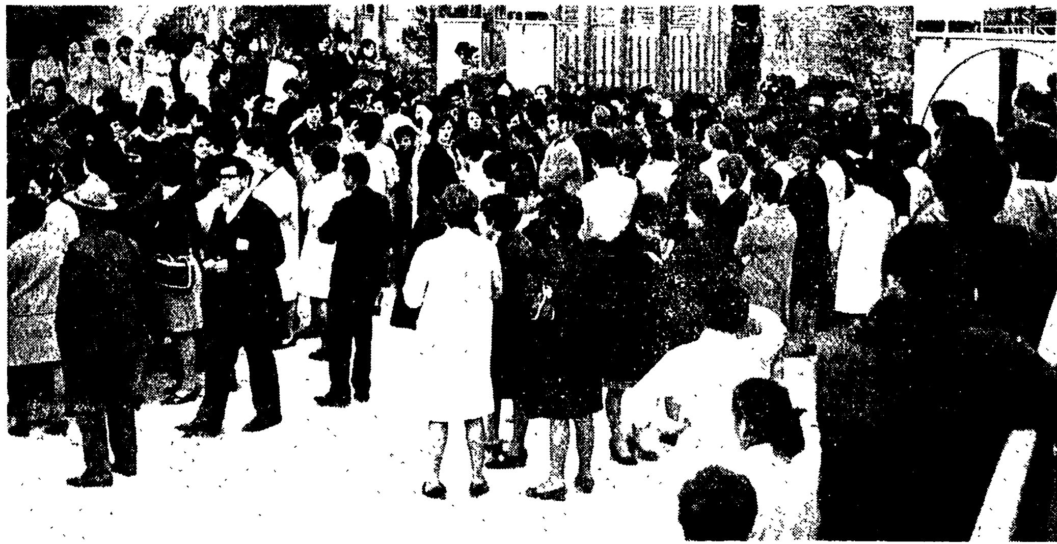
Le operaie della CIA manifestano davanti alla fabbrica

Rotto il clima di terrore instaurato nella fabbrica - Tutta la città solidale con le maestranze - Paghe di 30 mila lire mensili - Inqualificabile atteggiamento della forza pubblica - Lo sciopero continua anche oggi