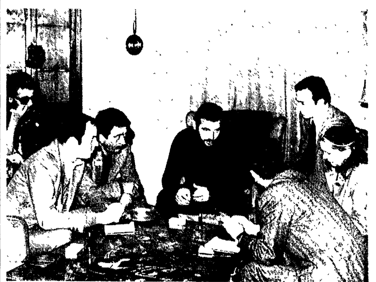
Maurizio Arena è stato denunciato da una persona - si assicura negli ambienti giudiziari - che non « ha nulla a che vedere con casa reale ». Il procuratore della Repubblica, ricevuta la denuncia per plagio (che prevede una pena fino a 15 anni) è entrato immediatamente in azione...