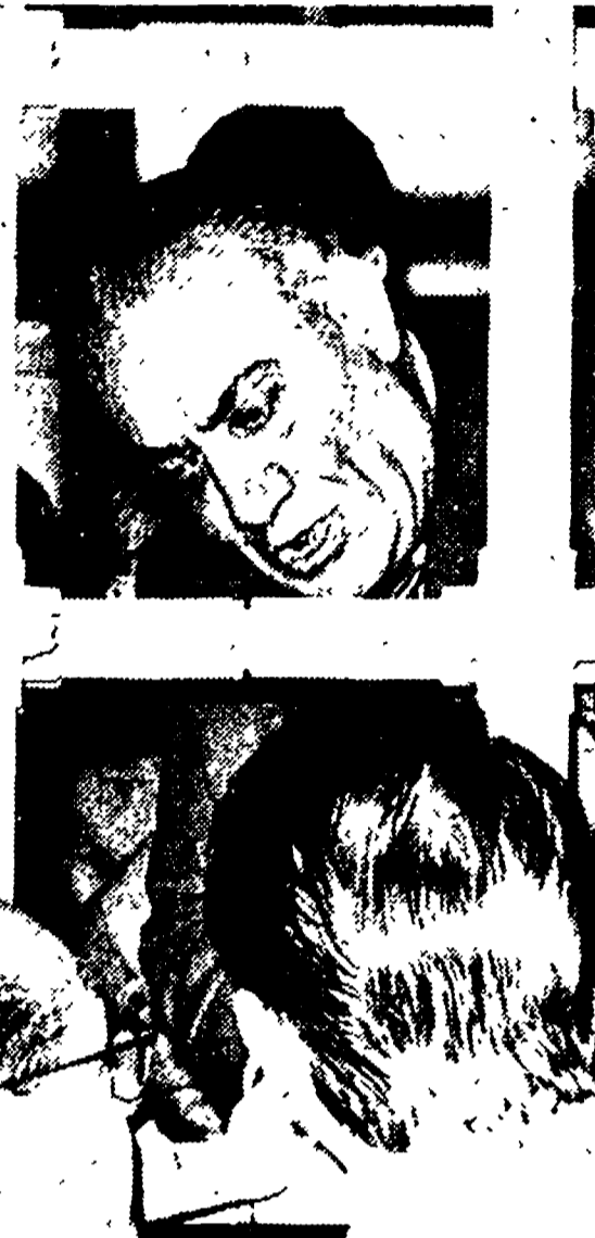
Rosario Mancino, il boss della droga interrogato ieri dai giudici di Catanzaro.