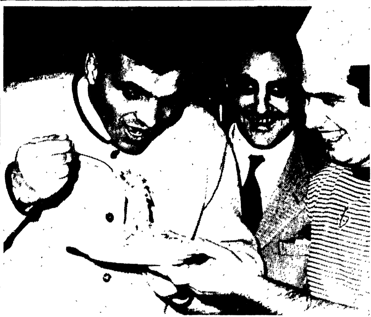
TOMASONI affronta questa sera al Palasport capitolino Hilton