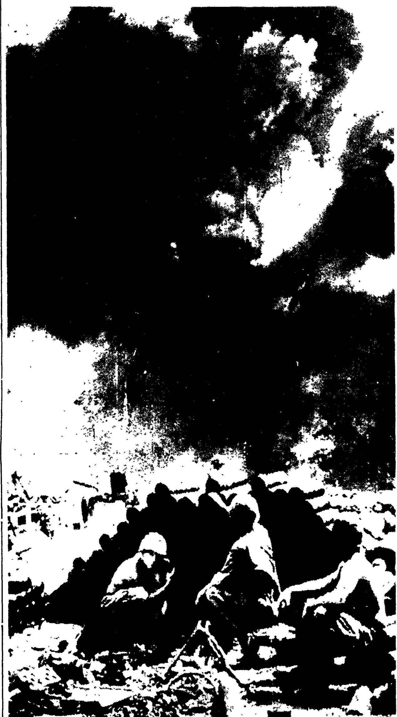
Dak To era una delle più muniti basi delle truppe e dell'aviazione americane sugli altipiani del Vietnam del Sud. I violenti bombardamenti dei maoisti vietnamiti l'hanno distrutta. La foto è stata scattata l'altro ieri mentre infuriava la battaglia. Una bomba ha centrato un deposito di dinamite e l'esplosione ha raso al suolo quanto era rimasto in piedi. Alcuni marines cercano scampo nascondendosi dietro una barricata improvvisata