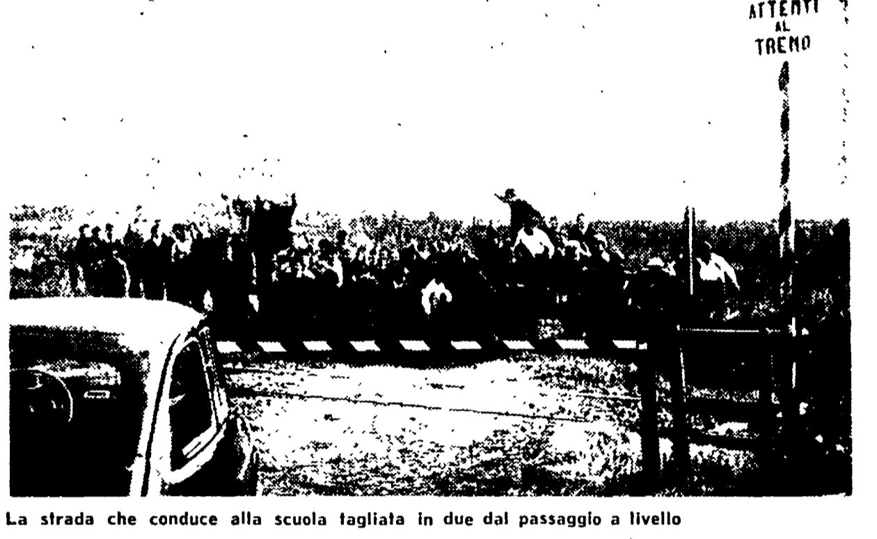
La strada che conduce alla scuola tagliata in due dal passaggio a livello

Anche la scuola in gabbia, grazie alla « Roma-Nord ». Sembra incredibile ma è proprio così: il collegio Santa Rita, che ha anche delle classi per allievi esteri, il passaggio a livello che è proprio a metà della via Flaminia, è rimasto chiuso da giorni dal resto del mondo perché i dirigenti della ferrovia hanno sbarrato, con un grosso lucchetto, il passaggio a livello che è proprio a metà della via Flaminia, e nessuno l'istituto alla via Flaminia. L'episodio è particolarmente grave e allo stesso tempo è ora opportuno che le autorità imponessero alla « Roma-Nord » di gettare il lucchetto e di affidare il passaggio a livello ad un custode.