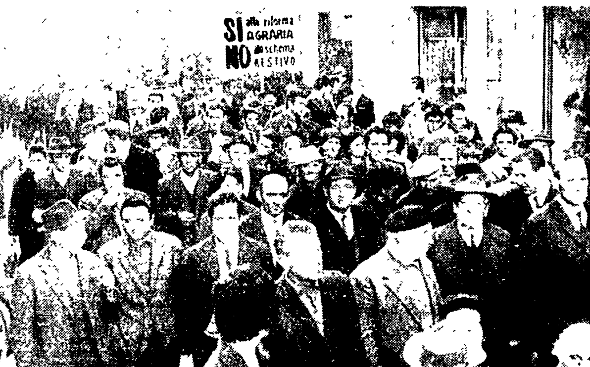
Un aspetto dell'imponente corteo svoltosi ieri a Pesaro