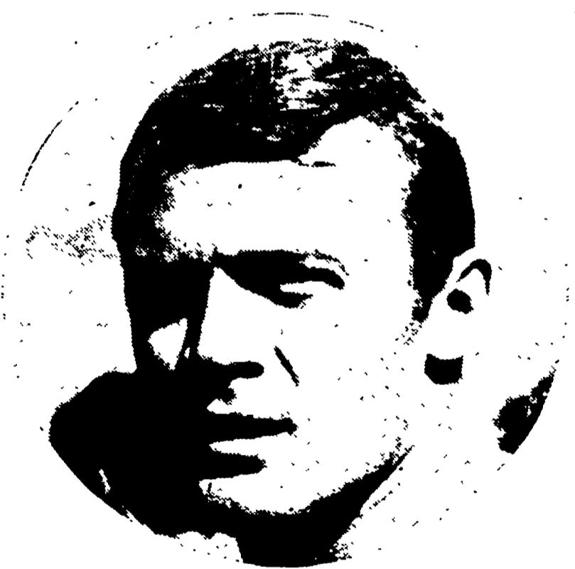
OSSOLA ha superato brillantemente il collaudo di ieri