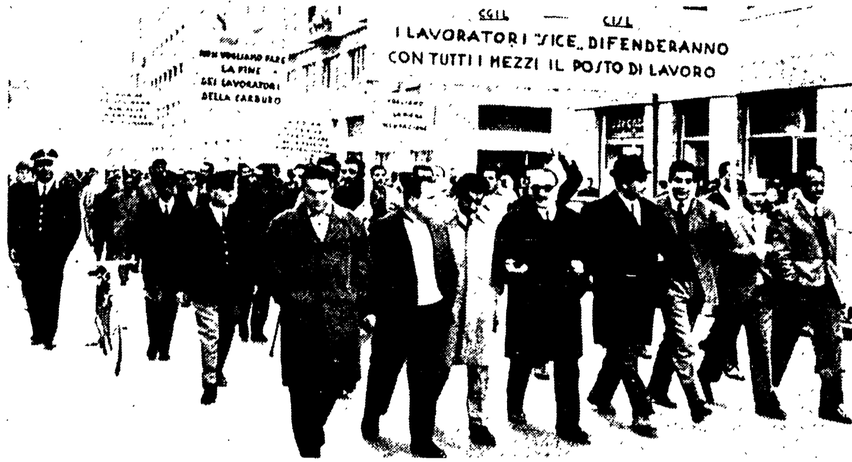
Una recente manifestazione per la salvezza della SICE

Ascoli P., 7. Lunedì prossimo i lavoratori ascolani scenderanno in sciopero per difendere il loro diritto al lavoro e perché si attuino nella città una decisiva svolta nella programmazione dello sviluppo economico... Abbiamo già accennato ai motivi che hanno reso necessario il ricorso allo sciopero generale: denunciare le drammatiche condizioni di lavoro nelle fabbriche e protestare contro quel tipo di sviluppo economico che è stato imposto alla città senza tener conto delle sue reali esigenze ed escludendo da ogni decisione i principali interessati, cioè i lavoratori e le forze che li rappresentano. Tutto si è ridotto ad una vera e propria « caccia all'industriale », da invitare costruendo per « lui » ponti d'oro, senza alcuna garanzia di un effettivo programma di sviluppo, offrendo sottobanco manodopera a sottosalario e da sfruttare il più intensamente possibile.