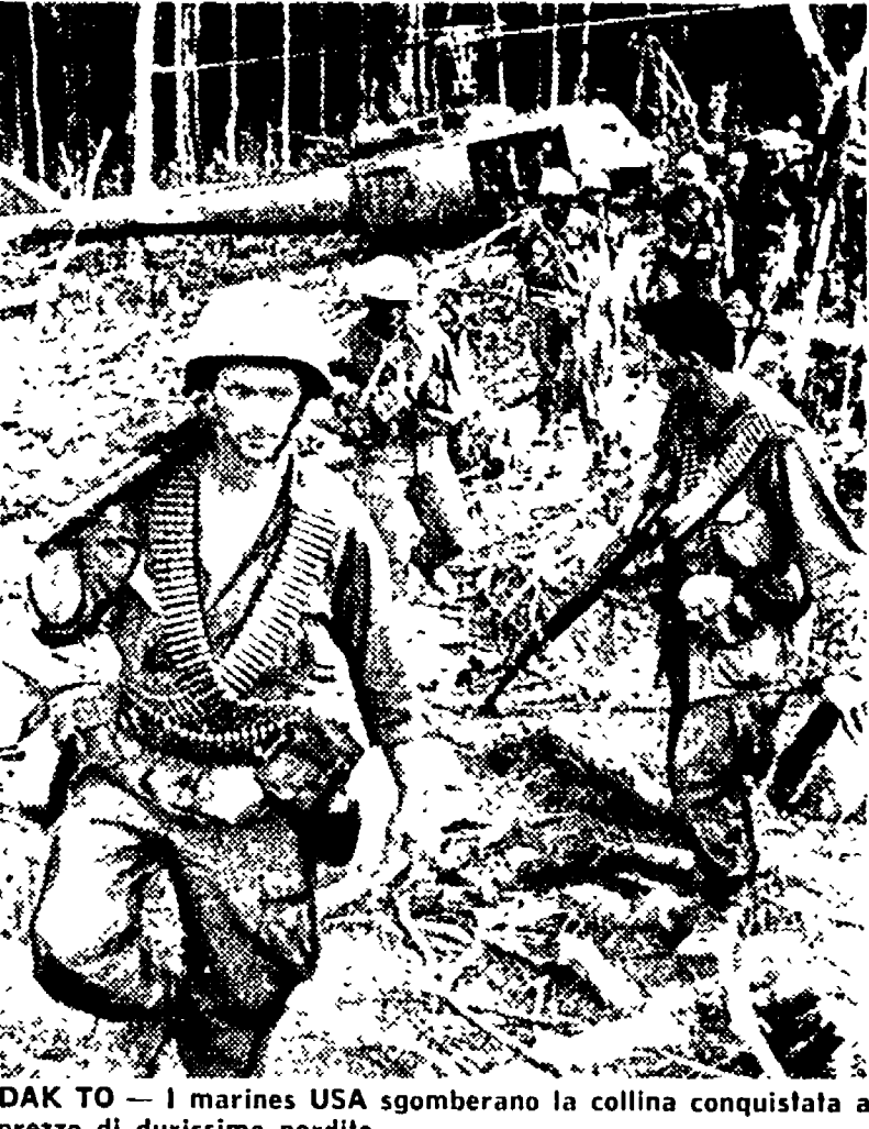
DAK TO — I marines USA sgomberano la collina conquistata a prezzo di durissime perdite.