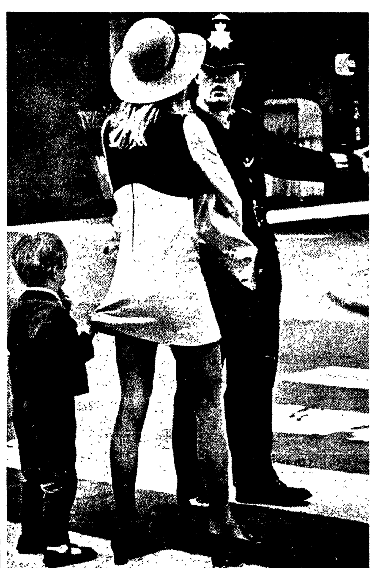
Non è vero che con la «mini» non ci si può più «allaccare alle gonne della madre»...