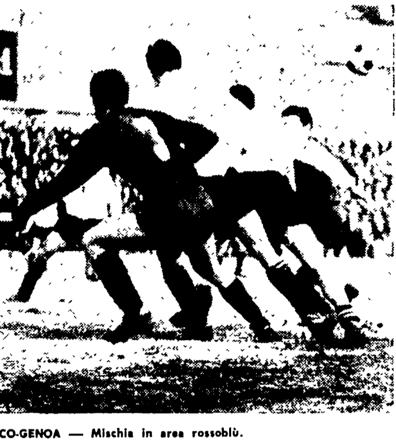
LECCO-GENOA - Mischia in area rossoblu.