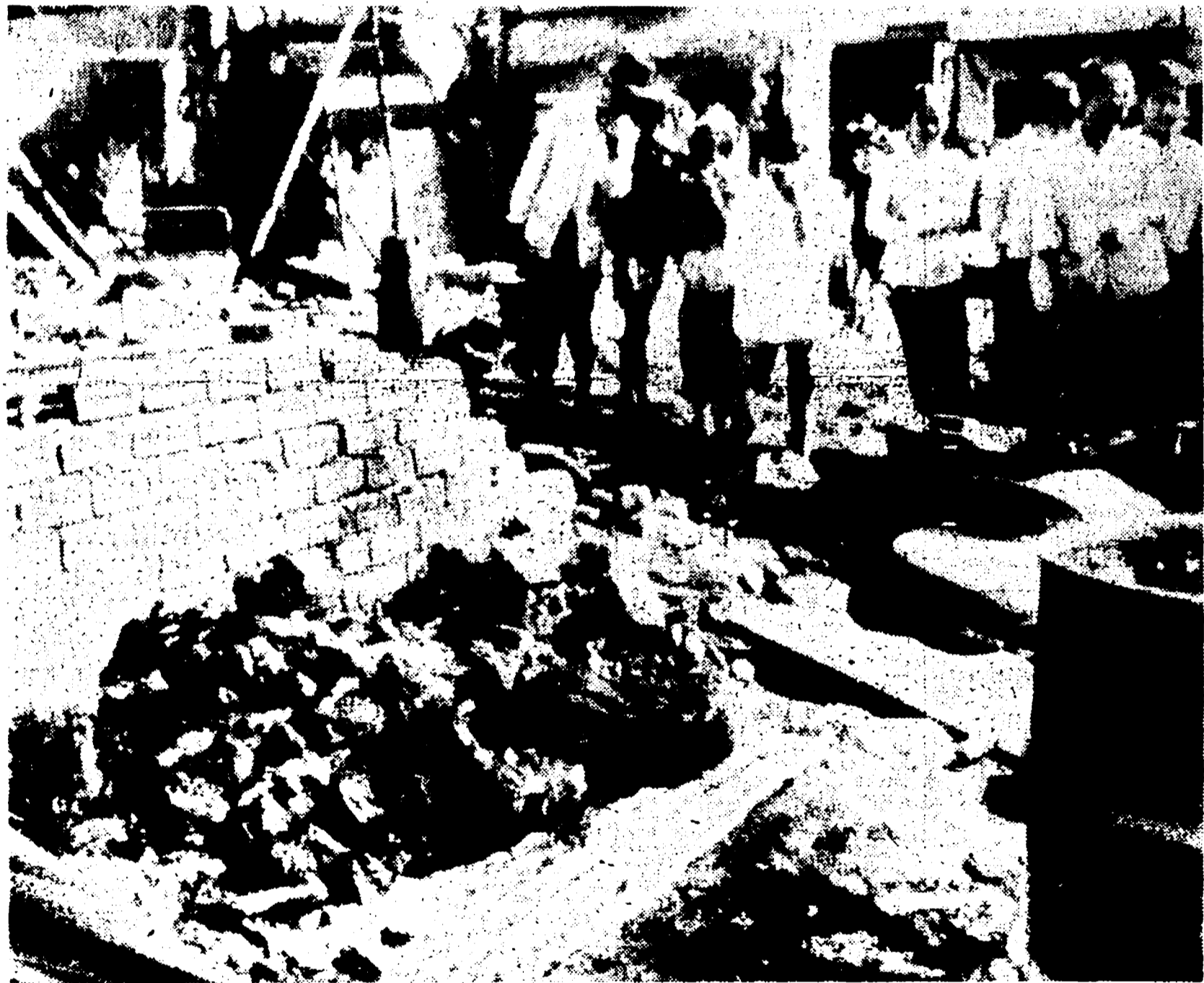
SAIGON — Un razzo illuminante lanciato l'altra notte da un aereo USA si è abbattuto su una casa incendiandola e provocando la morte di un'intera famiglia composta da padre, madre incinta e dieci figli. Nella telefoto AP: alcuni civili osservano i resti pietosamente raccolti delle dodici salme.

Attaccata una polveriera nella capitale - Hué sempre in mano alle forze di liberazione - Campo di partigiani prigionieri in fiamme: centinaia di vittime?