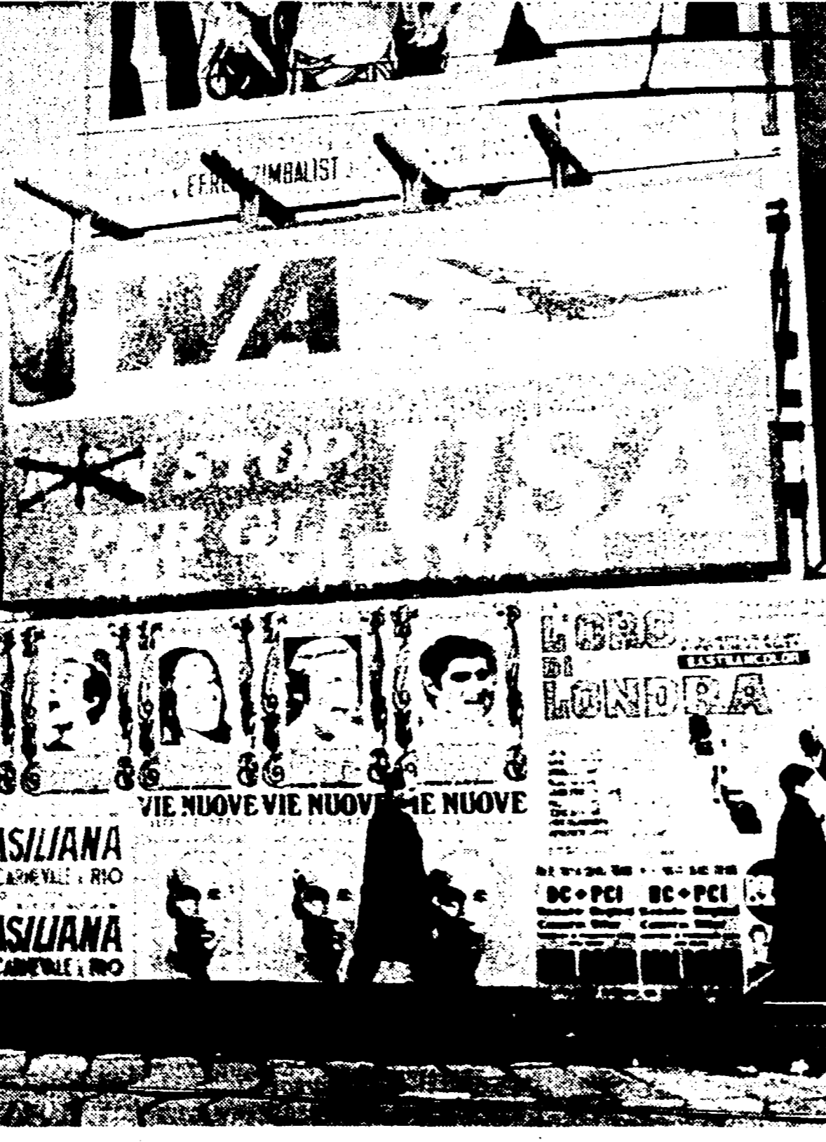
MILANO - Con un manifesto delle linee aeree americane TWA è stato trasformato in un manifesto di solidarietà con i combattenti della libertà del Vietnam...