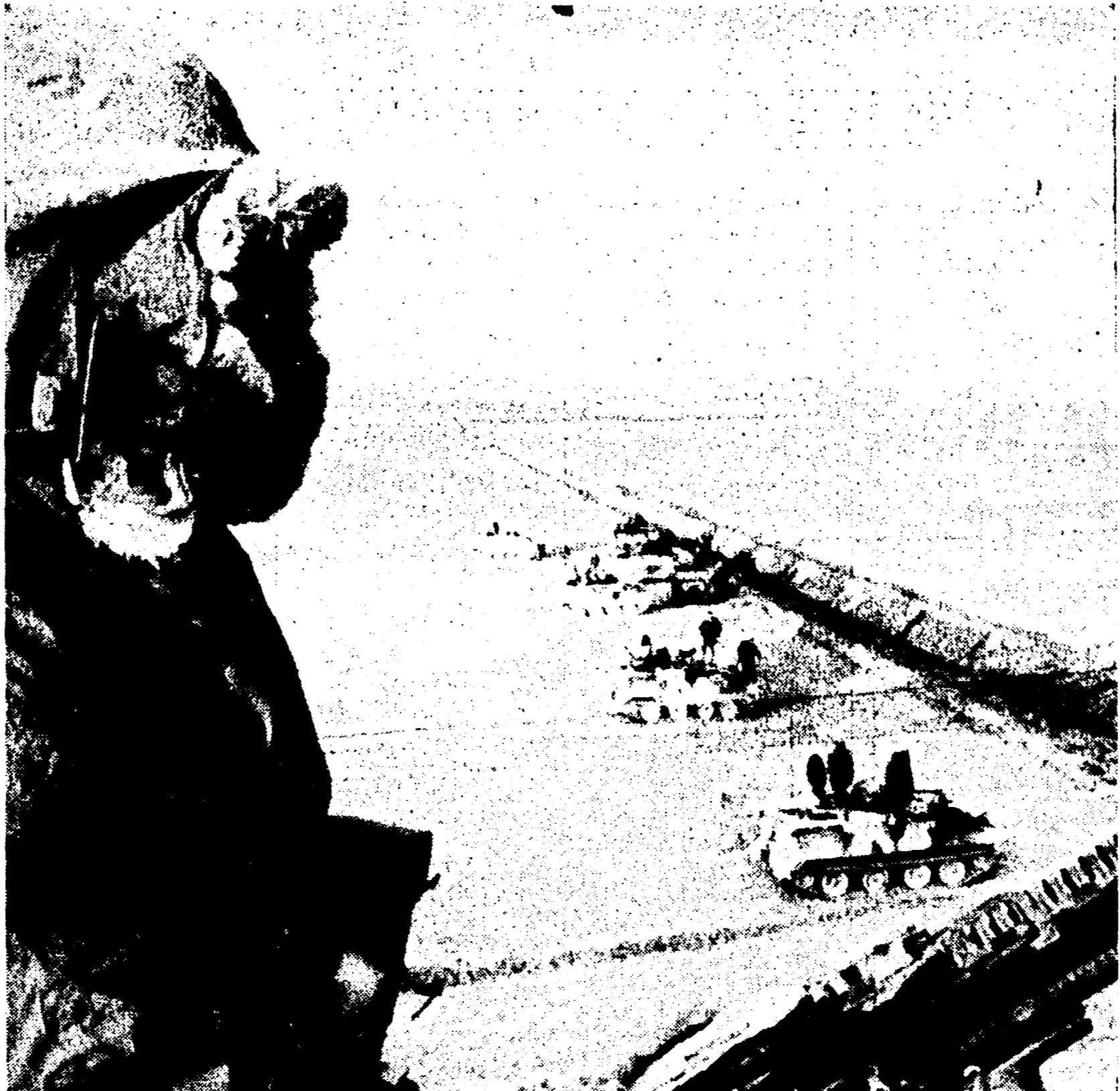
PANMUNJOM - Un soldato e carri armati americani schierati nei pressi di Panmunjom...