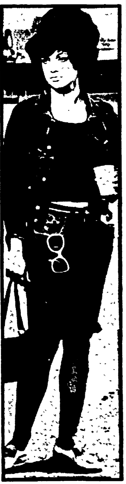
Costi apparirà Catherine Spaak nel film «Una ragazza piuttosto complicata»...