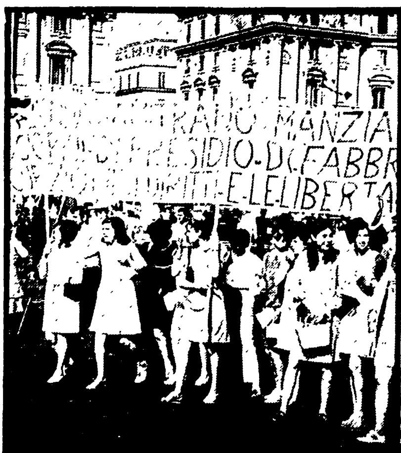
La ragazza di Manzanara, i deputati dell'Assemblea... (caption text describing the image)

Hanno scioperato anche alla Rai-TV - Il plauso delle organizzazioni sindacali ai lavoratori in un comunicato - Perché i trasporti hanno funzionato