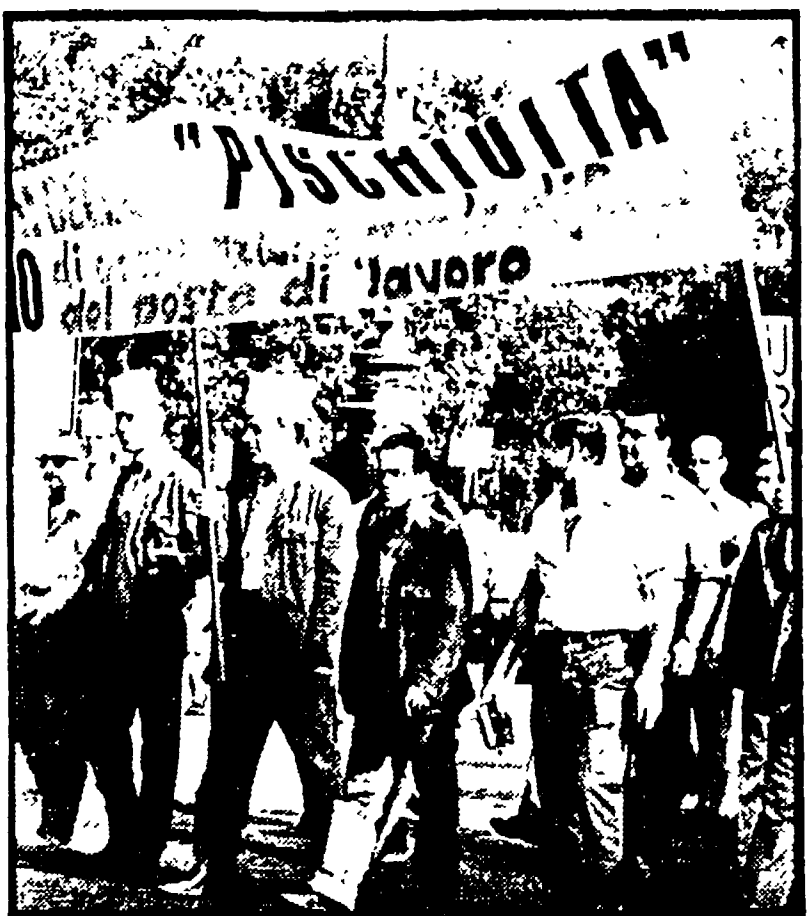
Il loro motto è: 'Pisculi'... (caption text describing the image)