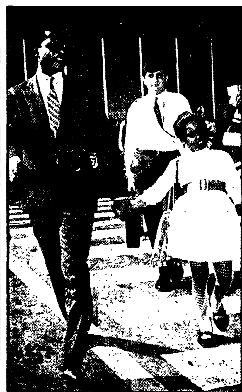
Sidney Poitler ha lasciato San Sebastiano, dove è tuttora in corso il Festival cinematografico...