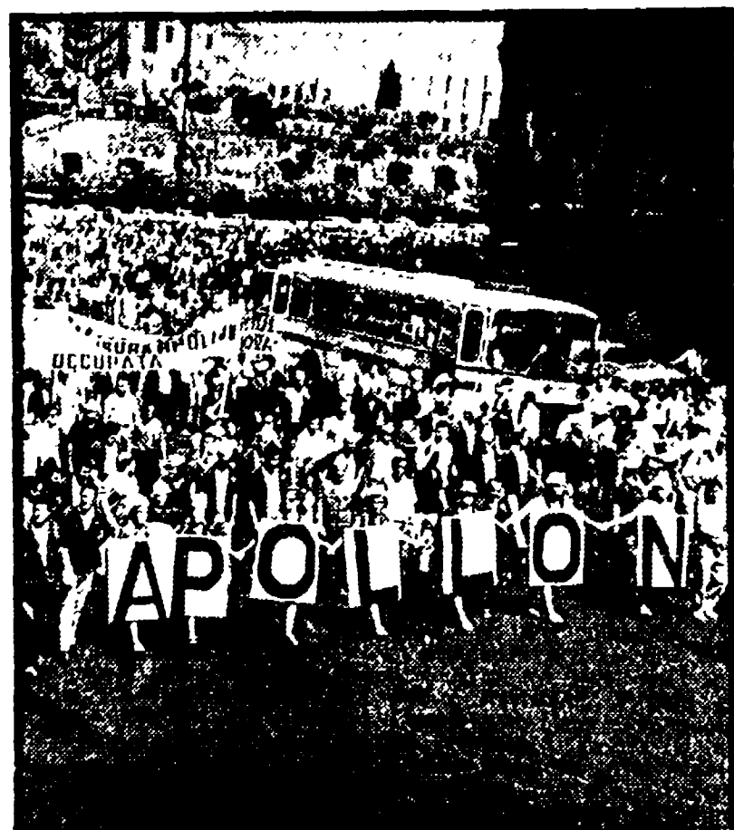
Mezzogiorno, il Comune e la Provincia di Roma, l'Unione... (caption text describing the image)