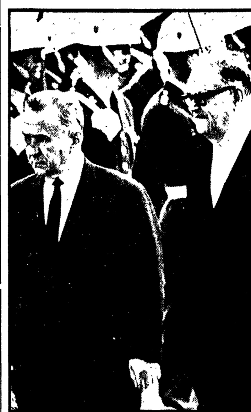
KOSSIGHIN A STOCOLMA Il primo ministro dell'URSS Alexei Kossighin, accompagnato dalla figlia Ludmilla Alexievna...