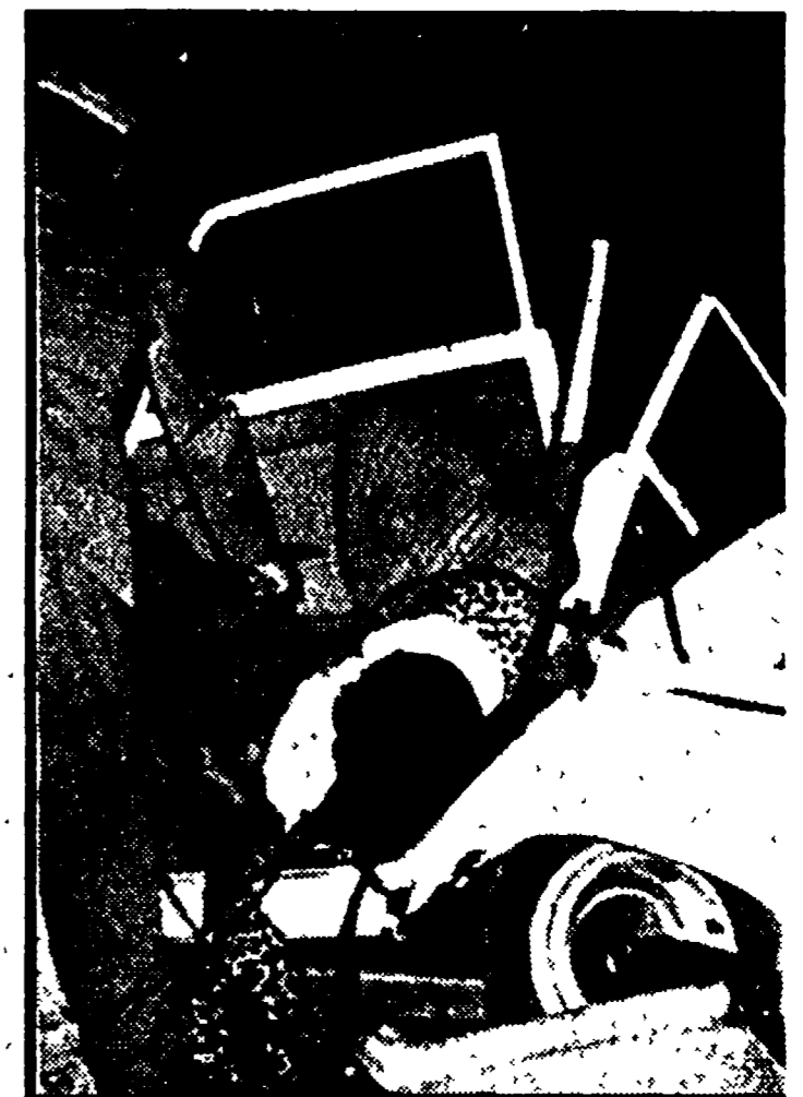
Migliaia di persone stanno abbandonando le città già semideserte per il tradizionale esodo del Ferragosto. Durante i giorni scorsi le strade sono state invase da cinque-sei milioni di automobili che hanno creato problemi enormi per il traffico. Purtroppo, all'aumento del traffico ha corrisposto anche un aumento pauroso degli incidenti: negli ultimi 15 giorni si sono avuti migliaia di incidenti con oltre 500 morti. E' un bilancio drammatico che deve far riflettere tutti gli automobilisti e renderli più prudenti. Per quanto riguarda la situazione meteorologica gli esperti prevedono tempo incerto fino alla fine della settimana. (A PAG. 2)

Ferragosto: tragico esodo 500 morti in 15 giorni