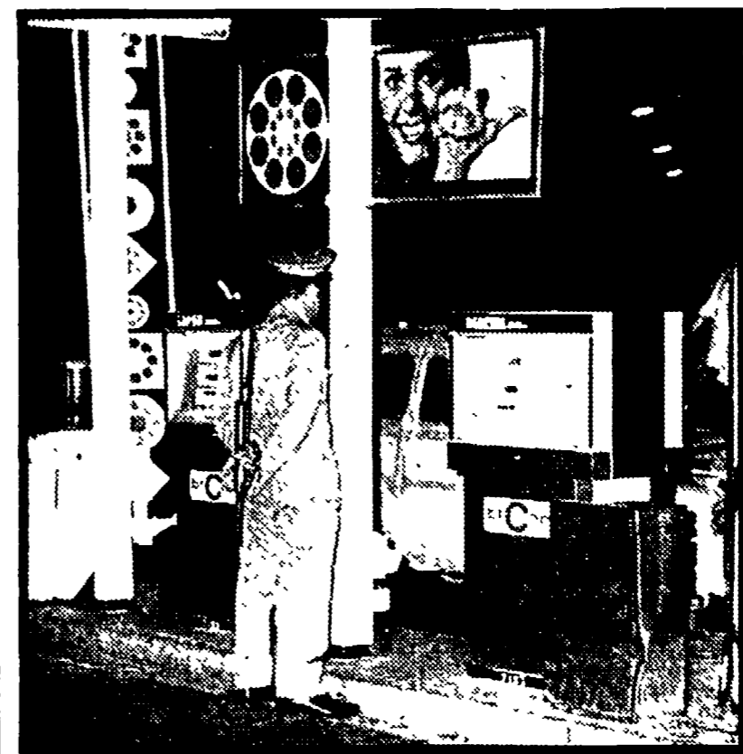
Un agente di guardia dinanzi ad un distributore.