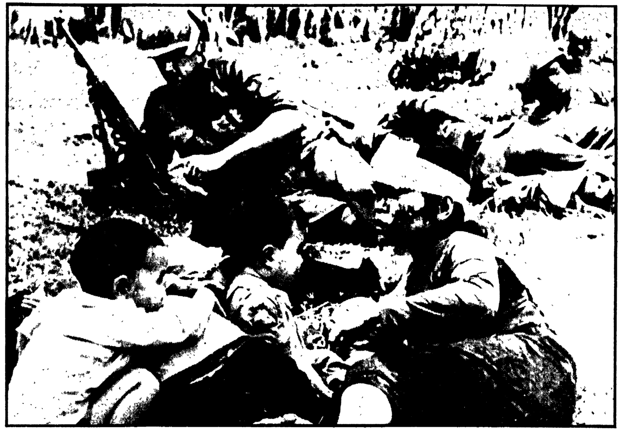
Una donna vietnamita, ferita nel corso dei combattimenti alle porte di Saigon, viene tenuta prigioniera da un gruppo di aggressori americani