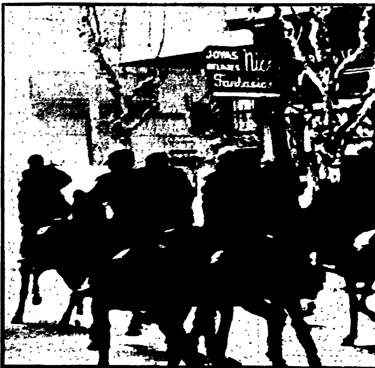
CARICHE CONTRO GLI STUDENTI URUGUAYANI Una nuova giornata di violenti scontri fra studenti da una parte e polizia e reparti di truppa dall'altra si è registrata a Montevideo. Nella foto: poliziotti a cavallo si lanciano contro gruppi di dimostranti in mezzo a nubi di fumo formate dai gas lacrimogeni. (A PAGINA 4)