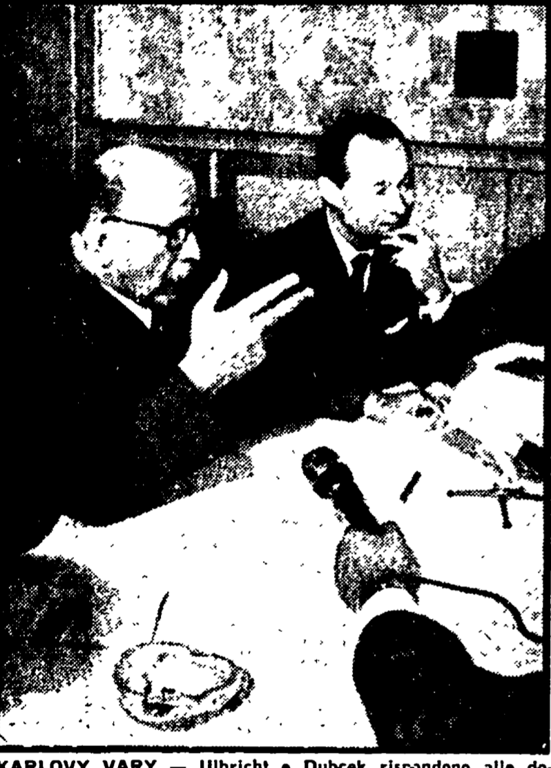
KARLOVY VARY - Ulbricht e Dubcek rispondono alle domande dei giornalisti durante la conferenza stampa.