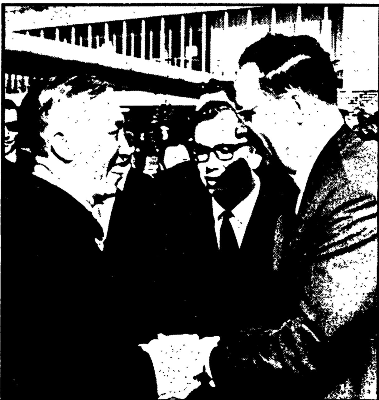
MOSCA - Le Duc Tho, inviato speciale della RDV ai colloqui di Parigi, alla sua partenza da Mosca. È a salutarlo il segretario del CC del PCUS Katushev (Telefoto TASS-Unità)

Ciò che è accaduto nel villaggio di Chanh-Luu - Gli USA continuano la «scalata» militare: violenta battaglia in corso presso Saigon - I B-52 bombardano sul confine con la Cambogia