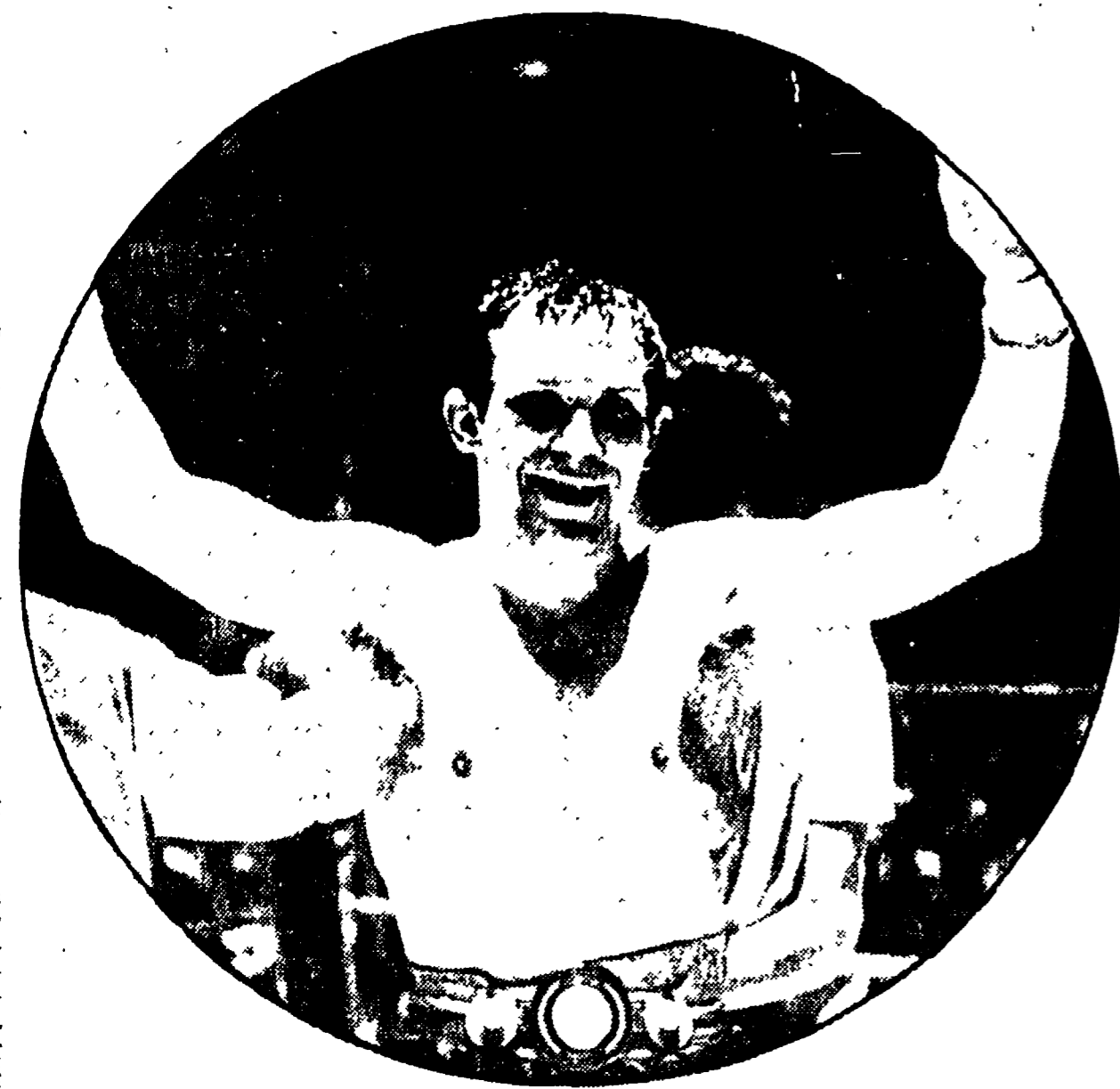
Il campione europeo CARMELO BOSSI

Nel sottoclo di fiorentino Bertini affronterà Tiberia per il titolo italiano dei welter