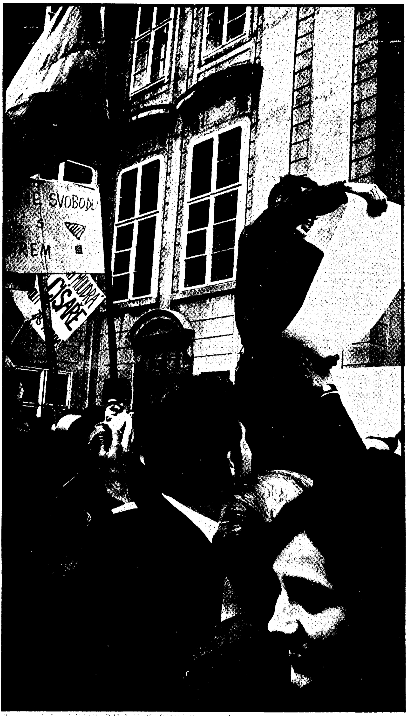
Assemblea nel cortile del castello della presidenza della Repubblica