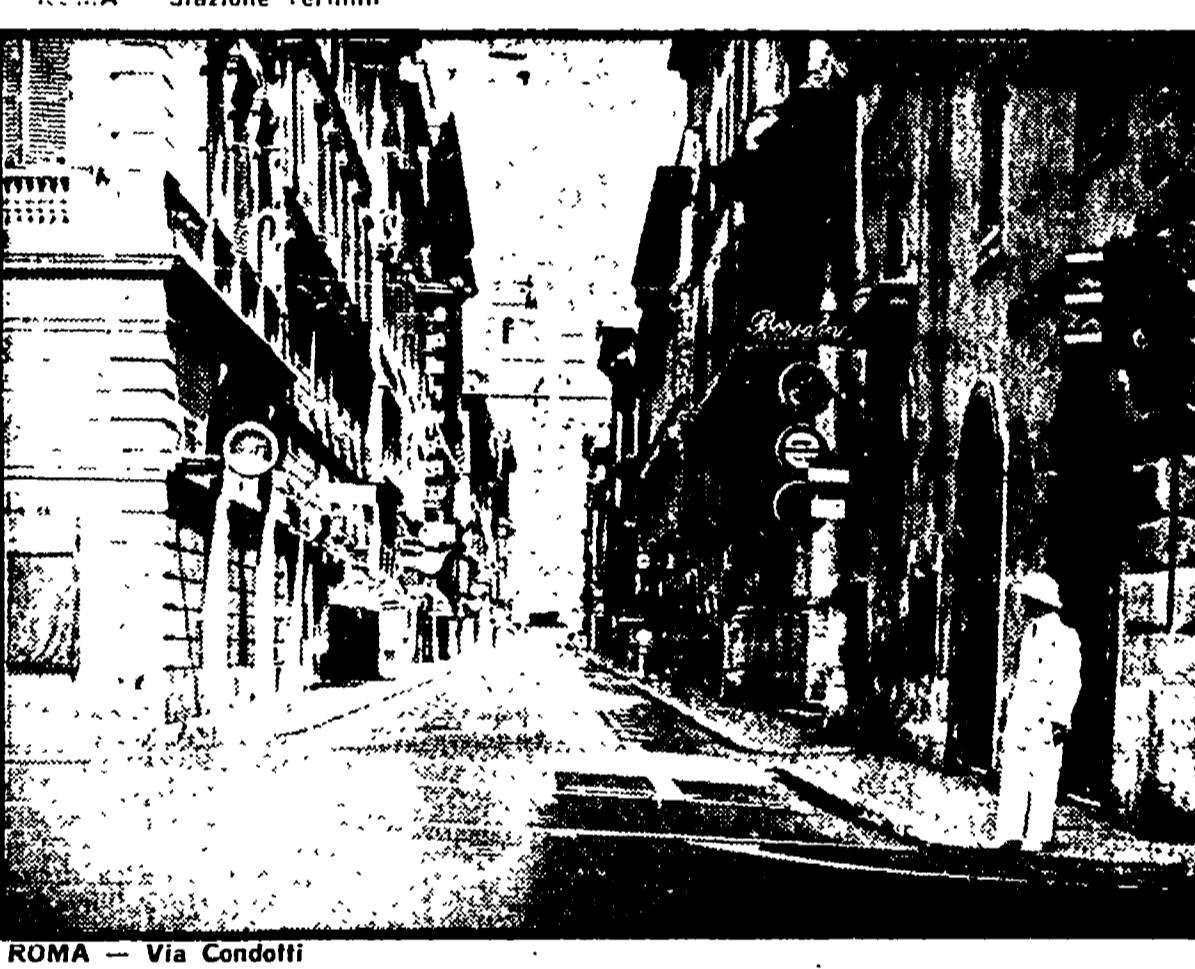
ROMA - Via Condotti