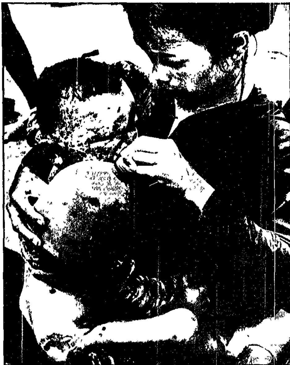
Un aspetto della tragedia del Vietnam. Anche nella giornata di ieri aerei americani hanno bombardato varie zone del Vietnam del Nord.

Piccolo aereo fatto dirottare su Cuba. NASSAU (Bahamas) 23. Un passeggero che aveva un biglietto per un piccolo aereo di linea è stato dirottato su Cuba. L'aereo è stato costretto a cambiare rotta a causa di un problema tecnico.