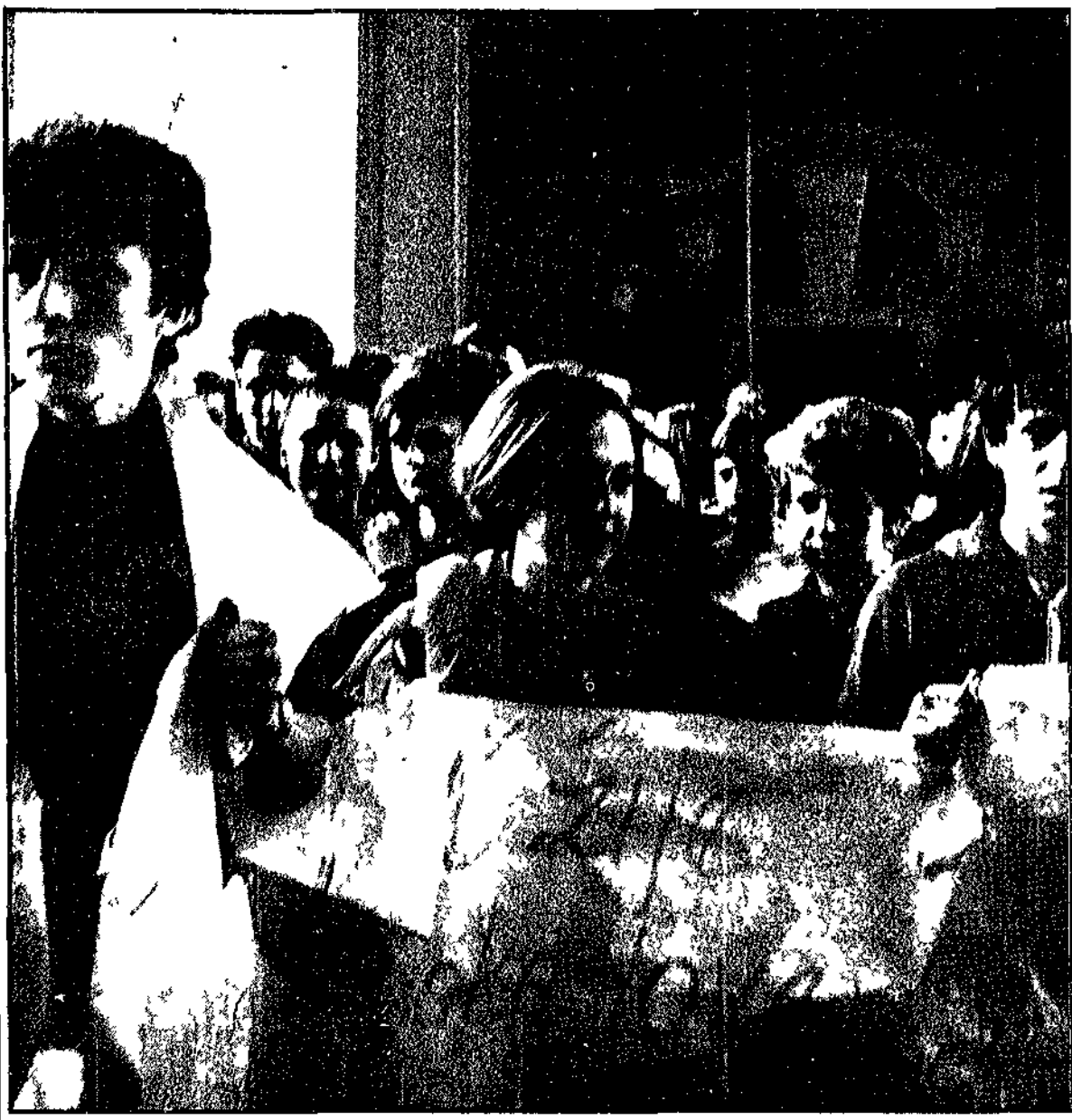
PRAGA - Un gruppo di studenti, recanti cartelli inneggianti al socialismo e alla repubblica cecoslovacca, dinanzi all'ingresso principale del Castello

Commozione e unità di tutto il popolo - Un paziente dialogo con i soldati e i turisti stranieri - La gioventù manifesta per la libertà e il socialismo