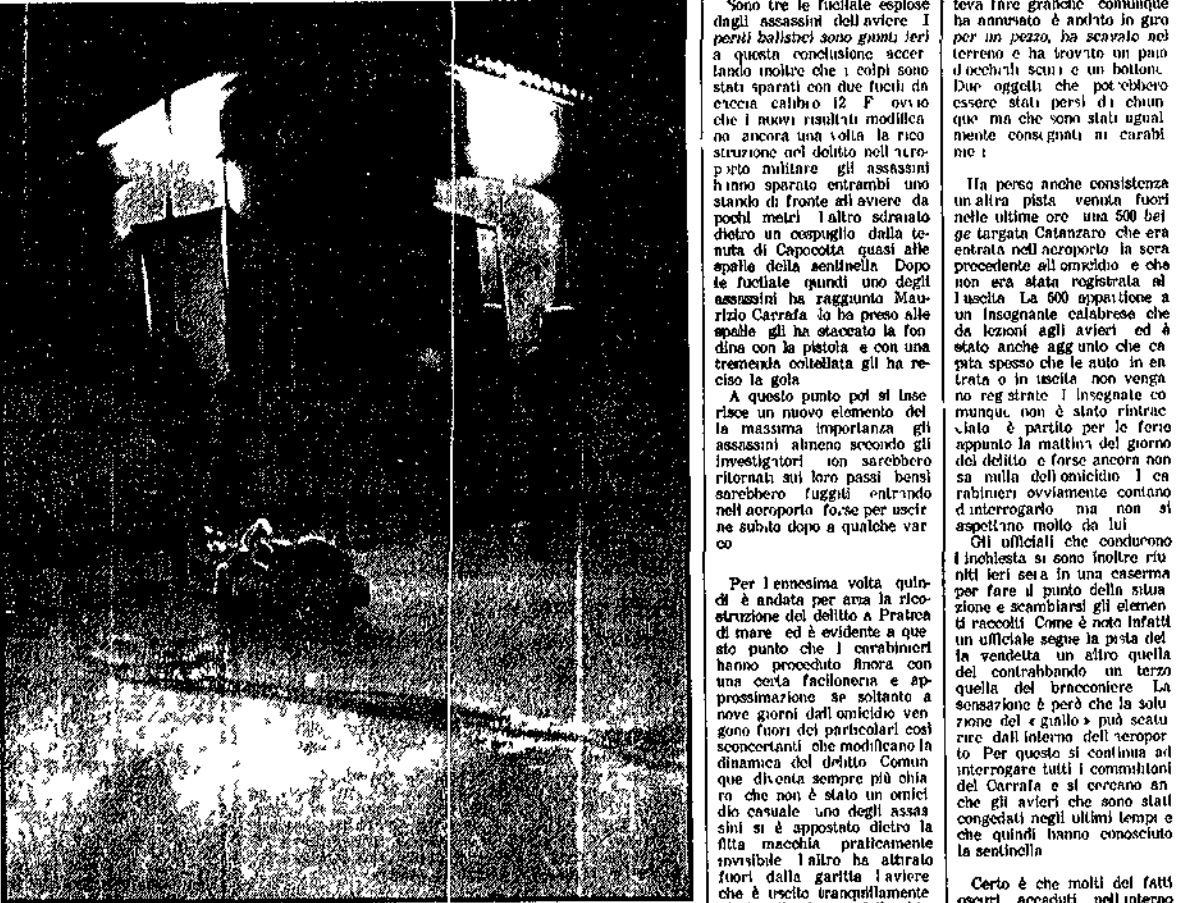
Il corpo dell'aviere adagiato dinanzi alla garitta pochi minuti dopo la scoperta del delitto

I colpi sparati con un'arma calibro 12 - Introvabile Elena, la «fidanzatina» della sentinella - Dox junior trova un paio d'occhiali e un bottone mentre si cerca la 500 di un insegnante - I punti oscuri nell'inchiesta sulla base militare