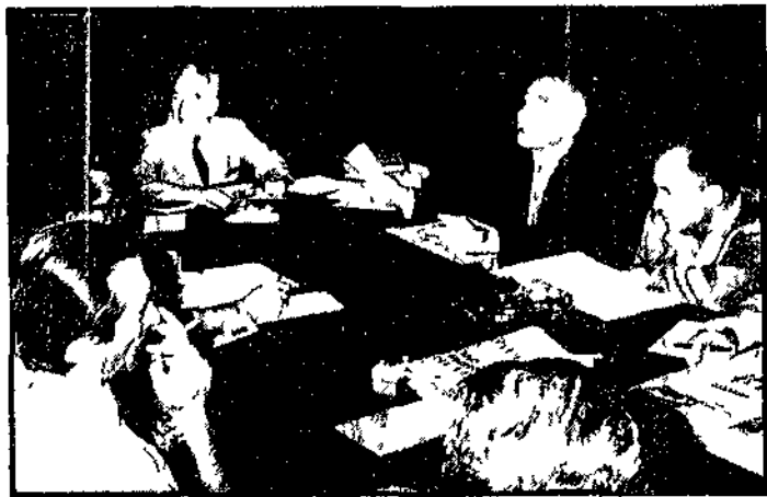
La riunione della Direzione