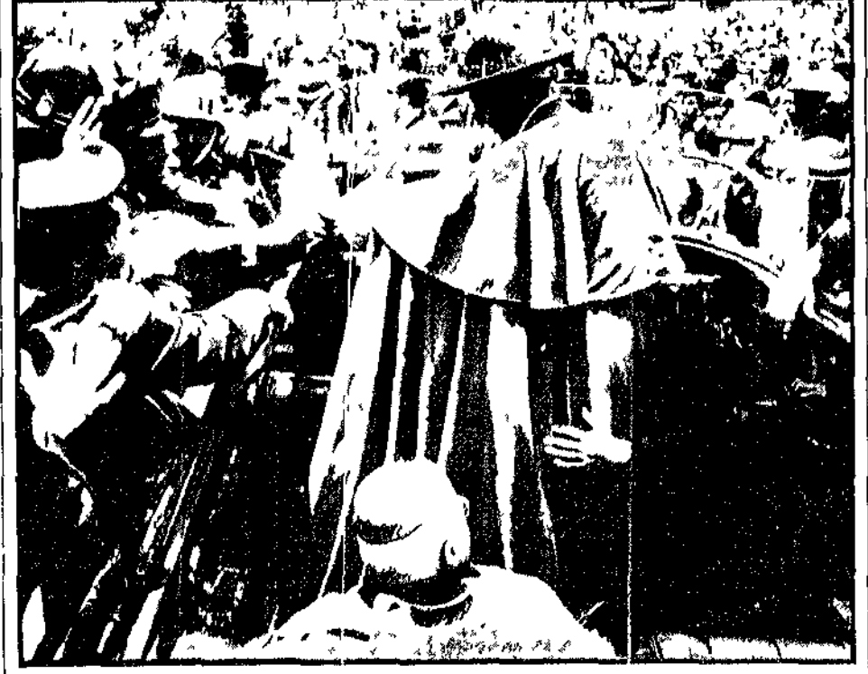
BOGOTÀ - Paolo VI per le strade di Bogotá

Il papa ha parlato di «campesinos» e di «campesinismo». Ha sottolineato l'importanza della vita rurale e ha esortato i leader politici a lavorare per il benessere delle masse contadine. Ha criticato le condizioni di vita in cui vivono i contadini e ha suggerito una via gradualista allo sviluppo.