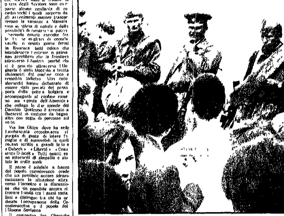
PRAGA — Una immagine dei contatti fra le truppe dei cinque paesi e la popolazione cecoslovacca. Giovani praghensi avvicinato un gruppo di soldati sovietici e discutono con essi, cercando di spiegare le ragioni della loro protesta contro l'occupazione del loro paese.

« Il paese è solidale a fianco del popolo cecoslovacco... »