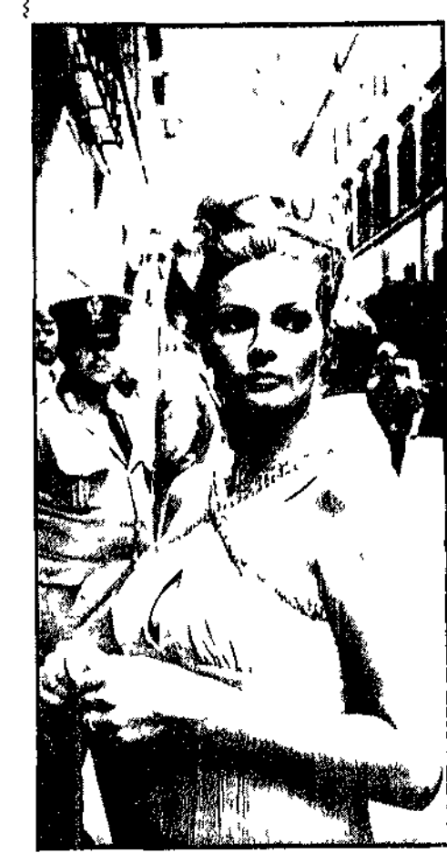
Anita Ekberg in via Frattina. L'attrice non è tornata a Roma come turista ma per lavoro «Anitona» ha infatti una parte in «Se è martedì, questo deve essere il Belgio», un film che prende garbatamente in giro i turisti americani in Europa.