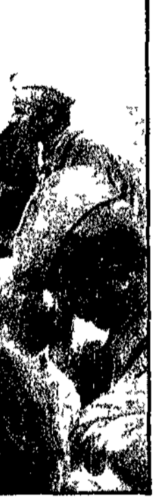
« Ritiro immediato delle truppe »

SVEZIA « Ritiro immediato delle truppe »