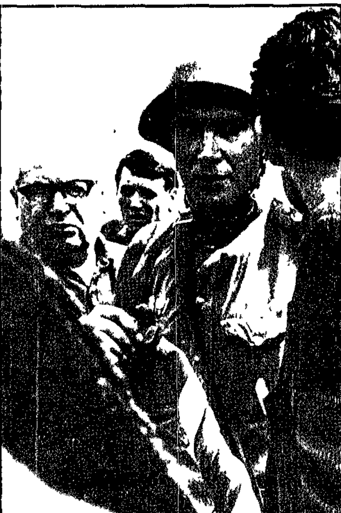
PRAGA — Un soldato sovietico, circondato da un gruppo di cittadini che lo interrogano e discutono con lui. Fin dal primo momento, la popolazione cecoslovacca ha cercato il contatto con le truppe dei cinque paesi alleati nella grande maggioranza del caso una forma di resistenza non violenta, fondata sulla protesta e sulla spiegazione delle proprie ragioni

Il giornale scrive anche che si sono riuniti a Praga i deputati del Parlamento che si sono riuniti a Praga. Il giornale scrive anche che si sono riuniti a Praga i deputati del Parlamento che si sono riuniti a Praga.