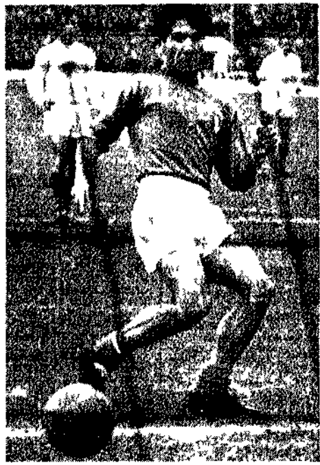
Del nostro corrispondente