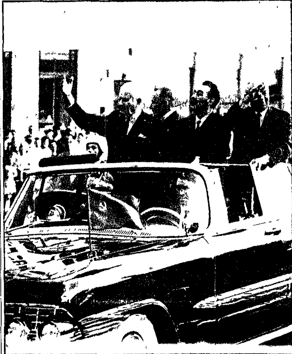
MOSCA - L'arrivo del Presidente cecoslovacco Svoboda. Insieme a lui nella vettura scortata Breznev, Kossighin e Podgorni