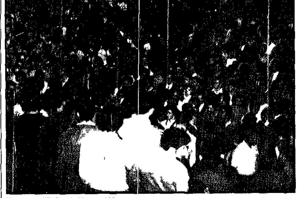
Milano, maggio 1968. Gli studenti in piazza del Duomo