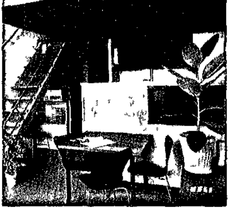
BRIEY-EN FORET — La facciata occidentale della «Cité radieuse» di Le Corbusier (sotto) e una sala di soggiorno dell'«Cité radieuse» di Le Corbusier

Carboni. Uomo che lavora sotto terra. Vive in un mondo tutto ciò che stappa del minatori visto letto nel le fotografie nei film sui giornali. In loro cronaca sempre viene alla trapela la loro «dimensione» di proletari che pagano un prezzo di vita sempre troppo alto. Ma non ci fermiamo. Siamo qui per andare a vedere un'altra «dimensione» dell'uomo scoperta da Le Corbusier. Il chiodo della vita e l'ombra a ce che in questo angolo di Francia dove qualcuno ha permesso di costruire una città in piena campagna in un'isola di cemento con tutti e tutti niente più voluti, ostentati, mode, ogni una paradosi si fa avanti in città così come è e si pieghi il cemento alle sue esigenze. La casa serve per dormire, mangiare, pensare il meglio possibile, si identifica in uno spazio alto come l'uomo e tutto intorno la città si rimbomba le macchine e lavora per lui per i mariti le mogli i figli e il loro gran da fare per crescere il meglio possibile e nel modo più organizzato possibile. La città fa che largo Avanza l'unità di abitazione.