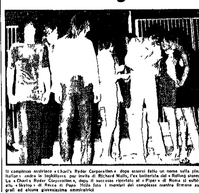
Il complesso austriaco «Charl's Ryder Corporation» dopo essersi fatto un nome sulla piazza italiana, andrà in Inghilterra per invito di Richard Wood, l'ex ballerista del «Rolling stones».