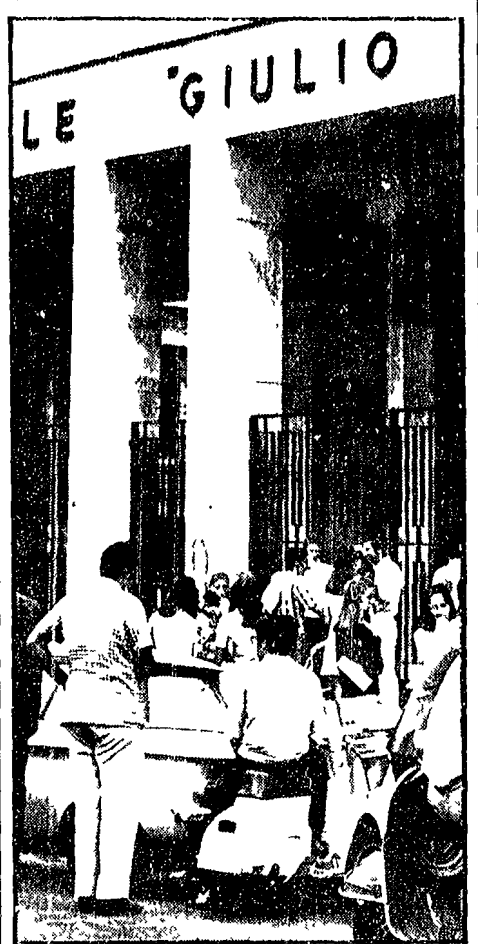
IERI LATINO, ESTIMO E RAGIONERIA

«L'Osservatore Romano» li tranquillizza: è un documento «di studio».