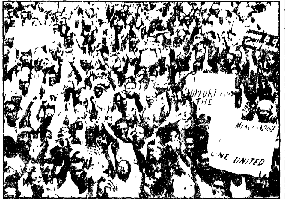
Lagos - Il comando militare nigeriano ha annunciato la conquista della città di Owerri, una delle ultime rimaste in mano ai secessionisti biafrani. Ora il territorio del Biafra è ridotto a 250 chilometri quadrati.