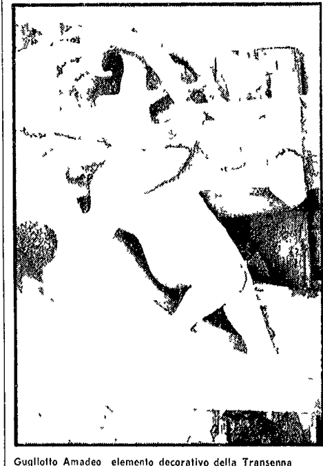
Guglielmo Amadeo elemento decorativo della Transenna

Presenti studiosi di vari paesi — La necessità di iniziative organiche sulla cultura milanese nel quadro europeo — Storia e costume attraverso i secoli