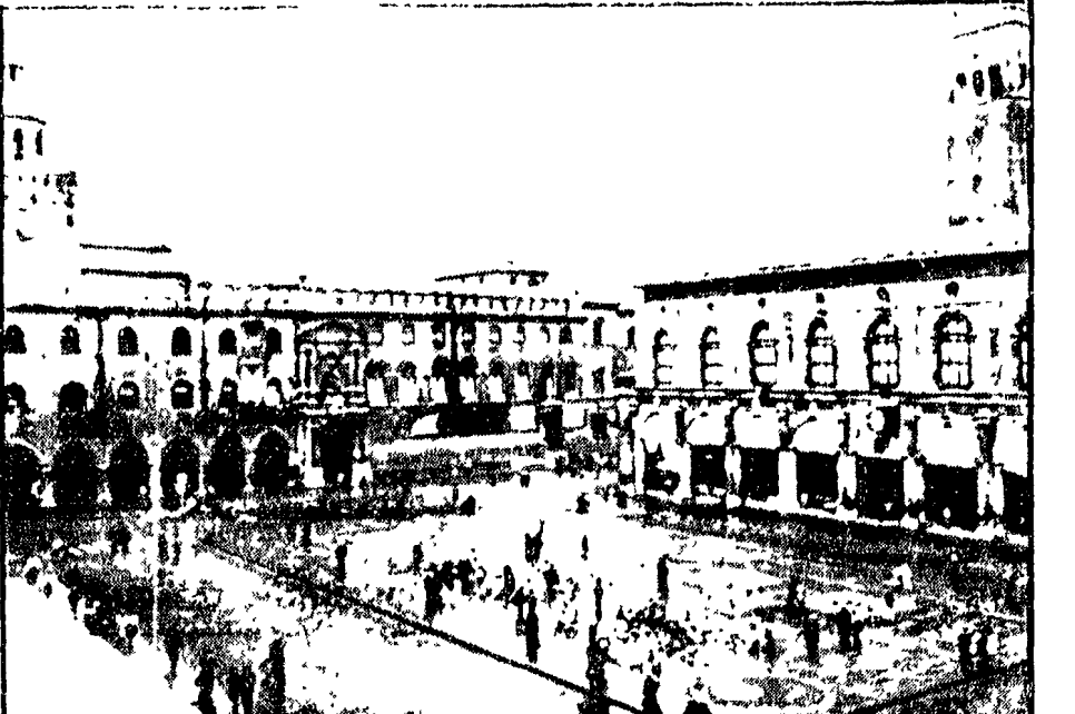
BOLOGNA: generali consensi all'«isola pedonale» nel centro storico

Non è vero che sarà di 300 miliardi all'anno il maggiore gettito per nuove entrate in base alla legge sulla finanza locale approvata dal governo Leone per gli enti locali. Si tratta invece - e ha dichiarato il compagno in Raffaele - di un impegno di spesa che non ci sono. Il compagno Raffaelli ha detto che l'attuale linea imposta dalle forze più conservatrici del Pci è di 100 miliardi all'anno. Il compagno Raffaelli ha detto che l'attuale linea imposta dalle forze più conservatrici del Pci è di 100 miliardi all'anno. Il compagno Raffaelli ha detto che l'attuale linea imposta dalle forze più conservatrici del Pci è di 100 miliardi all'anno.