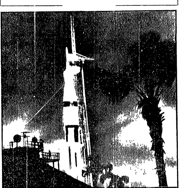
CAPE KENNEDY. Un missile del tipo Saturno, montante sulla testata una capsula spaziale Apollo, sulla rampa di lancio della base spaziale americana durante una prova del carburante. E' con questo tipo di vettore che la NASA sta preparando il lancio verso la Luna, ma il programma spaziale statunitense è molto in ritardo.