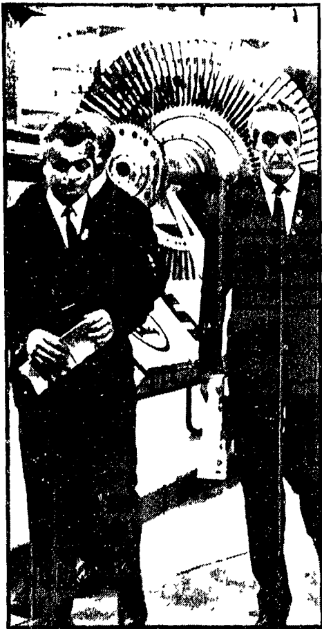
BRNO. Il ministro polacco del commercio estero, Trampezynski (a sinistra) visita la fiera di Brno accompagnato dal suo omologo cecoslovacco Vaclav Valec

Il nuovo « vertice » sovietico-ecoslovacco si terrebbe a fine settimana - In aumento gli acquisti sul mercato interno, caduta delle esportazioni con l'Est e con l'Ovest