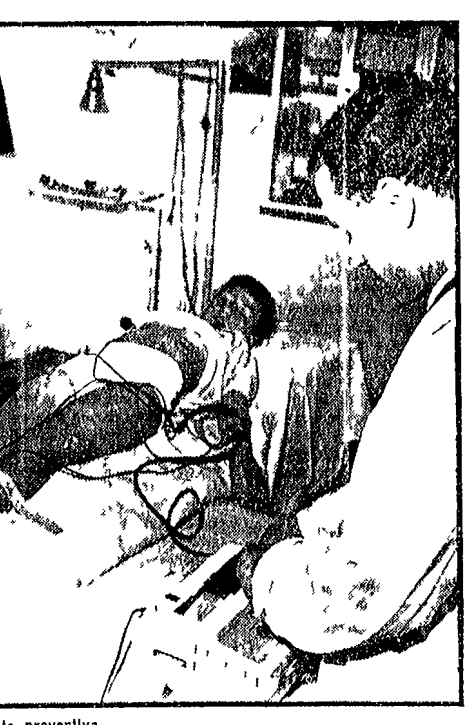
Un bambino sottoposto a visita preventiva

Il consorzio sarà impegnato per settanta milioni