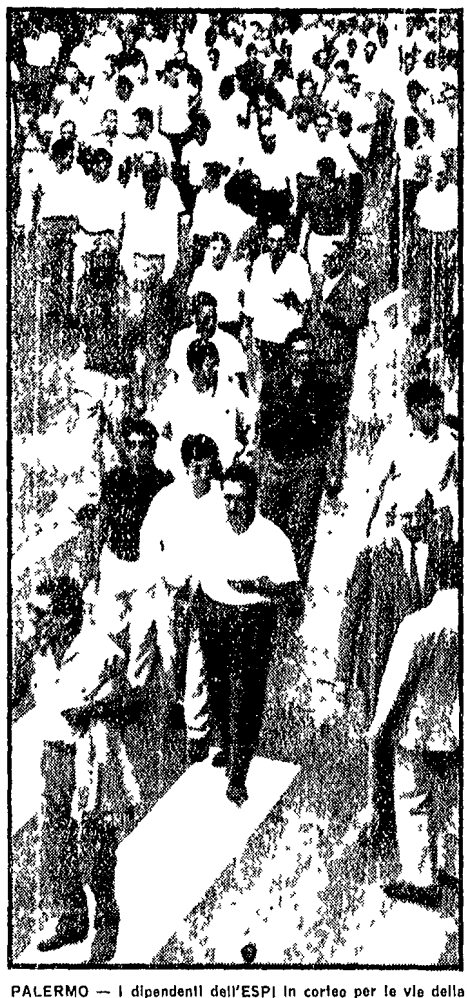
PALERMO — I dipendenti dell'ESPI in corteo per la via della città