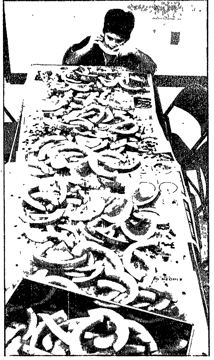
SPUTA SEMI A M. 8,56. Un altro sport è nato negli Stati Uniti. Si è svolto infatti il primo campionato annuale di «divoratori di cocomeri e lanciatori di semi». Peter Crawford si è aggiudicato la prima categoria «velocità» divorando un voluminoso cocomero nel tempo record di 50 secondi e due decimi. Per la categoria «lanciatori di semi» ha invece sfornato il quindicenne Craig Jones, che ha sbaragliato tutti i concorrenti spalandone semi d'anguria a una distanza di otto metri e 56 centimetri. Nell'foto un allenamento per le eliminatorie a Dubuque (Iowa). Il ragazzo della foto è rimasto ultimo in graduatoria, con appena 14 fette mangiate.

domani continueranno a vedersi di nascosto per una settimana. Intanto il Vicescudiero (fratello del sequestrato) ha chiesto il sequestro di suo fratello. Il sequestro è avvenuto il 17 settembre scorso in un appartamento in viale della Repubblica di viale della Repubblica. I genitori al centro dell'osservazione dei giudici di Palermo sono stati informati che il loro figlio ha rubato un formaggio di un chilo e mezzo. Il piccolo è stato rinchiuso nel carcere di minoranza per nove giorni. I genitori hanno chiesto che il loro figlio venga rilasciato e che gli venga restituito il formaggio rubato.