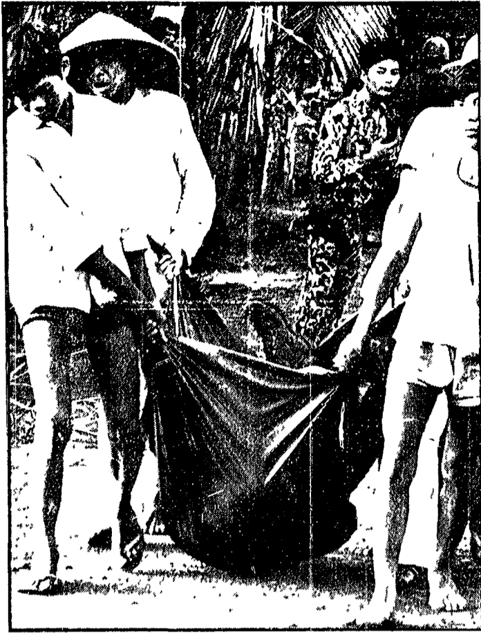
SAIGON Dopo la battaglia che è infuriata nei giorni scorsi a Tay Ninh. Quattro civili sud vietnamiti trasportano con mezzi di fortuna il corpo di una persona rimasta uccisa durante i combattimenti