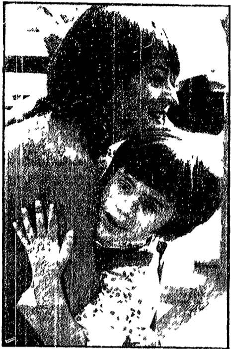
Una gradita visita a sorpresa per Annie Girardot sul set del film «Melli, una sera a cena» su figlia Giulia è venuta a trovarla e merita bene un abbraccio riconoscente

La compagnia di «Zio Vania» ha trovato asilo al «Centrale» di Roma... Dal 30 al «Centrale» di Roma «Zio Vania» ha trovato asilo.