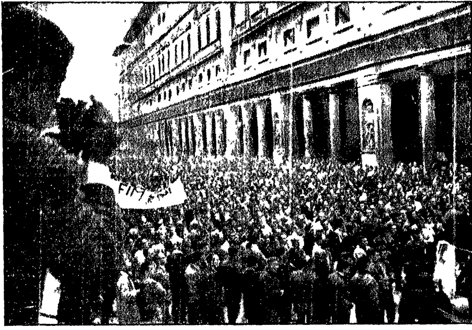
Ieri in Palazzo Vecchio