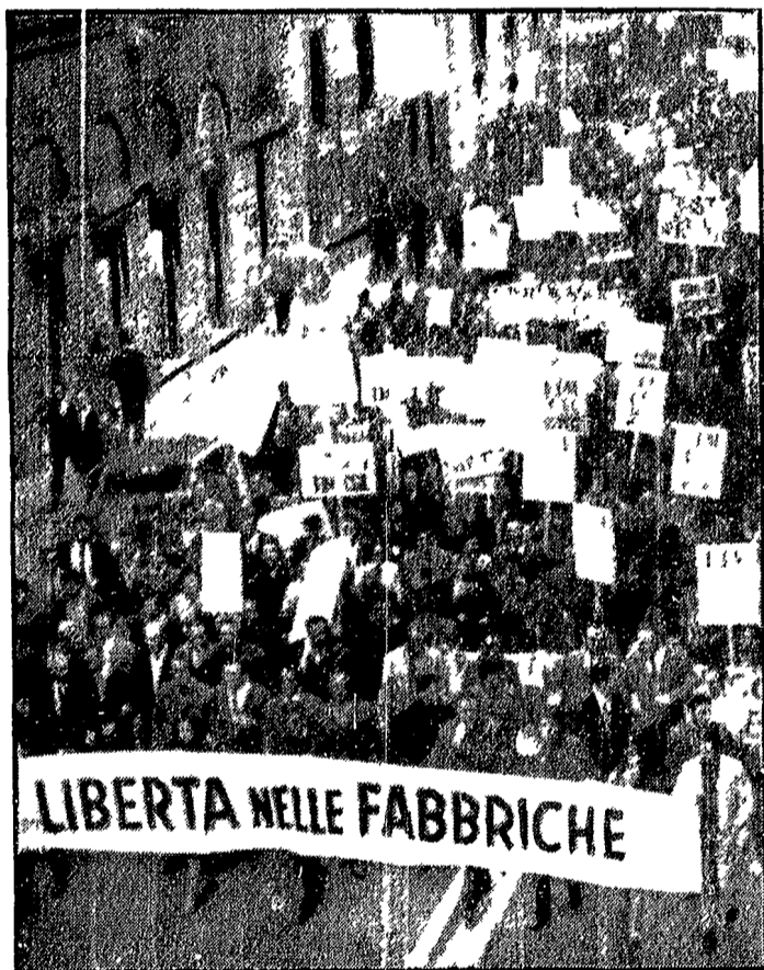
FIRENZE — Migliaia di metallurgici fiorentini hanno abbandonato ieri le fabbriche bloccando completamente l'attività produttiva. In corteo hanno attraversato il centro della città fino agli Uffici dove si è svolto un comizio con i dirigenti della FIOM CGIL, FIM CILS e UILM. Lo sciopero, che è stato proclamato per solidarietà con i lavoratori della Pasquali e della Targemil che si stanno battendo contro il tentativo dei padroni di limitare ogni contrattazione economica e normativa, è riuscito in maniera compatta nelle aziende di Firenze, Calenzano, Sesto Fiorentino, Scandicci, Bagno a Ripoli e Fiesole. Nella telefoto i metallurgici si stanno dirigendo agli Uffici.

Nelle relazioni del «leaders» delle cinque correnti che hanno occupato l'intera giornata del congresso socialista vi è stato un tema obbligato il confronto diretto con il discorso di quasi dogmatica chiarezza pronunciato da Pietro Nenni in apertura dei lavori. Pur entro i limiti consentiti dall'attuale situazione di frazionamento politico e organizzativo del partito, era un tema che il discorso si riaprse e che a fianco delle vecchie riaffermazioni e delle ripetizioni di formule comparivano anche una tematica politica più ricca e articolata.