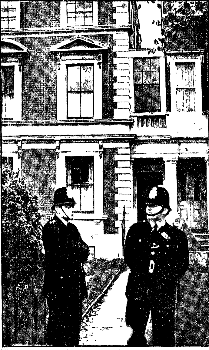
LONDRA - I poliziotti sorvegliano l'ingresso dell'ostello dove la donna è stata assassinata