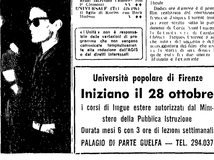
«Unità» non è responsabile delle variazioni di programma... «Isola» è un film sulla libertà della donna.

A quanto si riferisce negli ambienti lirici di Bilbao Maria Callas avrebbe firmato un contratto con l'Associazione bilbao di amici dell'opera... «Isola» è un film sulla libertà della donna.