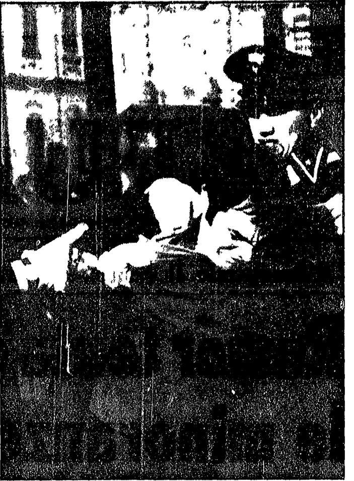
TORINO - Gli studenti che ieri mattina partecipavano in diecimila alla manifestazione per il diritto d'ascolto sono stati selvaggiamente caricati dai poliziotti davanti al Castello del Valentino. Nella foto un giovane malmenato dagli agenti

Sciopero in tutte le scuole a Torino, Pisa, Livorno, Cagliari