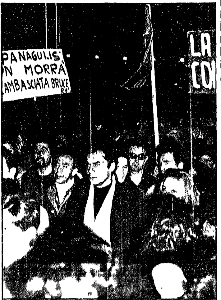
Per ore ed ore migliaia di giovani di parlamentari, di intellettuali, di operai, di sindacalisti hanno protestato nelle vie di Roma contro l'infame sentenza dei colonnelli fascisti, chiedendo la salvezza dell'eroe greco Panagulis. E stata una manifestazione imponente e appassionata che la polizia ha aggredito proditoriamente e brutalmente. Proprio sotto l'ambasciata greca i carabinieri e i carabinieri si sono resi responsabili di violenze gravissime, hanno bastonato, colpito con catenelle, ferri e bandoliere donne, ragazzi vecchi, invalidi, anche passanti. Nella foto Gian Maria Volontè ripreso in mezzo alla folla dei manifestanti