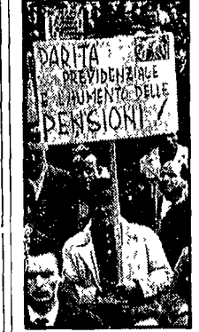
A pagina 3

Lo stesso De Martino ha avuto ieri mattina un colloquio di oltre un'ora col segretario del PSI Ferri, che avrebbe offerto alla corrente dc « Riscossa socialista » la vicepresidenza del Consiglio nel futuro governo, una carica di vice-segretario del partito, di fianco a Cariglia, la direzione dell'Avanti! e la presidenza di uno dei due gruppi parlamentari. De Martino come vice-presidente del Consiglio dovrebbe consegnare la delegazione del PSI nel governo e farne un'importante parte — questo è un nuovo congegno dell'«organigramma» di un ufficio di segreteria, assieme a Ferri, ai due vice-segretari ed al presidente del partito Nenni. Questa combinazione sembra sostanzialmente coincidente con le ultime propo-