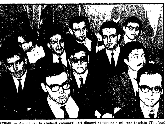
ATENE — Alcuni dei 16 studenti comparso ieri dinanzi al tribunale militare fascista (Telefoto)

Sarà fucilato stamattina o vi sarà un rinvio? - Silenzio assoluto della radio e della stampa — Iniziato ieri un nuovo mostruoso processo contro sedici studenti