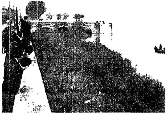
Sono proseguite nella giornata di ieri da parte dei vigili del fuoco le ricerche del bambino che sarebbe stato gettato in Arno...