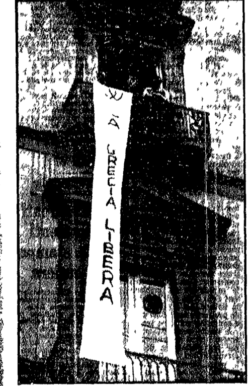
NAPOLI — Una striscione che inneggia alla libertà della Grecia pende da uno dei balconi del palazzo del Comune.

A ROMA il Sindacato degli avvocati e procuratori riuniti in assemblea al Palazzo di Giustizia ha osservato due minuti di sospensione per protesta contro la condanna a morte di Panagulis.