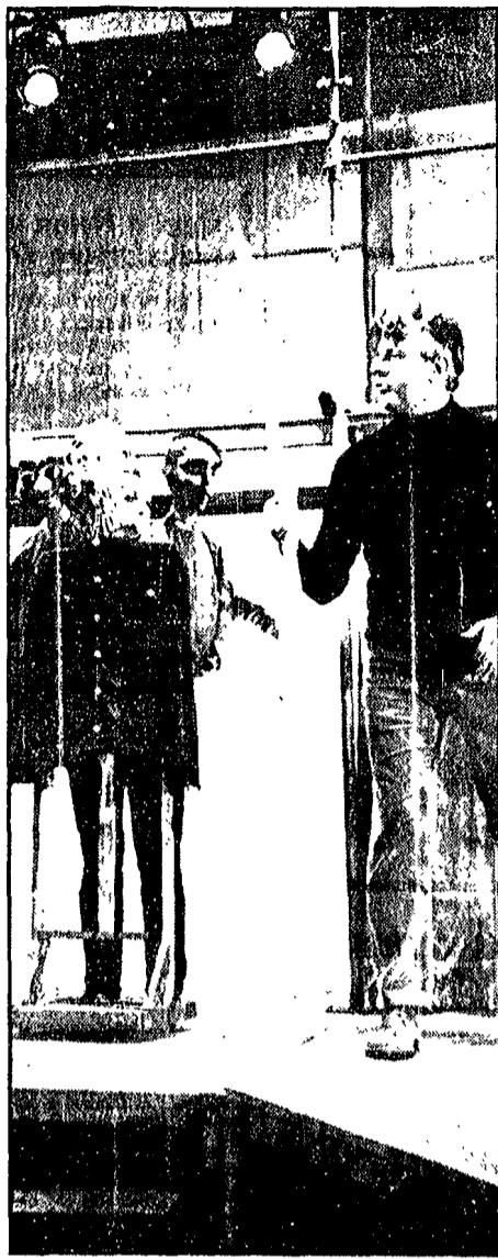
Dario Fo impegnato in una scena dello spettacolo