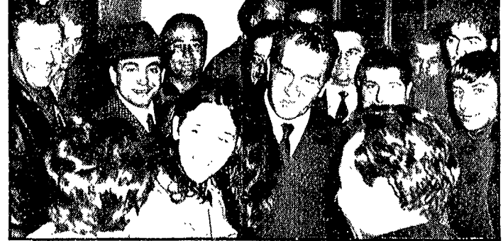
APRILIA - Il compagno Ingrao a colloquio con gli operai che occupano la Cusmano

Per i padroni, per lo Stato la fabbrica ha solo funzioni speculative, di profitto, mentre per i lavoratori la fabbrica ha una funzione pienamente sociale. Quando un padrone caparbio come Cusmano decide di puntare in bianco di chiudere lo stabilimento, mette sul piedistallo 120 lavoratori facendo diventare il suo gesto un fatto sociale. Ma Portoghesi ha detto anche di più: ha dimostrato l'unità della classe operaia del padrone e della fabbrica. In questi giorni di occupazione - ha detto - la produzione è proseguita regolarmente, anche senza la presenza del dott. Cusmano. Il padrone e il giovane lavoratore di Aprilia e di Cisterna e poi proseguito a notte fonda, nella fabbrica occupata dal padrone e dal giovane lavoratore di Aprilia e di Cisterna, hanno deciso di occupare la fabbrica per difendere il posto di lavoro. Anche qui è emersa in modo lampante il contrasto di interpretazione sulla funzione della fabbrica.