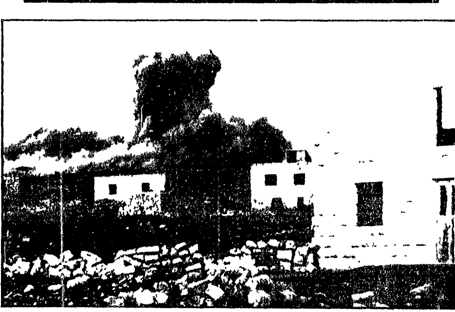
TEL AVIV 29