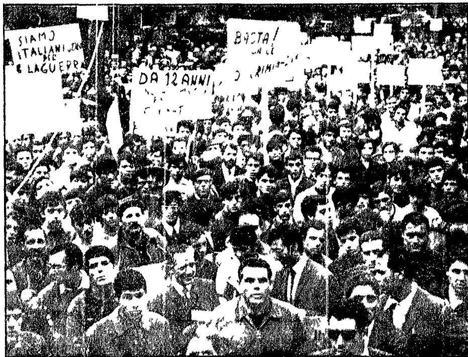
CAGLIARI Una veduta parziale del grande comizio di piazza Carmine a Cagliari dove hanno parlato gli oratori della CGIL, CISL e UIL. Successivamente un imponente corteo si è formato, attraversando le strade del centro cittadino e bloccando il traffico per alcune ore.

VIETNAM Durante l'offensiva del 1968 nella capitale hanoi i due guerriglieri hanno tenuto in scacco un intero battaglione di marines. STATI UNITI Su un quotidiano di Chicago è apparso quest'annuncio: «C'è una bambina bianca» che cosa sta cambiando nelle famiglie americane nelle quali da secoli la servitù è negra? INGHILTERRA Da Londra un'impresa «Oliv» il film che «Croll» Reed dedica a tutti i bambini del mondo. ITALIA Che cosa farà da grande? Ecco l'amara risposta delle ragazze di Ravenna. La disoccupazione invecchia fra le ventenni arrabbiate. I mutuali della Capitale dicono il mio medico della mutua si comporta come Alberto Sordi.