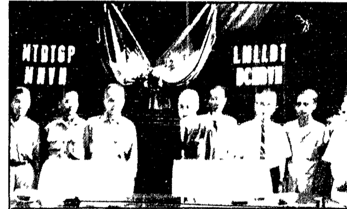
VIETNAM DEL SUD — Un incontro tra una delegazione del Comitato centrale del Fronte nazionale di liberazione e una del Comitato centrale dell'Alleanza delle forze nazionali democratiche e di pace del Sud Vietnam si è svolto nelle zone libere nei primi giorni di novembre. Dello stato di guerra è responsabile questo documento fotografico, che mostra, al centro, il presidente del FNL Nguyen Huu Thoi (in divisa chiara) e il presidente dell'Alleanza Trinh Dinh Thoi (in abito civile scuro)

I fantocci di Saigon discutono l'intensificazione della repressione — Decimata una compagnia americana dal FNL. Improvviso e grandissimo sviluppo della guerriglia in Thailandia — Dichiarazioni di Clifford sulle trattative di Parigi