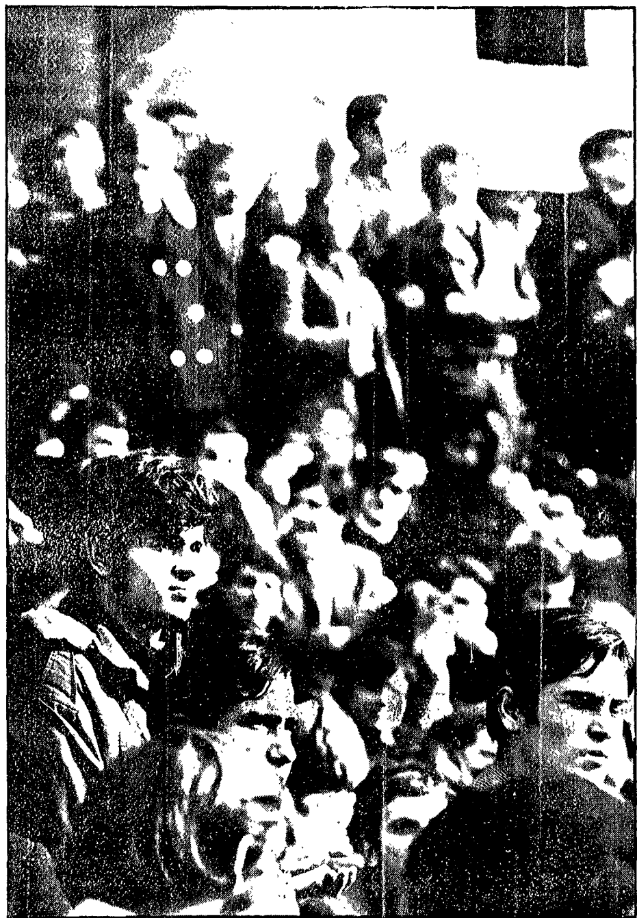
Un'assemblea degli studenti liceali e tecnici all'Ateneo di Roma

Le esperienze dello scontro con la polizia - I tecnici: la scuola si preoccupa solo di « allenarci » per la fabbrica - Tentativi per dividere liceali e giovani di altri istituti - Una classe deserta davanti ad un professore autoritario - « La battaglia è appena agli inizi »