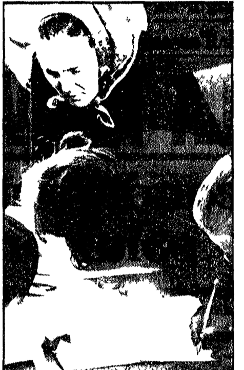
FIRENZE - Abitanti dell'isolotto firmano la petizione con la quale si chiedono le dimissioni del cardinale Florit