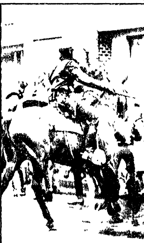
SAN FRANCISCO — Contro gli studenti che manifestano è stata scagliata la polizia a cavallo