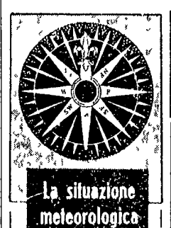
La situazione meteorologica

L'autore del colpo record e giapponese — Una garza sul viso contro il raffreddore — Il denaro era destinato alla tredicesima degli operai