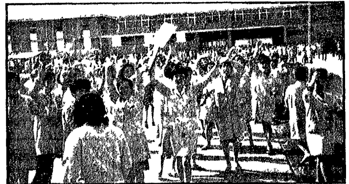
Dal nostro corrispondente

Le operai della Lebole Euroconf sono scesi in sciopero ieri e oggi per due ore e per la quinta volta nel giro di due settimane. Stanno riunendo in assemblea il primo decimo della produzione. Le richieste sono: un aumento del 10 per cento della retribuzione, la riduzione dell'orario di lavoro a 40 ore settimanali, la garanzia del posto di lavoro, la creazione di nuovi posti di lavoro, il controllo e la gestione della fabbrica, la garanzia di un salario adeguato, la garanzia di un posto di lavoro, la garanzia di un salario adeguato, la garanzia di un posto di lavoro, la garanzia di un salario adeguato.