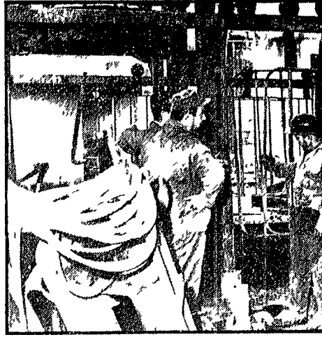
ALIVERI — Sette morti e 21 feriti, di cui 12 gravi, sono il bilancio di una tragedia in miniera, avvenuta ieri sera in Grecia, nell'isola di Eubea. Causa del sinistro pare sia stata una carica di dinamite difettosa, che ha fatto saltare 200 chilogrammi di esplosivo che si trovava nella miniera.