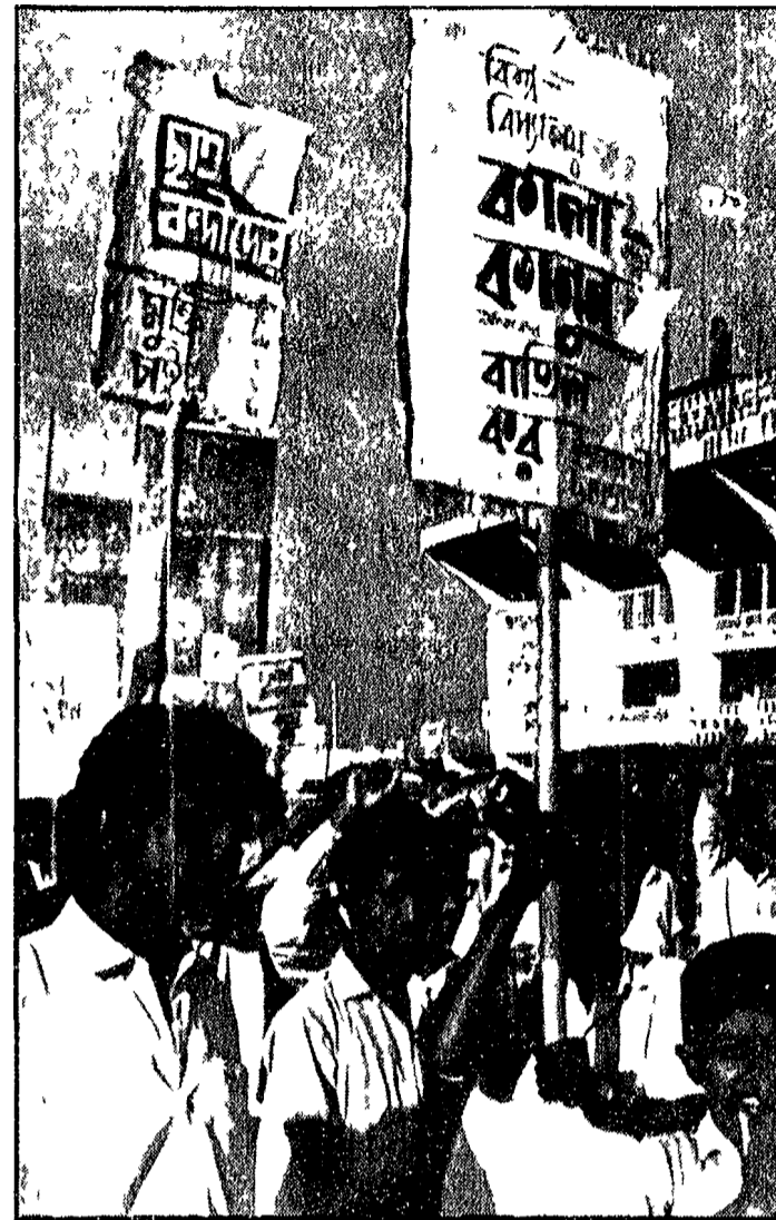
GLI STUDENTI DI DACCA (Pakistan orientale) durante le manifestazioni di protesta contro il regime autoritario di Ayub Khan

LA VENEZUELA Caldera senza maggioranza Affermazione dei comunisti nelle elezioni del parlamento