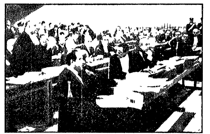
L'AQUILA — Una veduta generale dell'aula ove si svolge il processo per la strage del Vajont

Il legale dell'ente elettrico nega il diritto dello Stato al risarcimento — Sottili disquisizioni giuridiche — Il profitto dei privati non si tocca