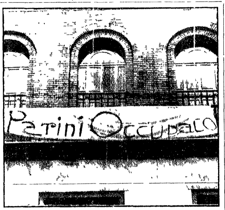
MILANO - Ancora una volta la polizia è intervenuta a sgomberare il «Parini» gli studenti sono stati costretti ad abbandonare i locali...