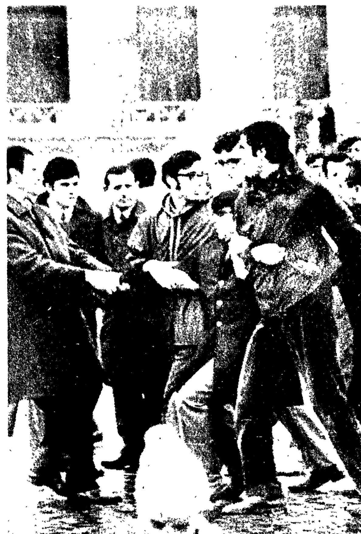
ROMA — I giovani esponenti del «dissenso cattolico» hanno protestato ieri, nella basilica di San Pietro, contro la presenza di Nixon in Vaticano. NELLA FOTO: i giovani duramente allontanati da agenti in borghese