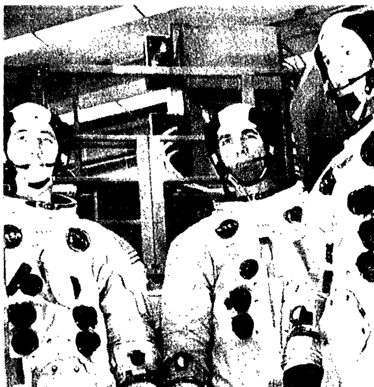
NELLA FOTO: L'equipaggio dell'«Apollo 9». Da sinistra: James Mac Divitt, David Scott e Russell Schweickart.

WASHINGTON, 2 marzo. Sarebbe un'impresa inimmaginabile, domani, lunedì 3 marzo, da Cape Kennedy, alle 11 precise (17 italiane), partire con il suo carico umano (i due colonnelli della aviazione Mac Divitt e David Scott) e lo scienziato civile Russell Schweickart) il gigantesco «Saturno 5» per dar vita alla più complessa e forse più pericolosa impresa spaziale americana, quella dell'«Apollo 9», la impresa cioè che dovrebbe costituire la prova generale dello sbarco dell'uomo sulla Luna.