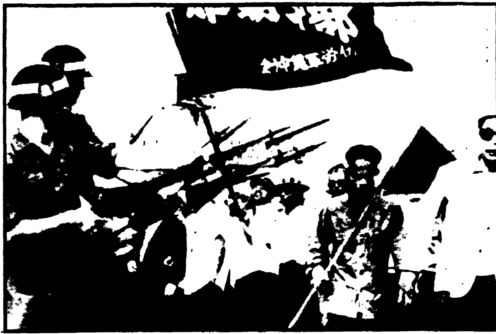
OKINAWA — La lotta della popolazione di quest'isola del Pacifico, terra giapponese, di cui gli USA si sono appropriati per trasformarla in una enorme base aeronavale, si intensifica ogni giorno. Gli isolani chiedono che gli americani vadano via, ma il governo di Washington risponde con le balotterie. Gli scacco fra gli abitanti e i graditi della base USA sono sempre più frequenti e cruenti. Nella telefoto: una manifestazione presso la base. Parecchi dimostranti sono stati feriti dagli occupanti americani.

Oggi inoltre si terrà a Roma un'assemblea generale del personale direttivo e dei direttori e non insegnante promossa dall'Intesa intersindacale.