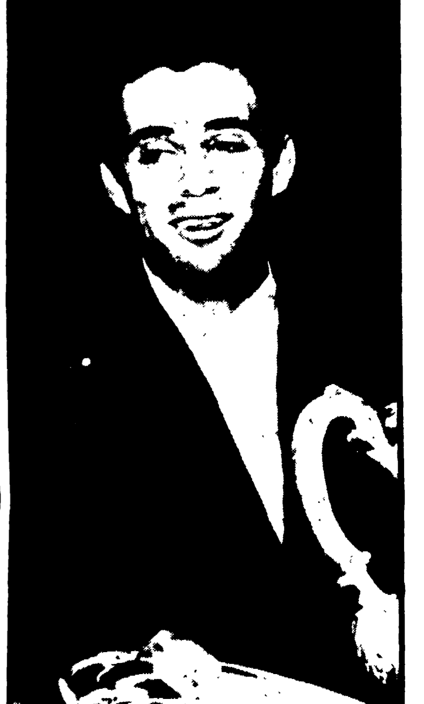
CITTA' DEL MESSICO — Non ci sono superstiti fra i rottami dell'aereo delle linee nazionali messicane precipitato alle pendici del monte El Fraile, con 79 persone a bordo. Piccoli aerei di soccorso hanno sorvolato la zona della sciagura e i piloti hanno rilevato come del grande jet in servizio fra Città del Messico a Monterrey, non siano rimasti interi che pochi pezzi sparsi lungo la bosaglia. A bordo del velivolo viaggiavano l'asso del tennis messicano Rafael Osuna, protagonista della clamorosa vittoria messicana in Coppa Davis sull'Australia il mese scorso e alcune autorità politiche e militari. L'aereo precipitato era giunto nei pressi di Monterrey mentre infuriava una tempesta per cui era stato fatto deviare. Da quel momento, il pilota non si era fatto più sentire per radio. Squadre di soccorso sono già partite da diverse zone, ma giungeranno sul luogo della sciagura solo fra alcune ore. Nella telefoto: il campione di tennis Osuna morto nella sciagura aerea.