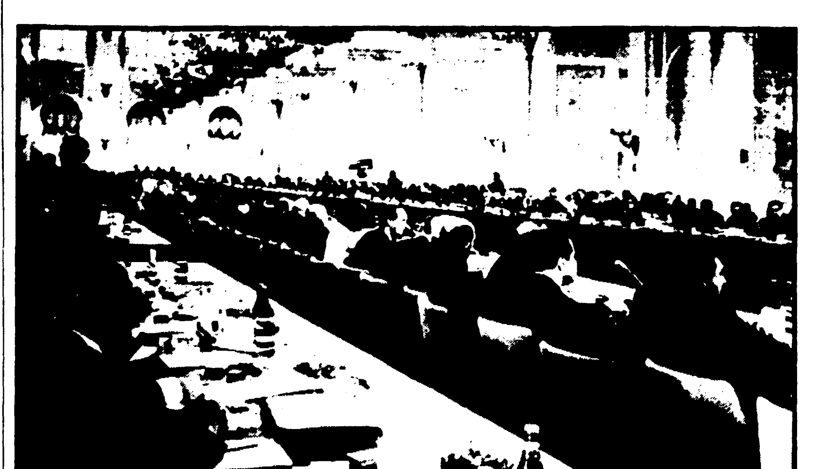
MOSCA — Una veduta panoramica della sala ove si svolgono i lavori della conferenza dei partiti comunisti e operai