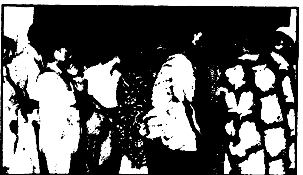
Lagos — Civili nigeriani trasportano nella cattedrale le bare dei tecnici italiani. Telefoto

La liberazione nelle prime ore della notte. A Libreville nel Gabon era ad attenderli un aereo Riserbo sulle contropartite chieste dai biafrani