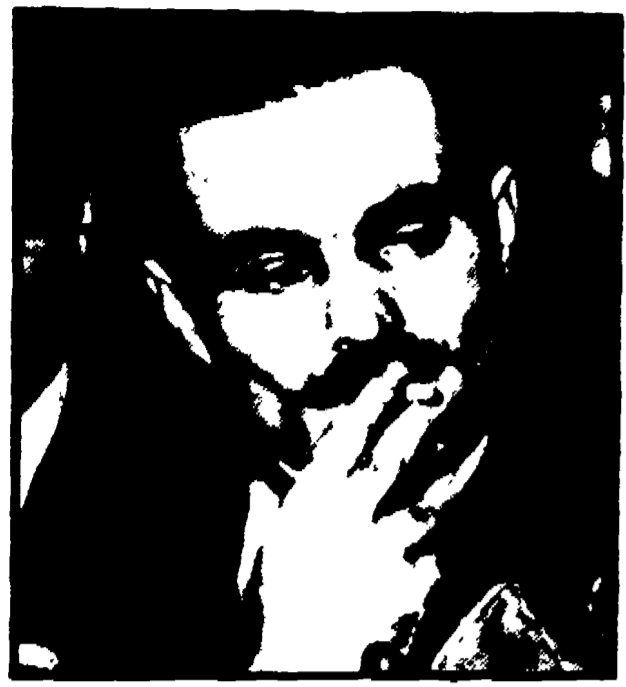
Le notizie dell'evasione del valoroso combattente antifascista - condannato a morte dai coloniali - ha suscitato un'enorme emozione in tutta la Grecia. Una caccia spietata sarebbe in corso in tutto il paese. A PAGINA 6