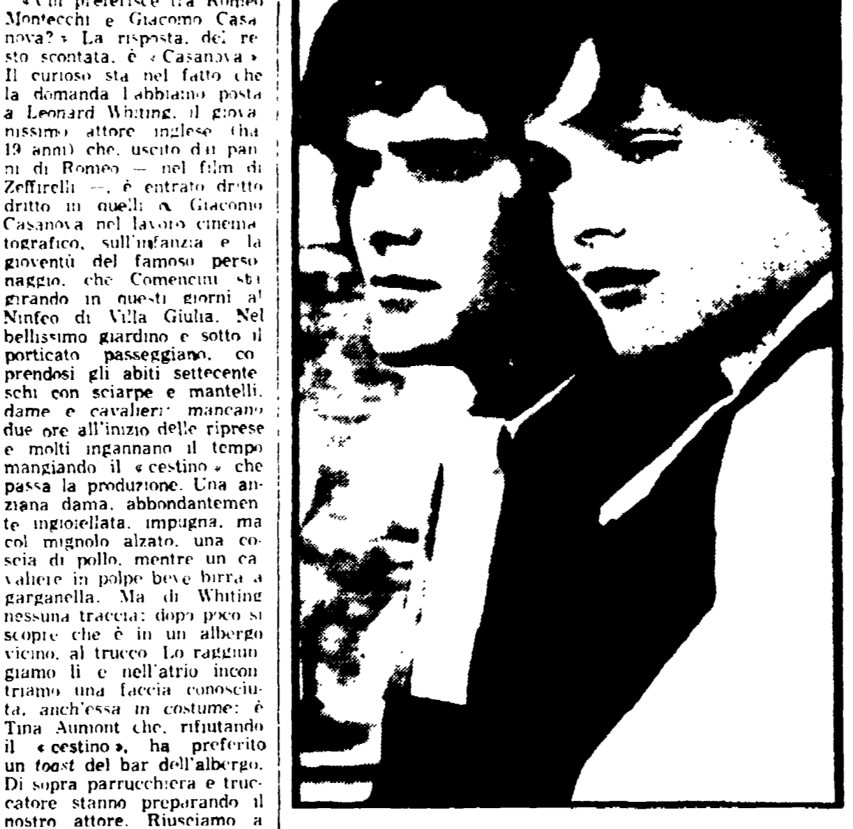
Sullo schermo « Nido di nobili »

Un « set » cosparso di cestini - il giovane attore ha progetti anche troppo ambiziosi