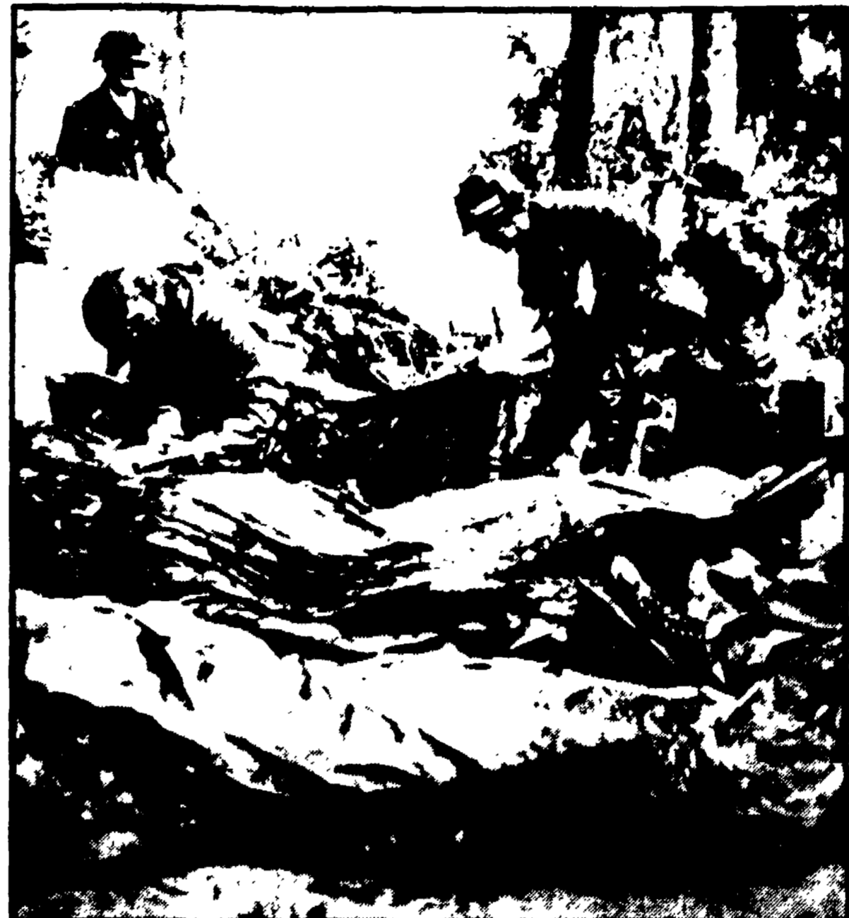
Massicci attacchi del FNL. Il Fronte nazionale di liberazione sud-vietnamita ha mosso la notte scorsa un attacco coordinato a oltre cento basi militari degli Stati Uniti e delle forze collaborazioniste sull'intero territorio sud-vietnamita. Tra gli obiettivi attaccati è la grande base di Tan Son Nhut, all'imbocco della quale è stato fatto saltare un grande deposito di munizioni. Nella foto: reparti della 101 divisione americana impegnati a mimetizzare le loro posizioni per sfuggire ai razzi e ai mortai del FNL. A PAGINA 14