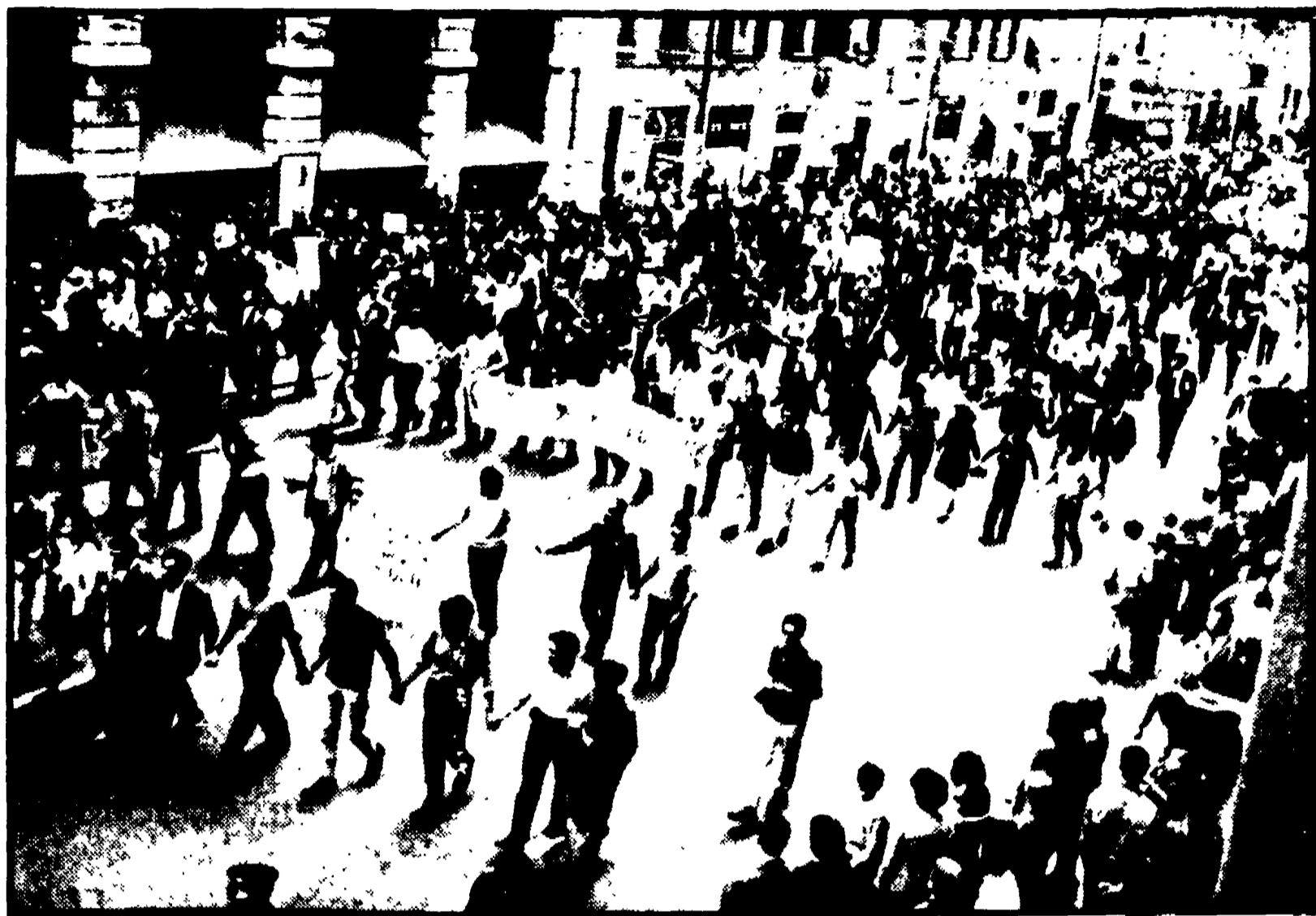
GENOVA - Una manifestazione di studenti e operai contro la « scuola dei padroni »

Uno strumento che, nonostante le modifiche, resta funzionale a una scuola socialmente selettiva e ideologicamente conformista - A colloquio con gli studenti di Genova