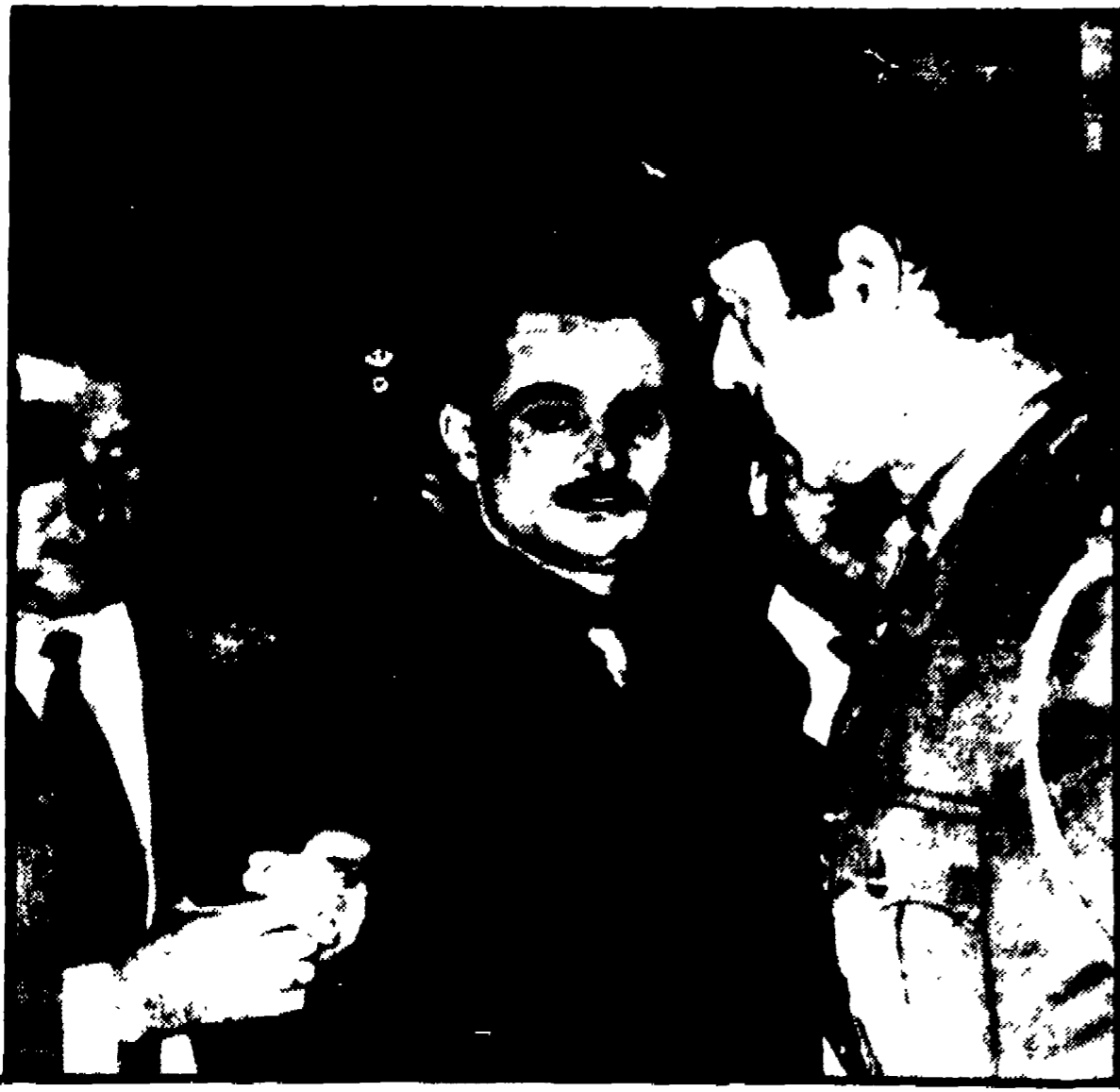
Durante il processo, Panagulis non venne mai lasciato solo, fu tenuto sempre stretto tra due poliziotti, come mostra la foto.