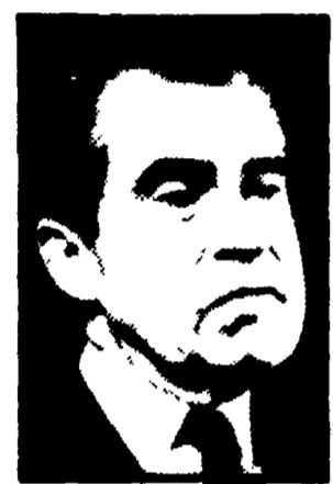
NIXON. Dieci giorni disastrosi.