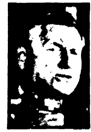
NELSON ROCKEFELLER. L'uomo adatte.