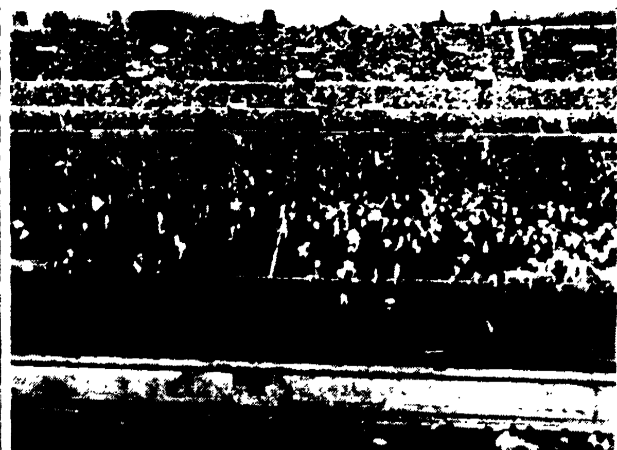
ROMA — Ecco lo scenario suggestivo che presentava ieri lo stadio Olimpico alle ore 18.45. Finita la partita Lazio-Rapenna, ultima del campionato di Serie B, i tifosi laziali hanno invaso il campo «pacificamente» per portare in trionfo i propri beniamini, promossi in Serie A. Analoghi spettacoli si sono avuti a Brescia e a Monza. In quest'ultima città sono stati i tifosi ospiti — quelli del Bari — ad inscenare pittoresche manifestazioni di giubilo