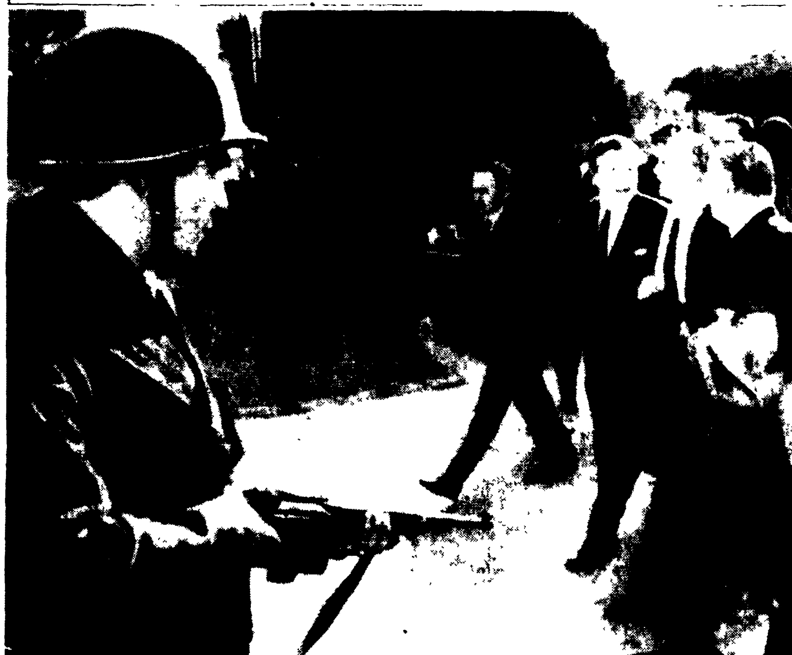
PUNTA DEL ESTE - L'invitato di Nixon, il governatore di New York Nelson Rockefeller, è sceso dall'aereo a Punta del Este immediatamente un rigido dispositivo di sicurezza è scattato il poliziotto che si vede in primo piano e soltanto un elemento Rockefeller dopo il suo colloquio con il Presidente uruguayano Pacheco Arco (nella telefoto ANSA accanto a lui) e rientrato a New York.