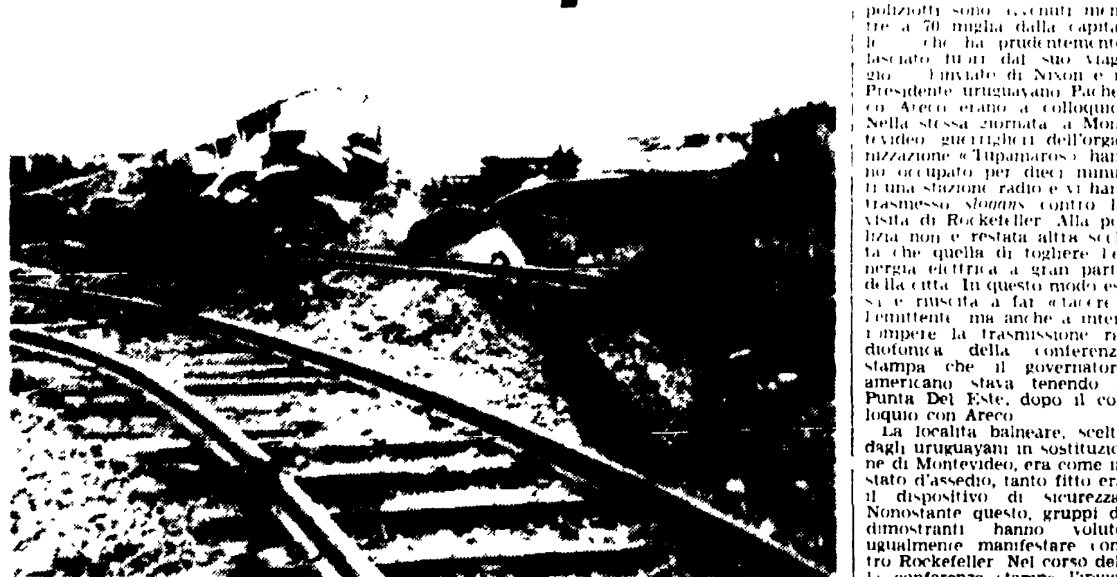
HANNOVER - Un treno carico di munizioni per la Bundeswehr è esploso ieri mattina poco dopo le 8 nei pressi di Linden. Secondo una prima valutazione le vittime sono almeno undici ma l'opera di soccorso non è ancora terminata, e il bilancio della sciagura può quindi rivelarsi anche più grave. Nella telefoto i binari divelti dalla puerosa esplosione. In secondo piano ciò che è restato di uno dei vagoni esplosi. (A PAGINA 5)