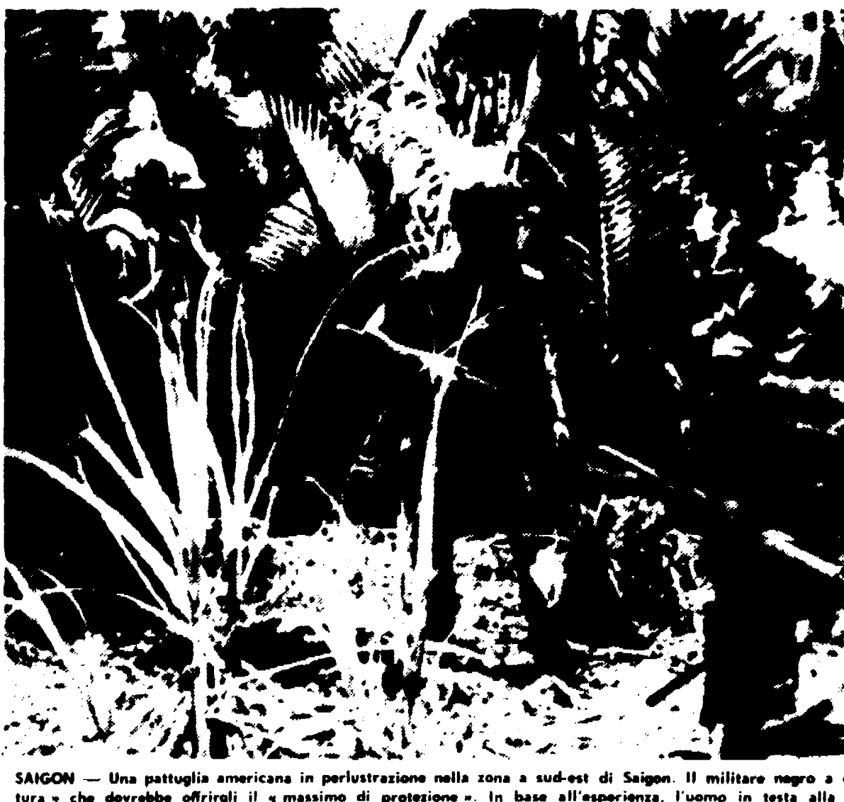
SAIGON - Una pattuglia americana in perlustrazione nella zona a sud-est di Saigon. Il militare negro a destra indossa una speciale «armatura» che dovrebbe offrirgli il massimo di protezione. In base all'esperienza, l'uomo in testa alla pattuglia, infatti, è il più soggetto ad essere colpito.

SAIGON, 22 giugno Il portavoce del comando supremo americano, nella quotidiana conferenza stampa, ha accolto i giornalisti con questo brevissimo comunicato: «Oggi, nulla da segnalare sui fronti di guerra». Di contro, l'agenzia AP annuncia 25 attacchi contro altrettante basi americane e fantocce, di cui sei «importanti», cioè con gravi perdite per i superstiti. Otto americani, inoltre, sono rimasti uccisi e cinque feriti in seguito all'abbattimento, da parte del FNL, di un elicottero. Si tratta del 1.189 elicottero di cui gli USA ammettono la perdita.