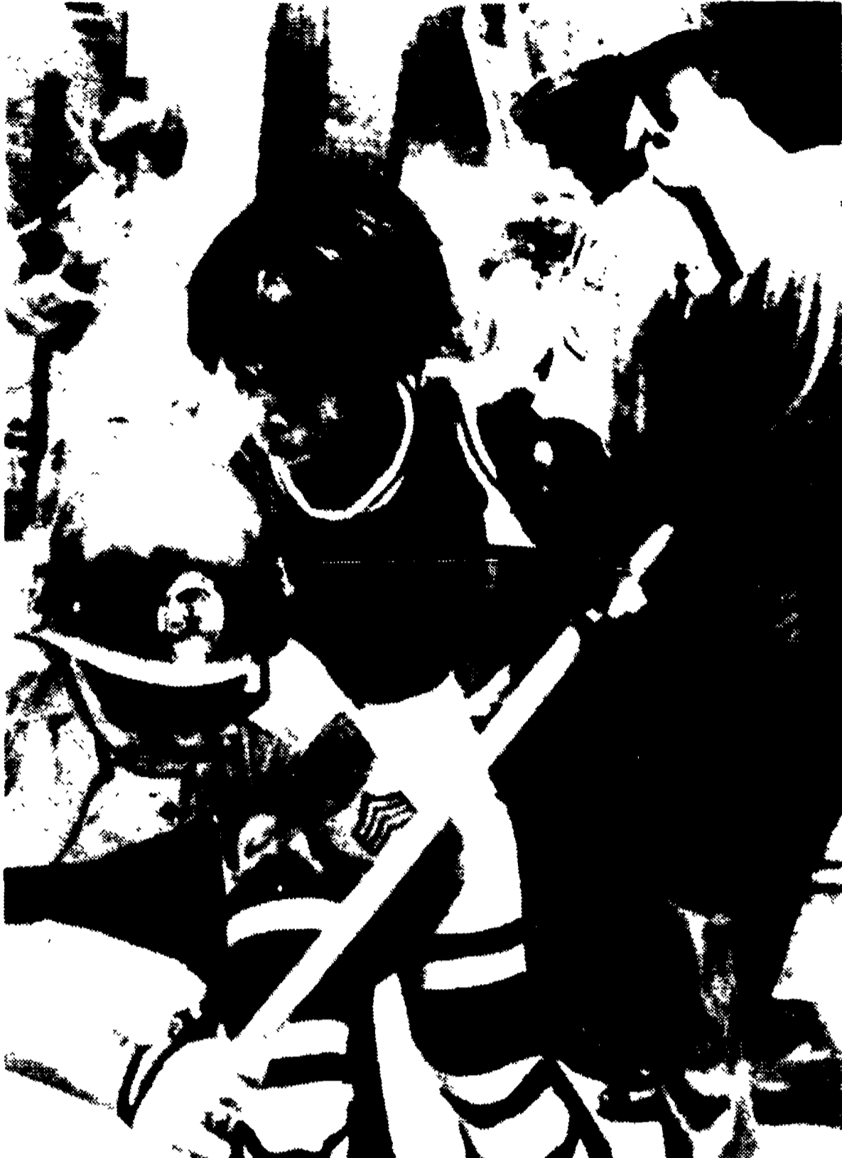
CHARLESTON (Carolina del Sud) - La polizia arresta un giovane che partecipava ad una dimostrazione di sostegno ai dipendenti dell'ospedale in sciopero da tre mesi per ottenere il riconoscimento del loro sindacato. Nel corso della manifestazione è stato arrestato anche il pastore Ralph Abernathy, successore di Martin Luther King alla testa della lega dei dirigenti cristiani del Sudafrica, leader del movimento pacifista negro contro la segregazione.