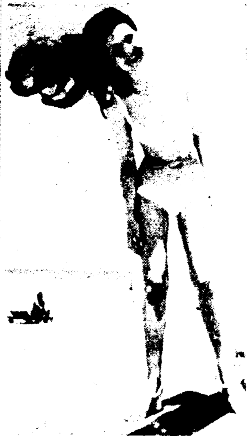
MIAMI BEACH — Diana Coccorese, la miss Italia che partecipa al concorso per miss Universo...