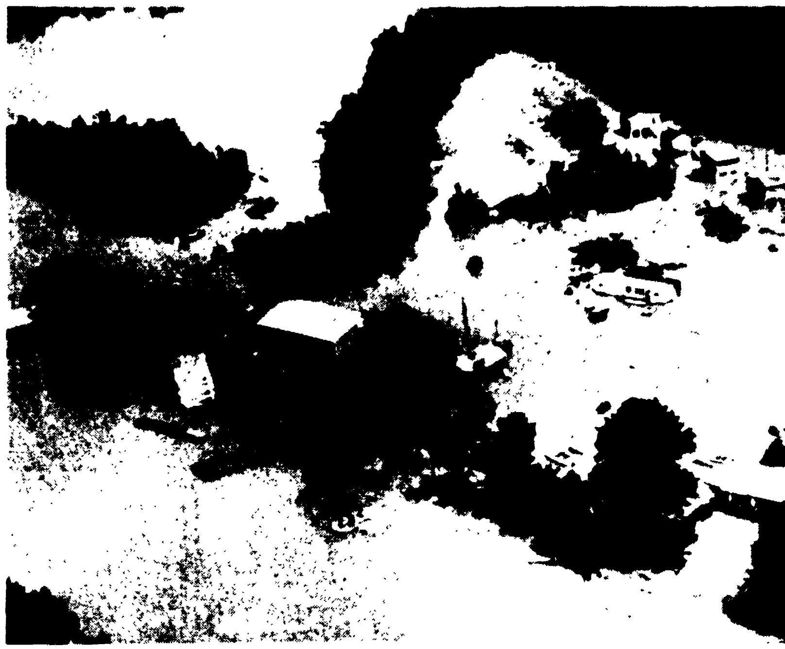
STRARIPA IL MISSISSIPPI. Pesanti piogge hanno gonfiato i fiumi Mississippi e Missouri, le cui acque hanno raggiunto il livello più alto dal 1951. In alcune località i fiumi sono straripati provocando estesi allagamenti. le case di Grafton, nell'Illinois, circondate dalle acque

Si fanno sempre più insistenti a Madrid le voci secondo le quali il dittatore Franco sarebbe in procinto di designare ufficialmente il principe Juan Carlos di Borbone quale suo successore. Voci in questo senso sono state riportate dalla stampa spagnola, secondo la quale la designazione avverrebbe all'indomani, cioè il 14 luglio, in una cerimonia solenne, davanti alle Cortes, riunite in sessione plenaria. Dello stesso avviso si sono anche i circoli politici della capitale. I presunti di una designazione ufficiale mercoledì prossimo si è consolidata sem-