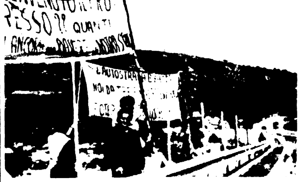
SANREMO — Ieri è stato aperto al traffico il tratto di autostrada che collega l'Italia alla Francia. 23 chilometri di Bordighera a Roquebrune...