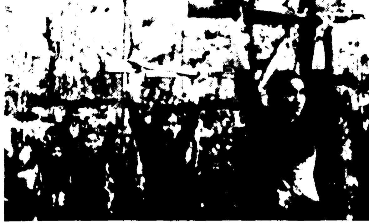
«VIETNAMIZZARE» LA GUERRA? — E' questo il sogno degli Stati Uniti. Ma i vietnamiti la guerra di liberazione l'hanno «vietnamizzata» fin dall'inizio. Ecco, nella foto distribuita dall'agenzia Libération, un reparto di donne appartenenti all'Esercito di liberazione, in una fase dell'addestramento. La foto è stata scattata nel delta del Mekong.

inteso esprimere solo una speranza, e non l'assoluta certezza di poterla realizzare. Nonostante l'asprezza della polemica, le posizioni di Clifford e di Nixon avevano un punto in comune: esse si incontravano nella esigenza comune di «vietnamizzare» la guerra, ed è qui che, come si dice, c'è da insidiare il pericolo di un'aggressione americana, naturalmente sempre col massimo aiuto degli Stati Uniti. Significa mantenere immutato l'obiettivo di fondo, che aveva portato all'intervento diretto degli Stati Uniti nella guerra, cioè voler aumentare al potere un regime fantoccia, pro-americano, ubbidiente e servile, le tenere d'occhio un Paese che vuole invece essere libero, indipendente, e non quella di un Presidente responsabile, ed un portavoce ufficiale si affrettò a precisare che Nixon aveva