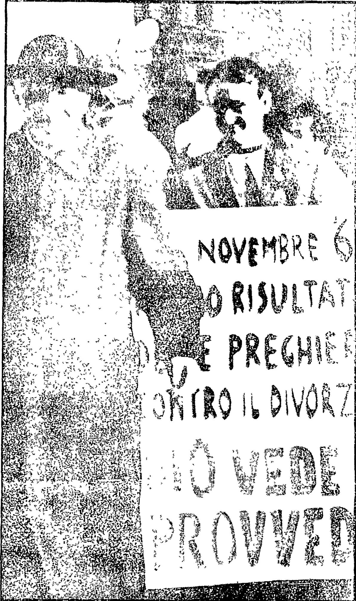
Davanti alla Camera dei deputati un gruppo di divorzisti manifesta silenziosamente e minuziosamente, da quando è ripresa la discussione sulla legge per il divorzio. Sono uomini, donne e ragazzi che cartelli polemici ed espliciti li fotografano con il passaggio tra loro di un sacerdote, che appare più divertito «alla manifestazione che non scandalizzato. Chi ha paura del divorzio? Lui no, così almeno sembra documentare questa spontanea immagine

La prima proposta di legge nel 1874 - Le ragioni politiche dell'opposizione cattolica - Il fascismo permise nelle colonie lo scioglimento del matrimonio - Come hanno camminato le idee, per una famiglia senza autoritarismi - Libertà di coscienza e libertà di scelte