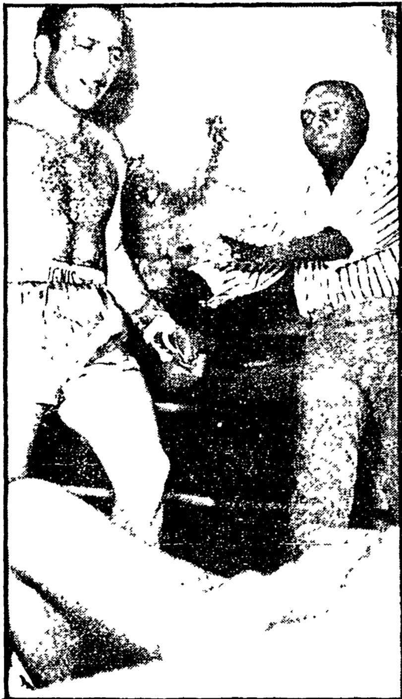
L'epilogo di Mazzinghi Hernandez. Sandro osserva l'avversario messo K.O. con un sorriso alla testa

Dopo la vittoria si è parlato di un match con Little che potrebbe svolgersi a maggio a Milano (senza titolo in palio)