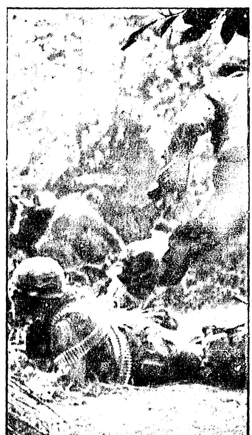
QUANG NGAI - Un reparto della divisione « Americal » durante un rastrellamento nei pressi di un villaggio nella regione di Quang Ngai e stato preso dal fuoco di mordi del FNL. I soldati cercano scampo.

La pena di morte è definitivamente abolita in Germania. La Camera dei lord, dopo il Consiglio del governo con il quale aveva approvato la mozione del governo, ha approvato la mozione di abolizione della pena di morte per tutti i reati.