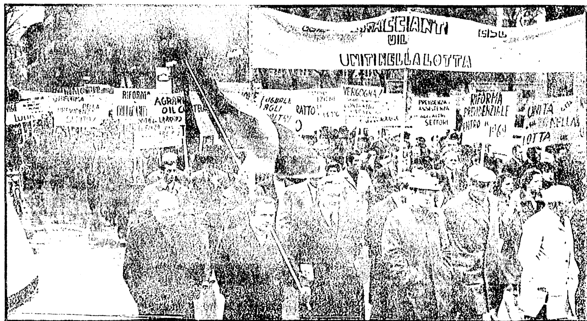
FIRENZE - Un momento della grande manifestazione dei braccianti che ha avuto luogo ieri nel capoluogo toscano

FIOM-FIM-UILM: « Proseguire senza interruzioni nell'attuazione del programma di scioperi fino alla conclusione del contratto e alla verifica da parte dei lavoratori »