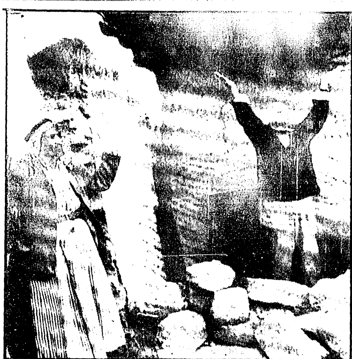
AMMAN - L'artiglieria israeliana ha sferrato un attacco, sulle colline del Golan, distruggendo un villaggio giordano. Ecco, nella foto, due contadini giordani che alzano le mani verso il cielo in segno di disperazione

Ieri sera la Camera del Popolo della Germania democratica aveva dato mandato al capo dello Stato e al governo di « intraprendere tutti i passi necessari per normalizzare i rapporti fra la RFT e la RDT »