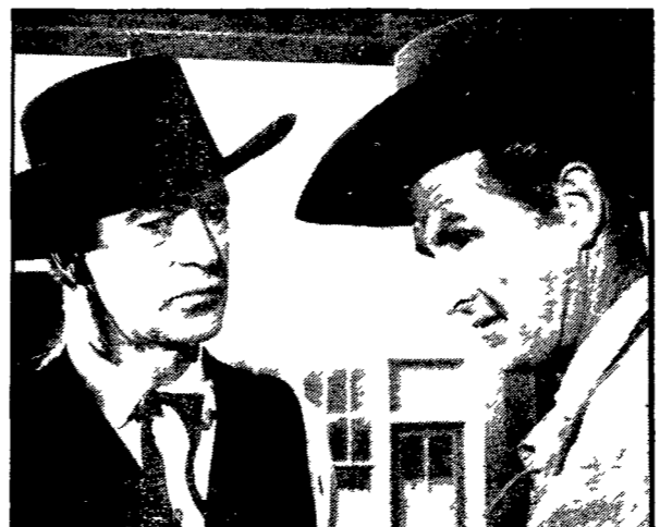
Una celebre immagine dell'epopea mitizzata del western classico cinematografico Gary Cooper e Brigitte Cloyd in « Mezzogiorno di fuoco ».

Ga perché — canzoni a parte — questo è stato ancora una volta il succo della gara canora di fine anno che la Rai Tv continua a presentarci come un favoloso successo. Ma e ve a giora quella di « Canzonissima »? Non c'è bisogno di attendere sentenze future per dare risposta. I colori che vi hanno partecipato sono furibondi e non risparmiarono e frecciate avvelenate. La verità sembra aver raggiunto perfino i camerieri della Rai Tv tanto che c'è speranza che quella di martedì sera l'ultima puntata di tutta la storia delle Canzonissime degli Studi di Unione Sabato Sera del passato.