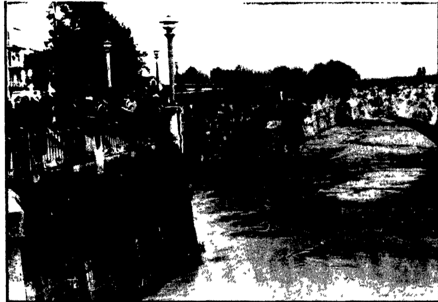
Crolli e fumi in piena in tutta la Campania flagellata dal maltempo. Eccone due esempi: la foto a sinistra mostra un terrapieno franato a Pozzuoli bloccando l'ingresso di tre edifici; novanta persone sono state salvate da vigili del fuoco, nella foto a destra, un gruppo di persone controlla a Capua il Volturino in piena