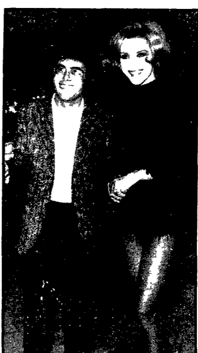
Al Bano e Alice Kessler