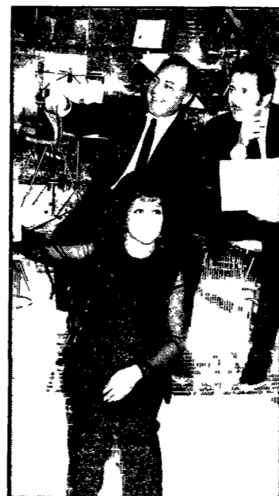
Tre finalisti Claudio Villa, Modugno e Orietta Berti