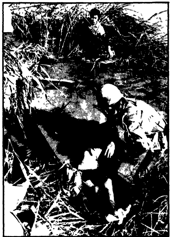
Riprendono i combattimenti nel Vietnam. Le forze di liberazione hanno condotto una serie di azioni vittoriose nella zona di Saigon dove si trovava il vice presidente americano Spiro Agnew. Fra l'altro un intero reparto di allievi ufficiali fucile è stato decimato. Da parte americana è stato annunciato che durante la tregua di Capodanno sono stati uccisi 101 vietnamiti e solo tre soldati USA sono stati feriti. Conferma indiretta delle violazioni da parte americana. Nella telefoto un soldato fantoccio raccoglie il cadavere di un guerrigliero ucciso in una imboscata A PAGINA 14

● Secca replica della Confederazione a quei governanti e al padronato che manovrano per un rincaro dei prezzi A PAGINA 4