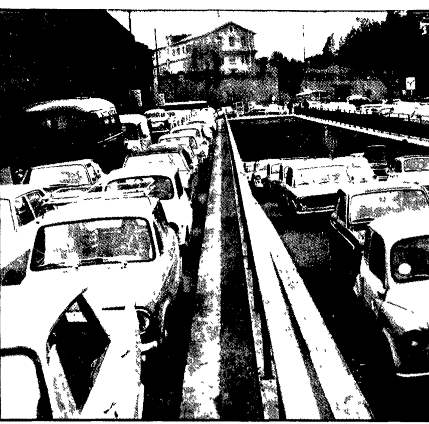
Per cinque ore hanno scioperato ieri nella capitale gli autotferrotranvieri nel quadro della lotta nazionale della categoria per il rinnovo del contratto di lavoro...