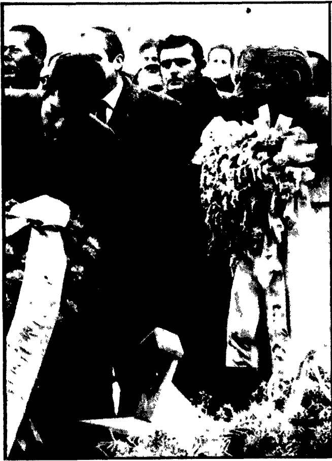
NOVI LIGURE, 2. La memoria di Fausto Coppi è stata ricordata questa mattina a Castellana... nel decimo anniversario della scomparsa del campionissimo...