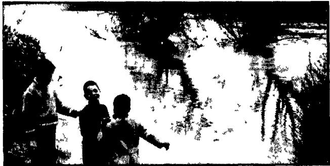
Pioggia e frane in Campania. Gravi danni sono stati provocati a Napoli e in tutta la Campania dal maltempo è bastato un acquazzone di poche ore per aprire voragini e causare crolli. Nella telefoto il Volturno in piena A PAGINA 6