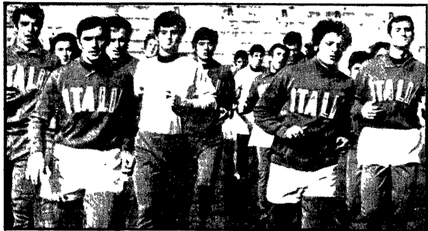
MADRID - L'ultimo allenamento sostenuto dagli «azzurri» al Bernabeu