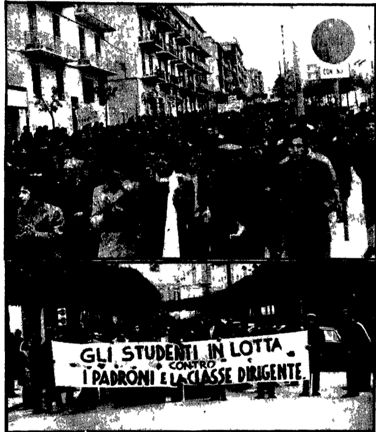
Scioperi e cortei a Matera e in altre località lucane. Un'ondata di agitazioni è in corso per protestare contro le peggiori condizioni di lavoro e di abitazione. Nella foto un aspetto del corteo che sono andati riprendendosi per le vie di Matera

Profonde ripercussioni delle dimissioni di Sandulli - Un appello di CGIL e UIL Iniziativa dei parlamentari comunisti della Commissione di vigilanza