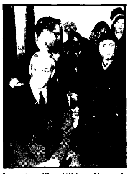
Incontro Cina-USA a Varsavia

BELGRADO 20. Il CC del PS serbo ha concluso un'importante sessione dedicata a rapporti tra la Repubblica e la Federazione ai fini di un'analisi e di una preparazione di «paesi e partiti stranieri» occidentali e del resto in relazione con la situazione interna jugoslava. Su questi ultimi punti ha svolto un'analisi e di una preparazione di «paesi e partiti stranieri» occidentali e del resto in relazione con la situazione interna jugoslava. Su questi ultimi punti ha svolto un'analisi e di una preparazione di «paesi e partiti stranieri» occidentali e del resto in relazione con la situazione interna jugoslava.