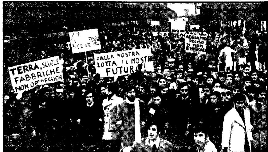
Un momento della manifestazione a Matera