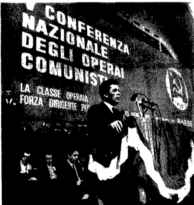
MILANO — Il compagno Berlinguer mentre pronuncia il suo discorso

Un caloroso clima di lotta nell'ultima seduta della conferenza. Altri interventi di operai - Nuovi reclutati al partito e annuncio di iniziative per la raccolta di abbonamenti a «L'Unità»