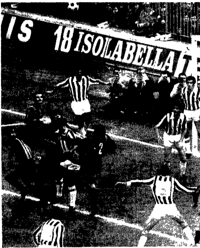
INTER-JUVENTUS — Una immagine eloquente della caotica partita di San Siro. Nell'area bianconera sono inquadri ben 11 giocatori, che diventano 12 con Anzolin.

Buona la prova del centrocampo partenopeo che alla fine è costretto però ad arrendersi