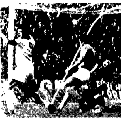
CAGLIARI NAPOLI — Nella prima foto Gori ha segnato il primo gol riprendendo un tiro di Riva respinto da Zoff. Nella seconda foto il gol di Riva su rigore.

Un derby risolto in un... (text continues with match analysis and commentary on player performances and team strategies).