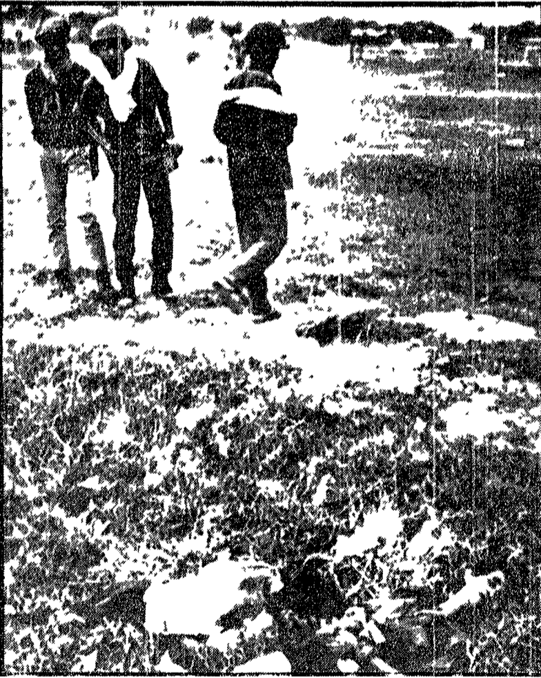
Truppe sudvietnamite con ufficiali USA sono penetrate in territorio cambogiano per attaccare reparti di patrioti del Fronte di Liberazione cambogiano. Nella foto soldati del governo filo-americano in un campo dove sono stati ammazzati i corpi dei vietnamiti massacrati. A PAG. 14

Le impostazioni e gli obiettivi del PCI per la grande battaglia elettorale del 7 giugno sono stati illustrati al Comitato centrale e alla Commissione centrale di controllo dal compagno Enrico Berlinguer, vice segretario del partito. Nella sua relazione — di cui pubblichiamo un ampio riassunto a pagina 7 — Berlinguer ha rilevato che la consultazione del 7 giugno si svolgeva sul terreno che noi comunisti abbiamo scelto e imposto — quello del rinnovamento dei Consigli comunali e provinciali e della istituzione dei Consigli regionali — e ha sottolineato l'obiettivo di schieramenti nuovi e unitari di sinistra nei Comuni, nelle Province e nelle Regioni, per la liquidazione del centro-sinistra e per creare le condizioni di una svolta a sinistra nella politica italiana.