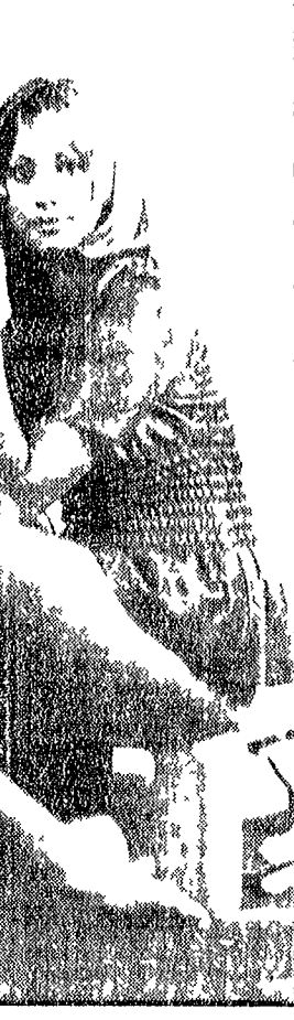
LONDRA - La venenosa attrice italiana Orchidea De Santis...