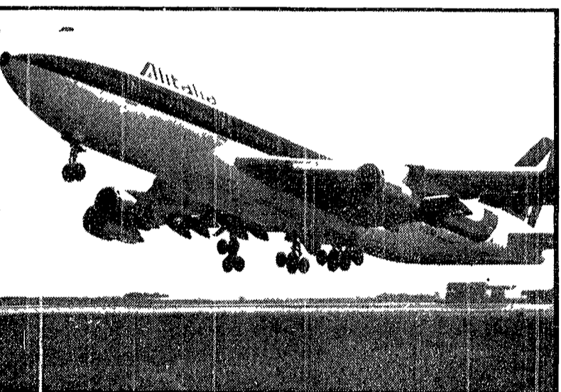
Il primo Jumbo-Alitalia A Everett (Washington) il quadriglietto Boeing 747 dell'Alitalia, noto come Jumbo, ha come pilota il primo decollo il gigantesco aereo, che pesa 322 tonnellate e può trasportare 362 passeggeri, giungerà in Italia il 20 maggio ed entrerà in servizio sulla rotta Roma New York il 5 giugno p.v.

Ha sedotto a San Vittore una detenuta... «Da tre mesi attende un bimbo - Lui ora addetto alle pulizie, lei alla lavanderia»