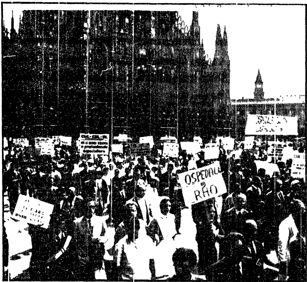
Un momento della manifestazione degli ospedalieri ieri a Milano