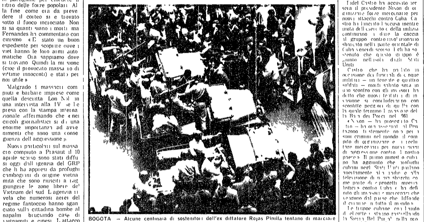
BOGOTA — Alcune centinaia di sostenitori dell'ex dittatore Rojas Pinilla tentano di marciare verso il palazzo del presidente della repubblica, dopo che il loro leader ha dichiarato, nono...

«Gli invasori — ha detto il Premier — sono mercenari che vengono dal paese che diffonde il crimine in tutto il mondo» - Mostrare alla TV le armi americane catturate negli scontri