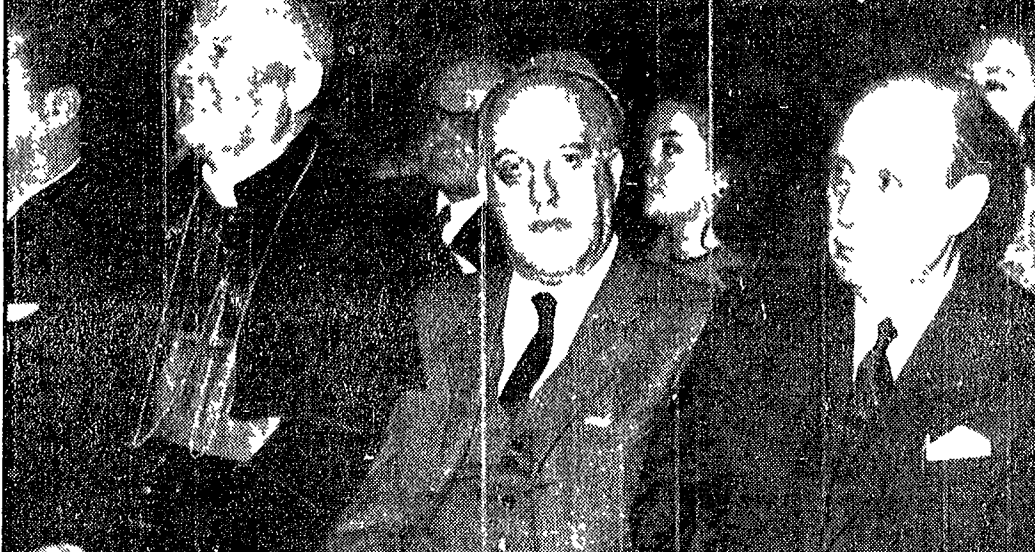
Roma ha celebrato ieri il 2723° anniversario della sua fondazione. La manifestazione celebrativa ufficiale si è tenuta nella sala capitolina Orati e Curiaz con un discorso del sindaco Darida. Mentre si svolgeva la cerimonia sul piazzale dei Campidoglio un folto gruppo di baraccati (come si vede nella foto in alto) ha dato vita a una manifestazione per la casa. «Non vogliamo più vivere nelle baracche» - hanno gridato i manifestanti alle autorità governative e comunali. Nella foto in basso tre partecipanti alla cerimonia il card. Angelo Dell'Acqua, il gen. De Lorenzo e l'ex sindaco Rebecchini, al cui nome è legata la decisione di dare il «via» all'assalto edilizio di Monte Mario, una delle più belle zone a verde della capitale.