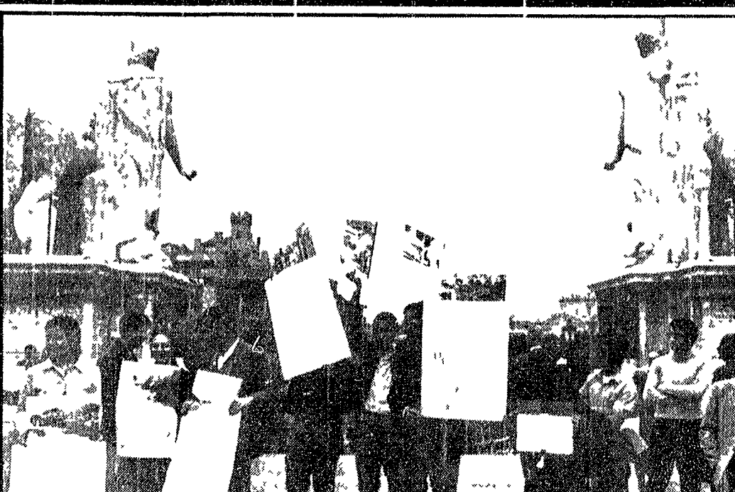
Roma ha celebrato ieri il 2723° anniversario della sua fondazione. La manifestazione celebrativa ufficiale si è tenuta nella sala capitolina Orati e Curiaz con un discorso del sindaco Darida. Mentre si svolgeva la cerimonia sul piazzale dei Campidoglio un folto gruppo di baraccati (come si vede nella foto in alto) ha dato vita a una manifestazione per la casa. «Non vogliamo più vivere nelle baracche» - hanno gridato i manifestanti alle autorità governative e comunali. Nella foto in basso tre partecipanti alla cerimonia il card. Angelo Dell'Acqua, il gen. De Lorenzo e l'ex sindaco Rebecchini, al cui nome è legata la decisione di dare il «via» all'assalto edilizio di Monte Mario, una delle più belle zone a verde della capitale.