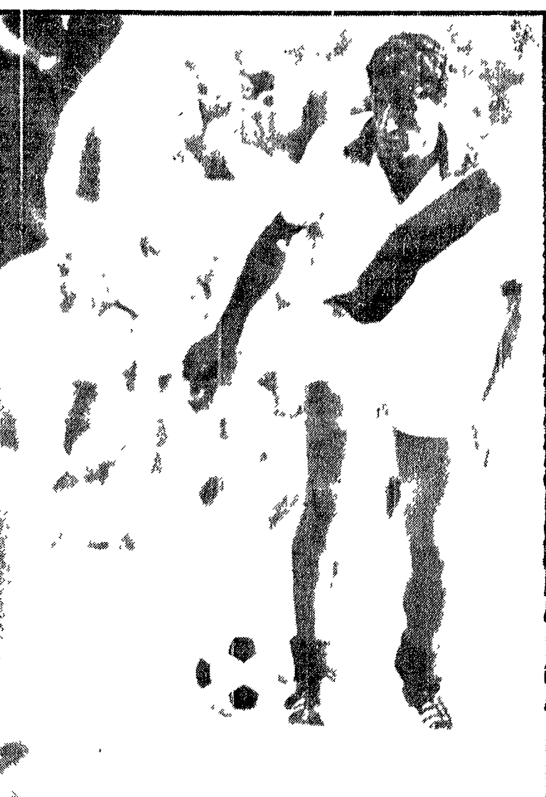
PEIRO'. In lui Herrera spera molto