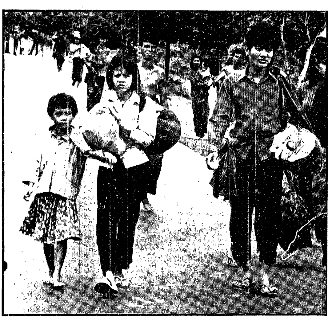
IN FUGA DALLE CITTÀ DEVASTATE Famiglie cambogiane fuggono da Kompong Speu, in cui è in corso una battaglia fra i mercenari americani e le forze patriottiche. L'aviazione USA prosegue i bombardamenti devastatori spingendosi fino a 160 chilometri di profondità. Le atrocità della guerra colpiscono sempre più un popolo pacifico e neutrale, vittima dell'aggressione imperialista A PAGINA 10