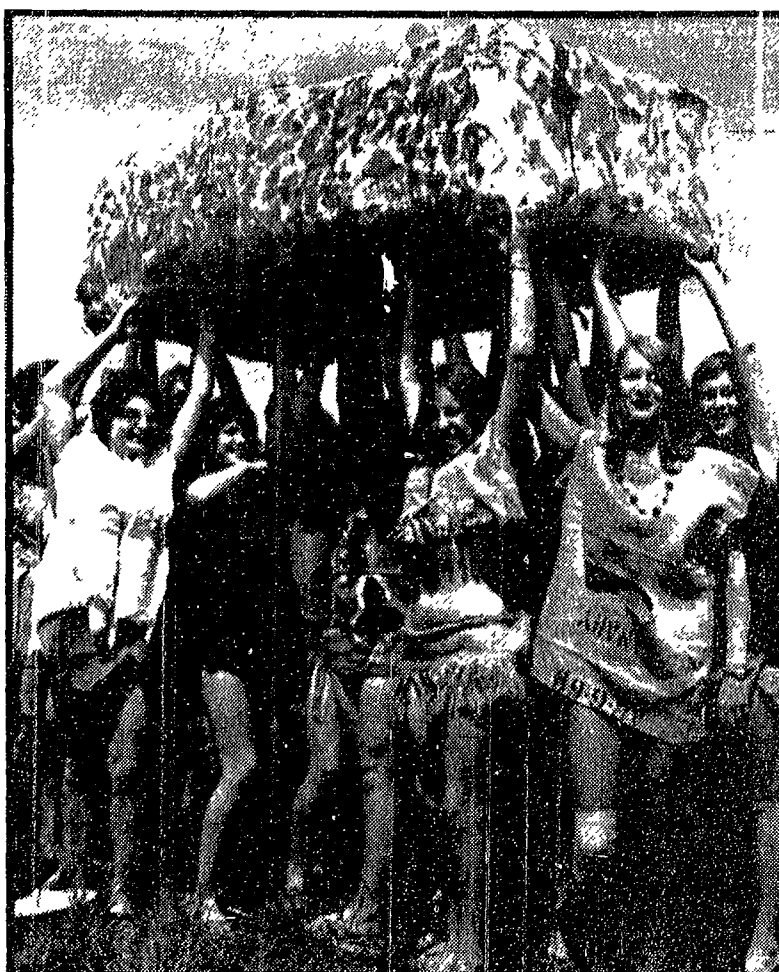
PREISTORIA IN CARTAPESTA In memoria degli antichi ceti loro antenati le ragazze scozzesi di Stonehenge rinnovano un rito preistorico che risale ai famosi druidi...