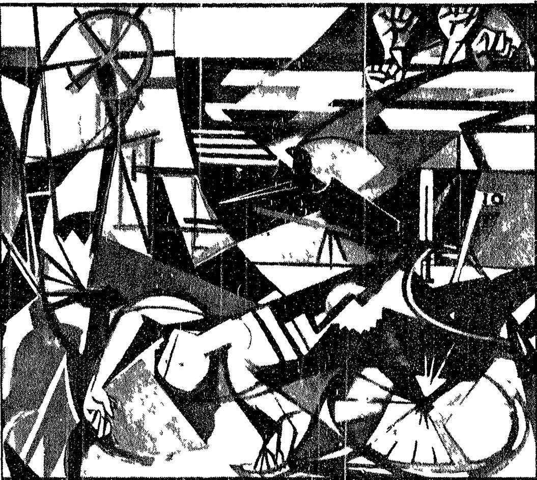
Armando Pizzinato « Bracciale ucciso » 1949

La nascita del « ribelle » - I contatti con Cagli, Mirko, Mafai, Afro, Viani, Vedova e Guttuso fra il '30 e il '42 - Dalla lezione cubista al movimento realista. Il tema del paesaggio - Uno degli artisti più vivi della seconda generazione