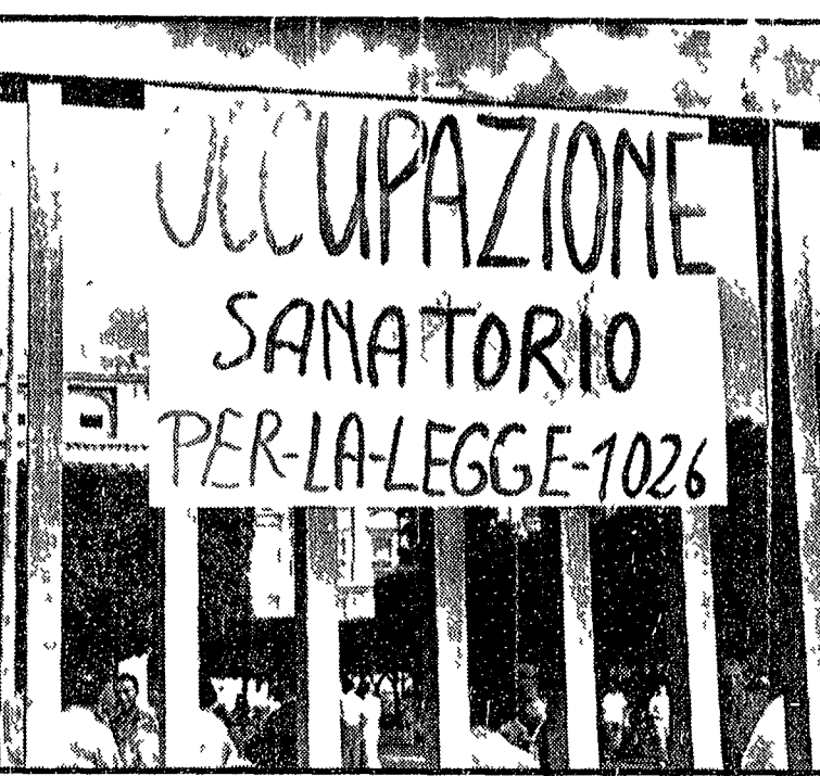
Un momento della occupazione del Forlanini