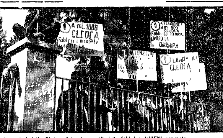
I lavoratori della Cledca dietro i cancelli della fabbrica dell'ENI occupata