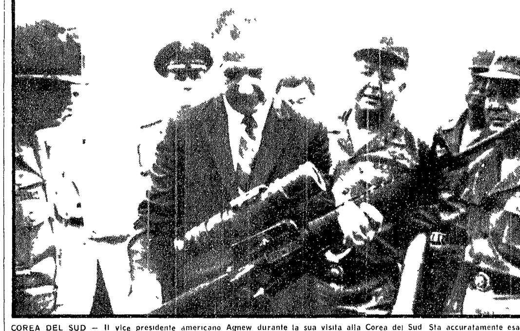
COREA DEL SUD - Il vice presidente americano Agnew durante la sua visita alla Corea del Sud. Sta accuratamente esaminando un fucile M16, dotato di mirino telescopico

MOSCA, 27. Sergei Vinogradov, ambasciatore sovietico al Cairo e morto oggi a Mosca all'età di 63 anni dopo una breve e grave malattia. La morte dell'eminente diplomatico è stata annunciata in serata nella capitale sovietica con un comunicato che recita la firma di Breznev, Kossygin e Podgornij e ne parla in termini di cordoglio del partito e del governo sovietici per la scomparsa di un uomo che ha dato tutta la sua vita e le sue conoscenze e le sue energie alla causa del Partito comunista e al popolo sovietico.