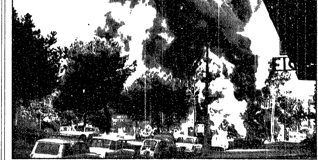
Fiamme alte 30 metri, momenti di terrore in uno dei quartieri più popolati della capitale, la strada Aurelia bloccata per ore: ieri mattina alle 9, in largo Carpegna quasi all'inizio della statale n. 1, un'autocisterna carica di 25.000 litri di benzina, è andata improvvisamente a fuoco. Il rogo si è sviluppato mentre era in corso il rifornimento ad una stazione di servizio. Un torrente di fuoco si è rovesciato sulla strada distruggendo tre auto. A PAGINA 6