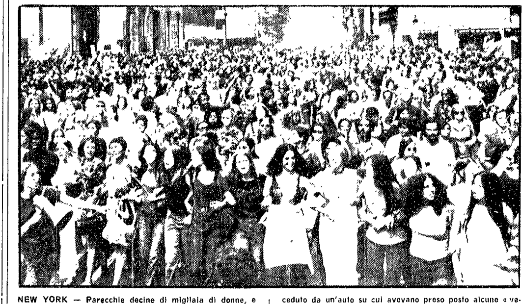
NEW YORK - Parecchie decine di migliaia di donne, e anche uomini, hanno dato vita ieri pomeriggio ad un corteo che ha attraversato le principali vie del centro, in occasione della giornata nazionale di lotta organizzata dal Movimento di liberazione della donna. Il corteo era preceduto da un'auto su cui avevano preso posto alcune « veterane » del movimento femminista americano. Analoghe manifestazioni, anche se con minor partecipazione numerica, hanno avuto luogo a Washington, Boston, Chicago, Los Angeles, Miami ed Indianapolis. A PAGINA 3