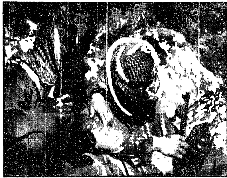
Due guerriglieri del Fronte democratico popolare in una grotta presso il fronte nella Giordania settentrionale