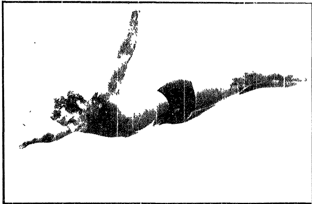
TORINO — KLAUS DIBIASI in piena azione