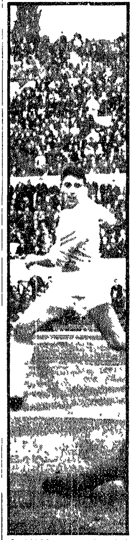
DOLSO sta conquistandosi il posto di titolare